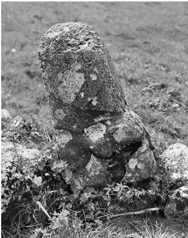
Vue rapprochée d'une des deux faces.

39, Prémanon, lieudit : Source de la Valserine