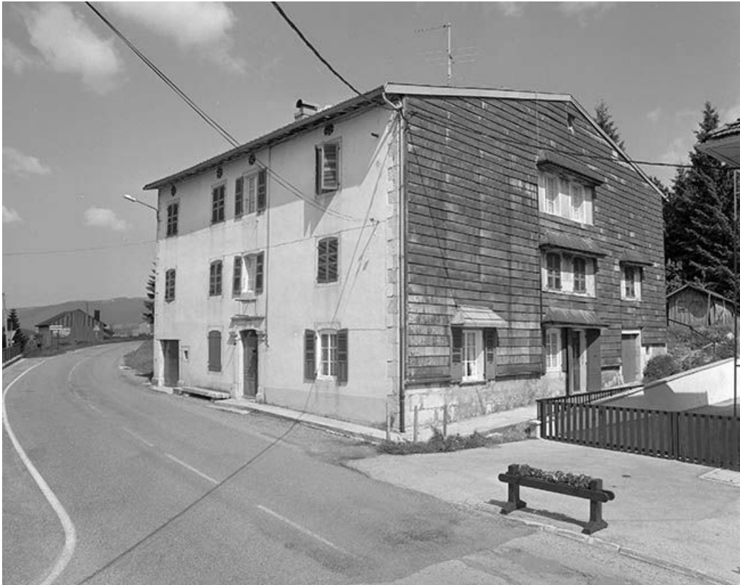
Façade antérieure et face droite.