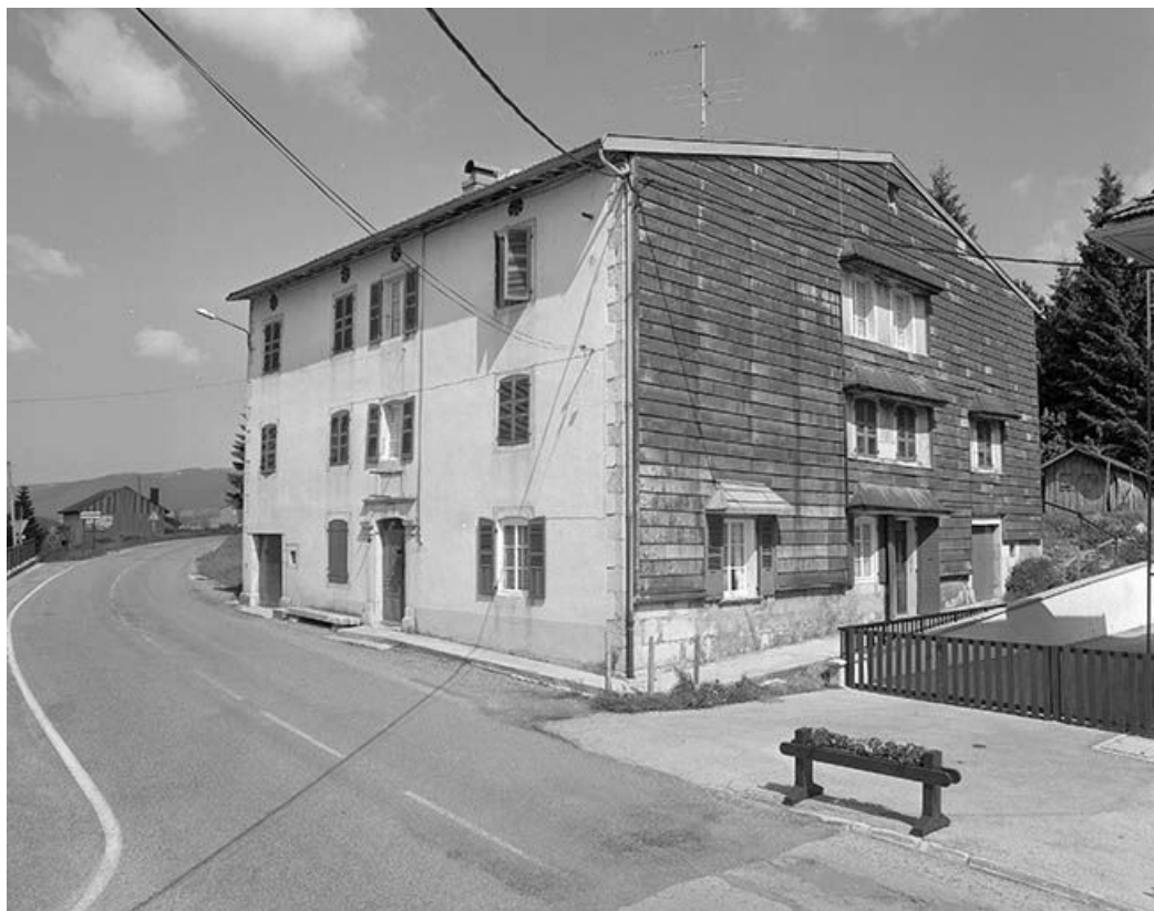
Façade antérieure et face droite.