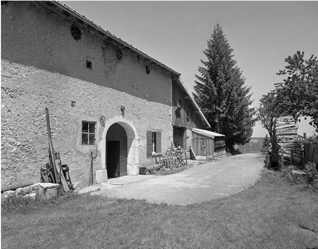
Façade postérieure, entrée de grange.