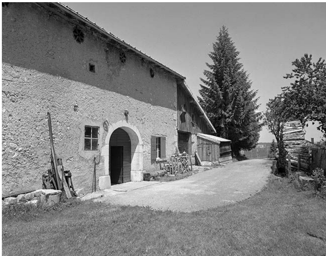
Façade postérieure, entrée de grange.