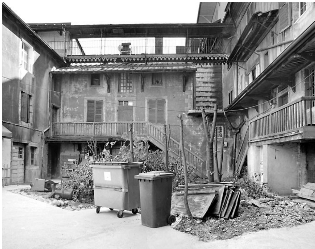
Vue d'ensemble de la cour, depuis le porche au nord.