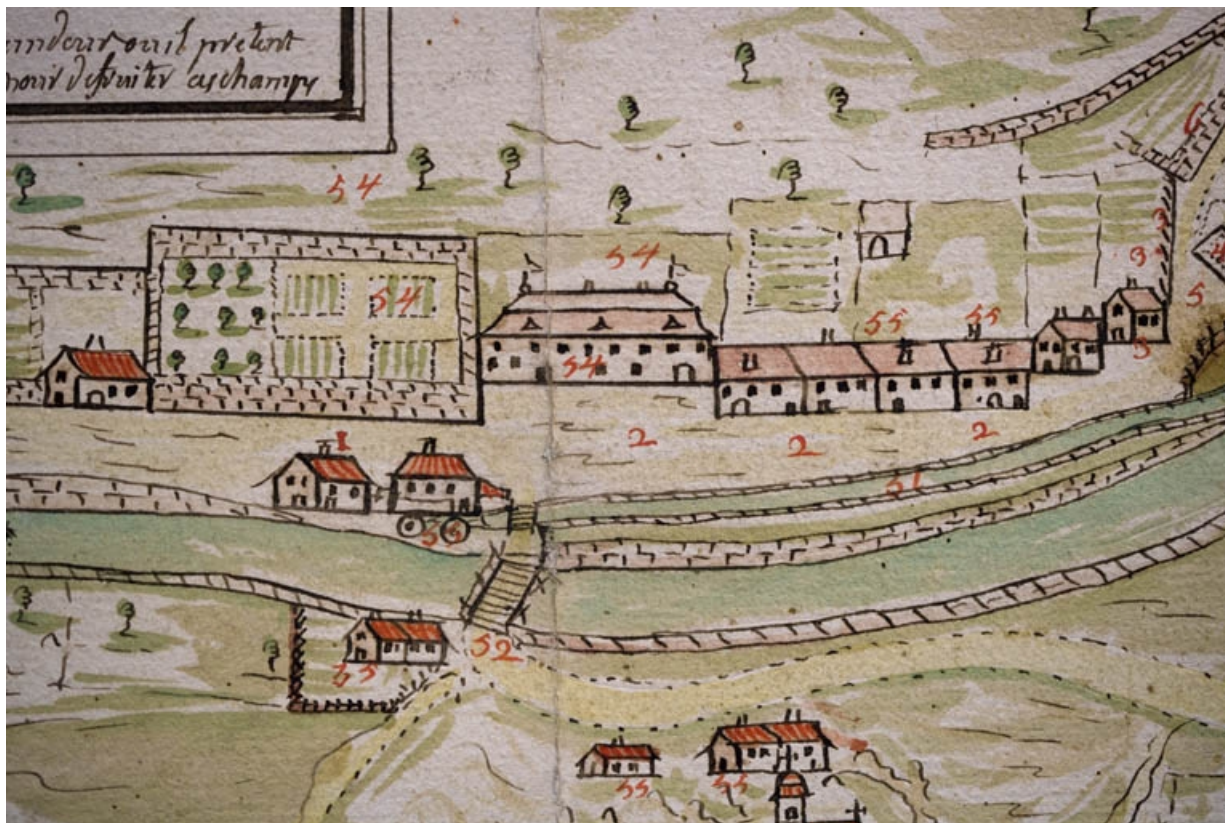
Plan géométrique d'un chemin contesté à Morez par le Sr Chavin et par le Sr Reverchon dud[it] lieu, fait par Jean Gaspard Fournier [... Détail], 1748.