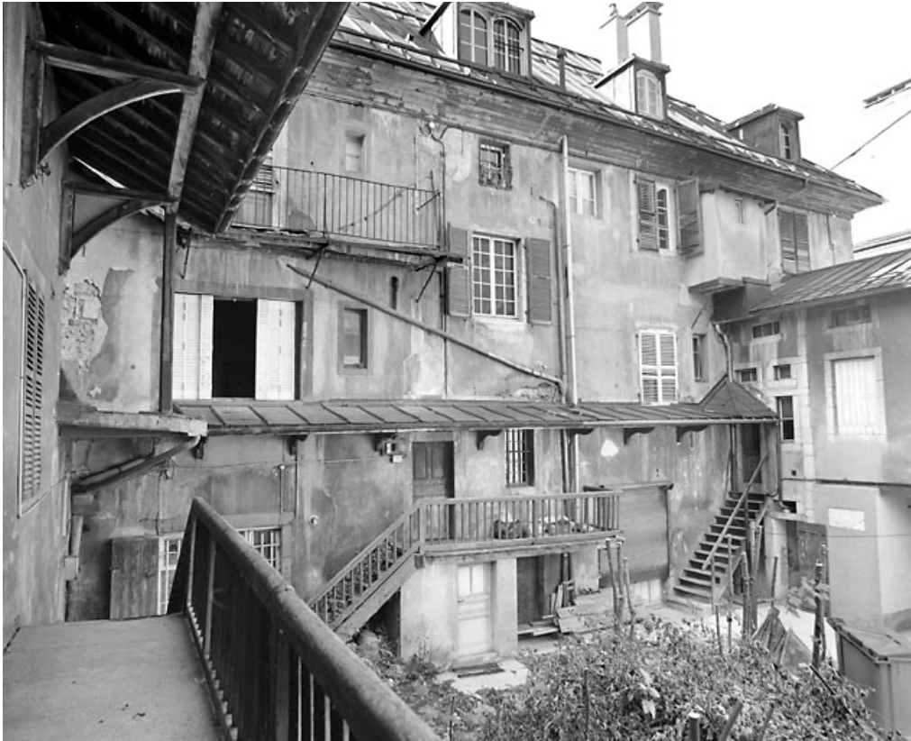
Élévation postérieure, de trois quarts gauche.