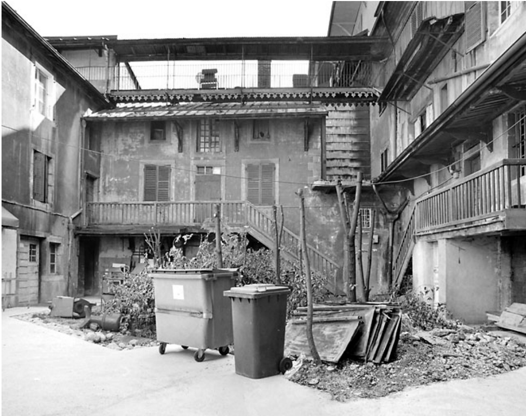
Vue d'ensemble de la cour, depuis le porche au nord.