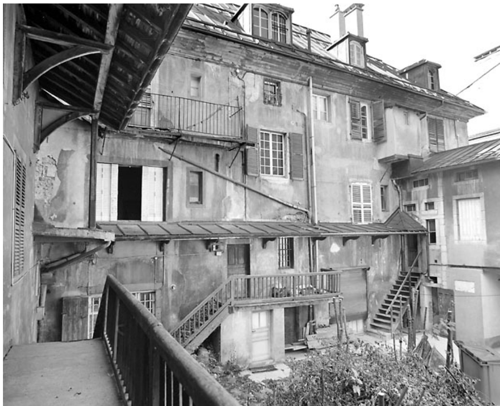
Élévation postérieure, de trois quarts gauche.