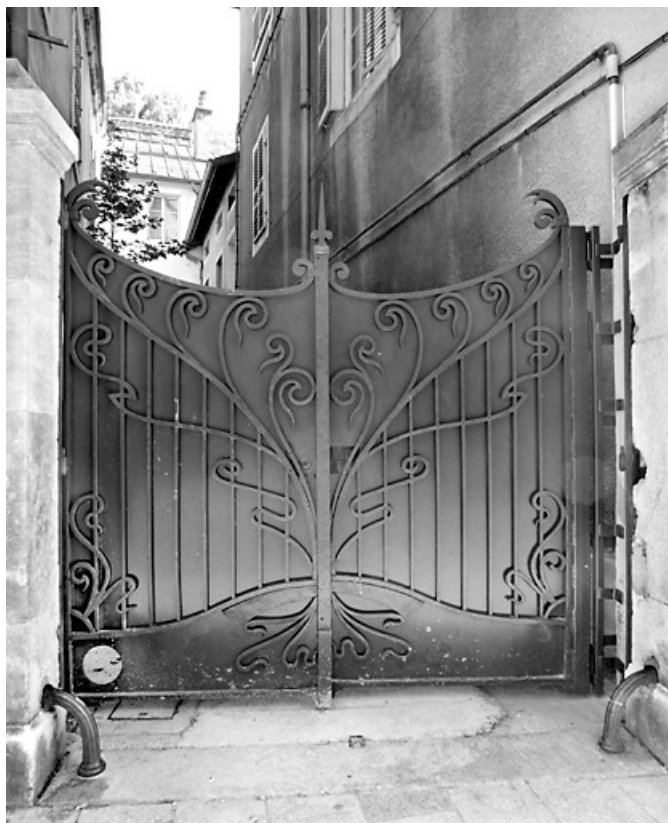
Grille avec ferronnerie à motif art déco.