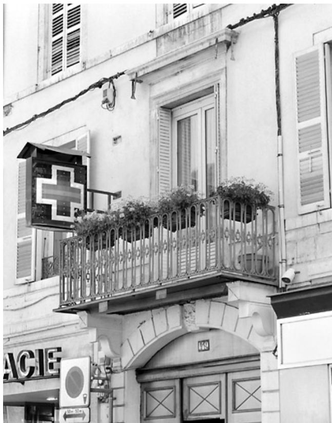
Porte-fenêtre du premier étage et balcon.