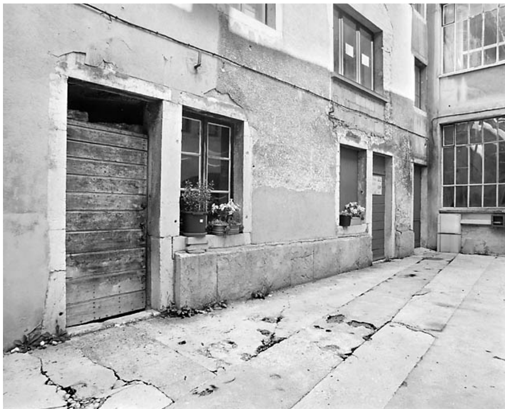
Aile nord : rez-de-chaussée, de trois quarts gauche.