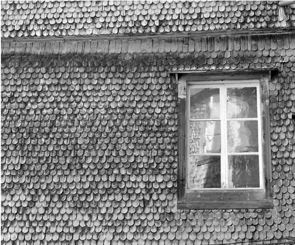
Escalier sud : fenêtre au dernier niveau et tavaillons (bardeaux).