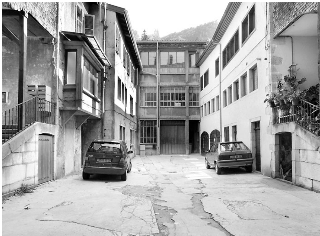
Vue d'ensemble des bâtiments dans la cour.