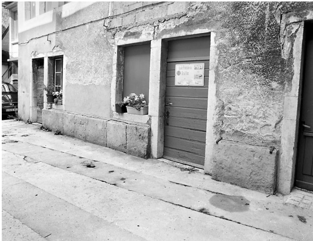
Aile nord : rez-de-chaussée, de trois quarts droite.