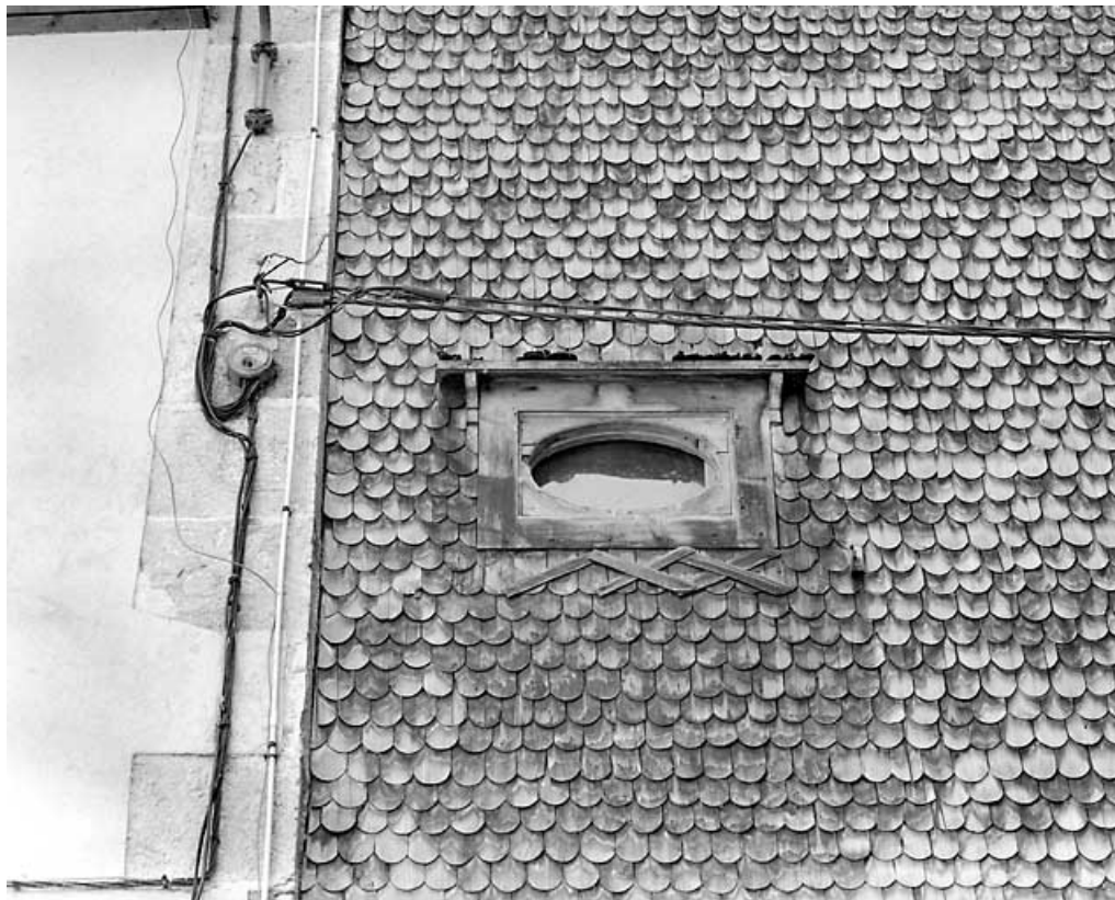
Escalier sud : oculus et tavillons (bardeaux).