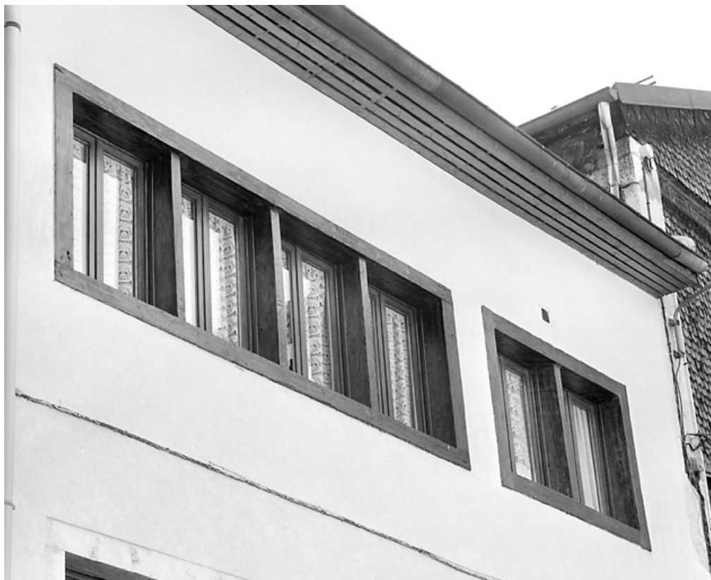
Aile sud : fenêtres lunetières du deuxième étage carré.