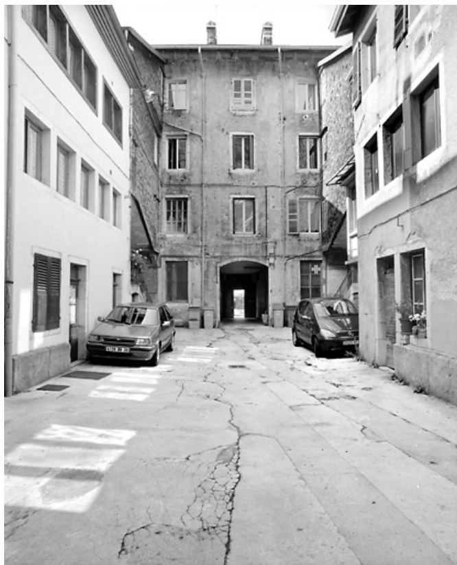
Façade postérieure et cour.