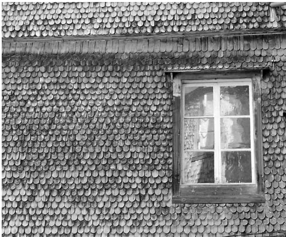
Escalier sud : fenêtre au dernier niveau et tavaillons (bardeaux).