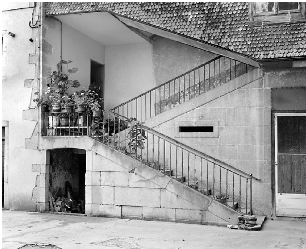
Escalier sud : cage ouverte au rez-de-chaussée.