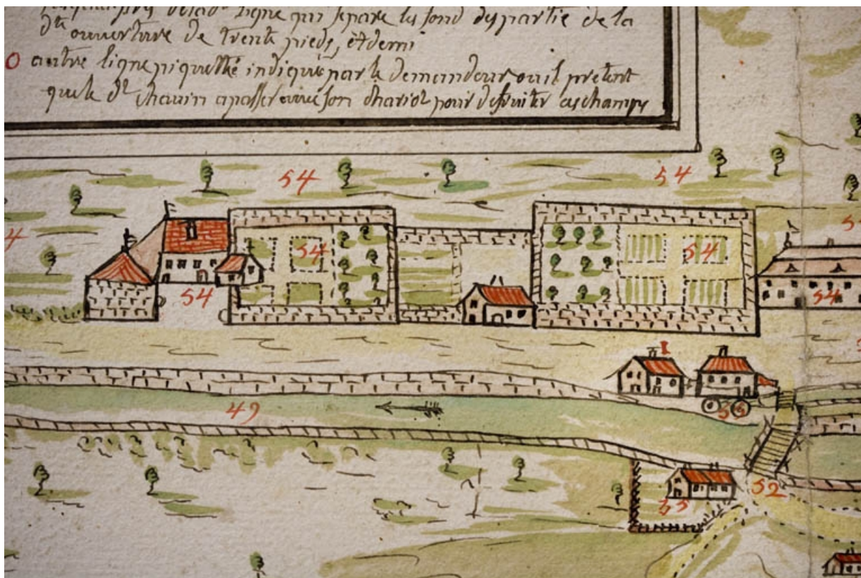
Plan géométrique d'un chemin contesté à Morez par le Sr Chavin et par le Sr Reverchon dud[it] lieu, fait par Jean Gaspard Fournier [... Détail], 1748.