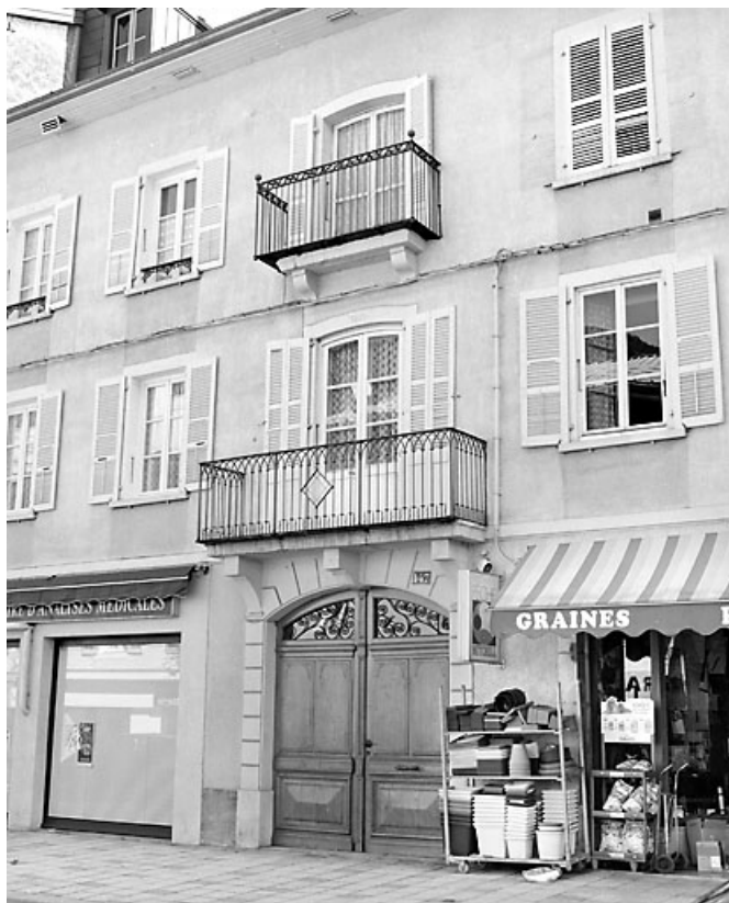
Façade antérieure, de trois quarts droite.