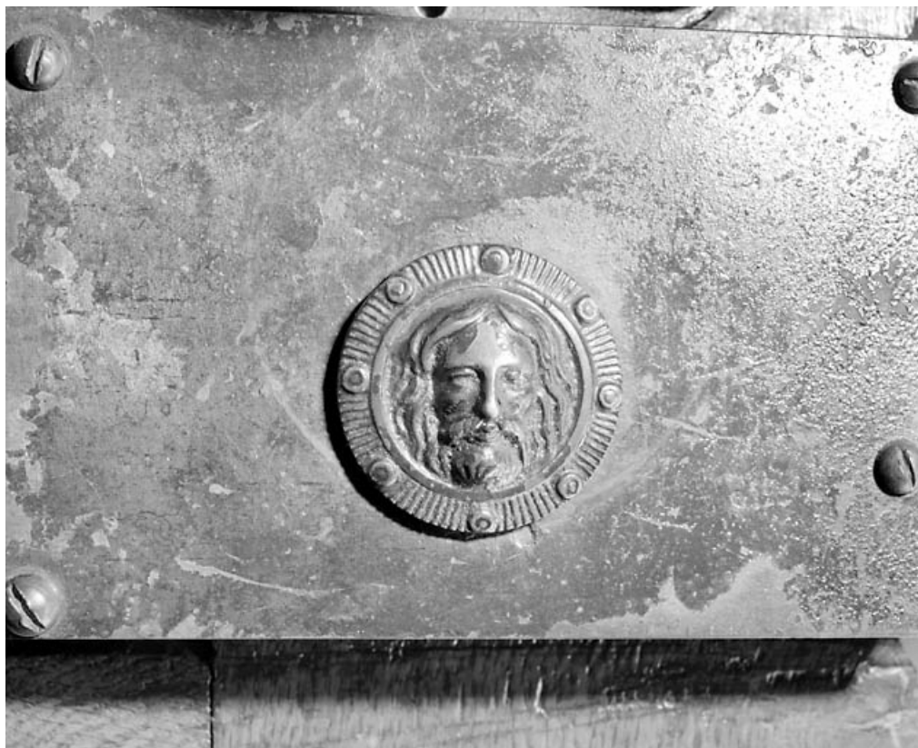
Porte principale : détail de la serrure.