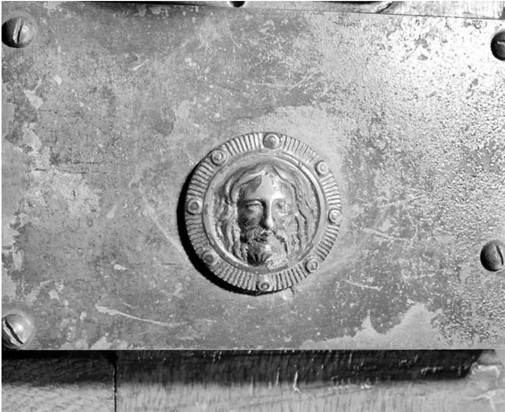
Porte principale : détail de la serrure.