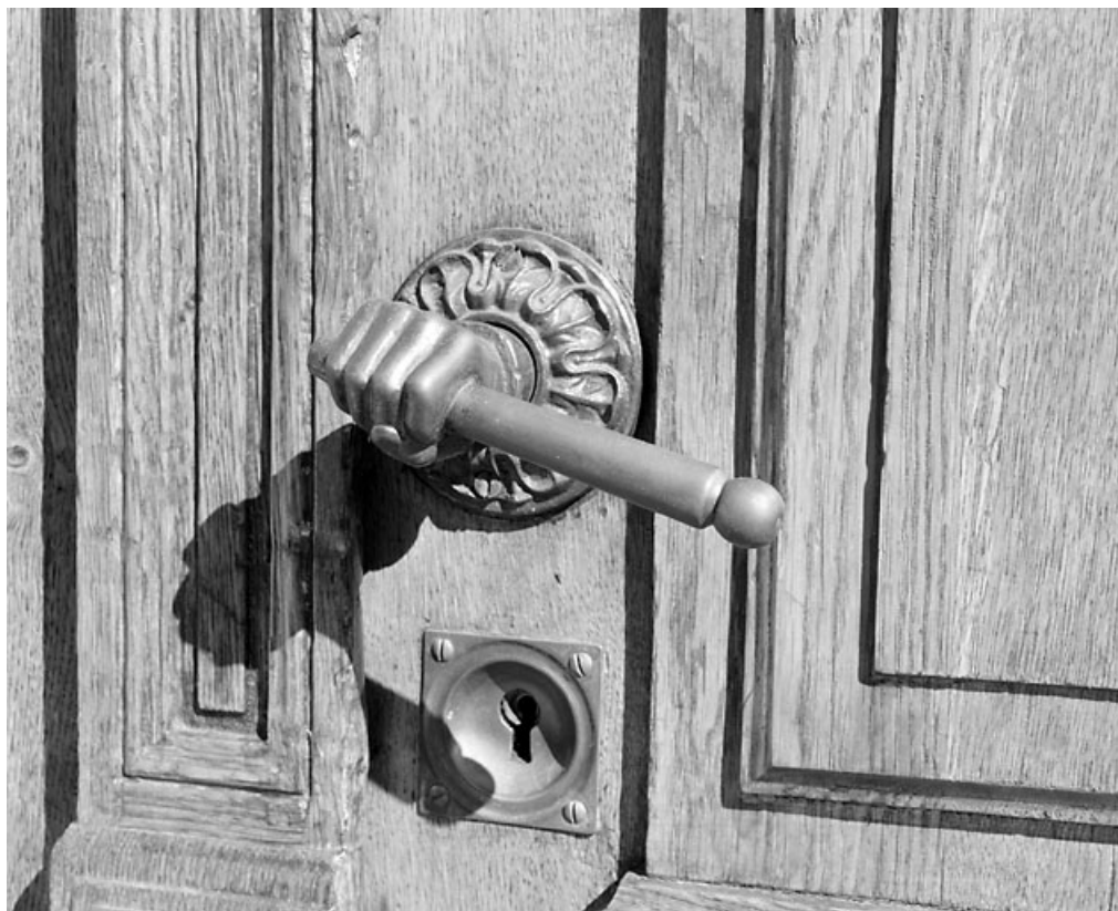
Porte principale : poignée en forme de main.