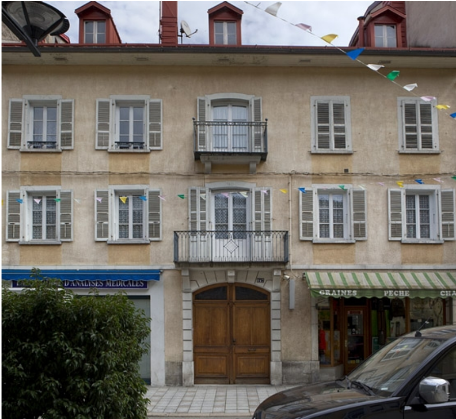
Vue d'ensemble de la façade antérieure.