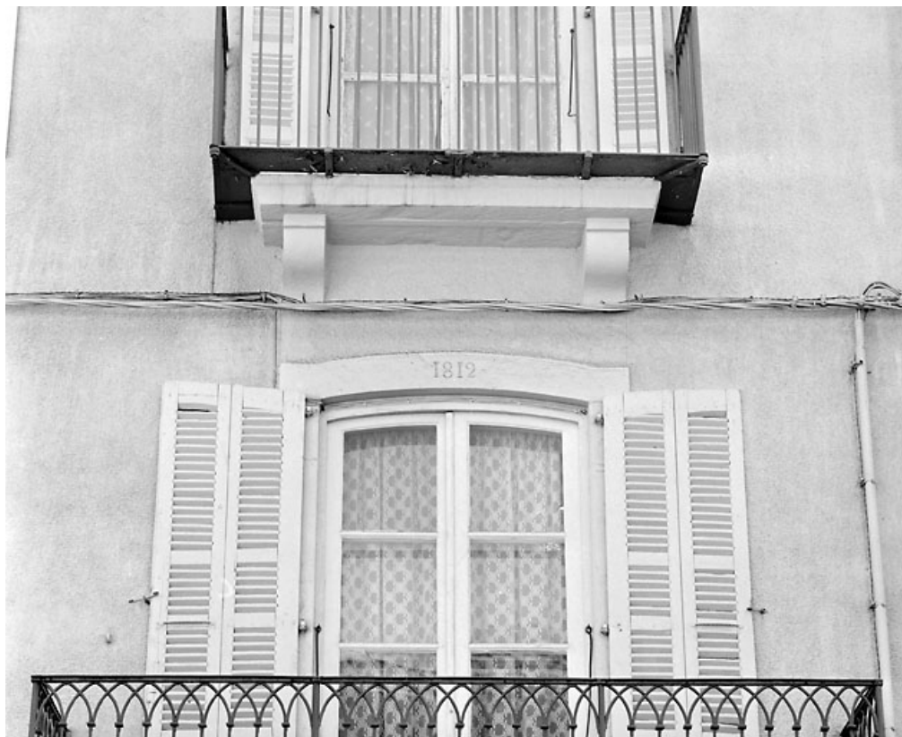
Linteau daté de la porte-fenêtre du premier étage.