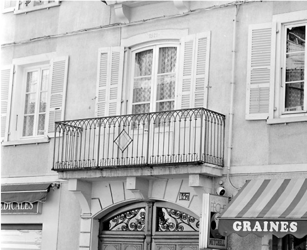
Porte-fenêtre et balcon du premier étage.