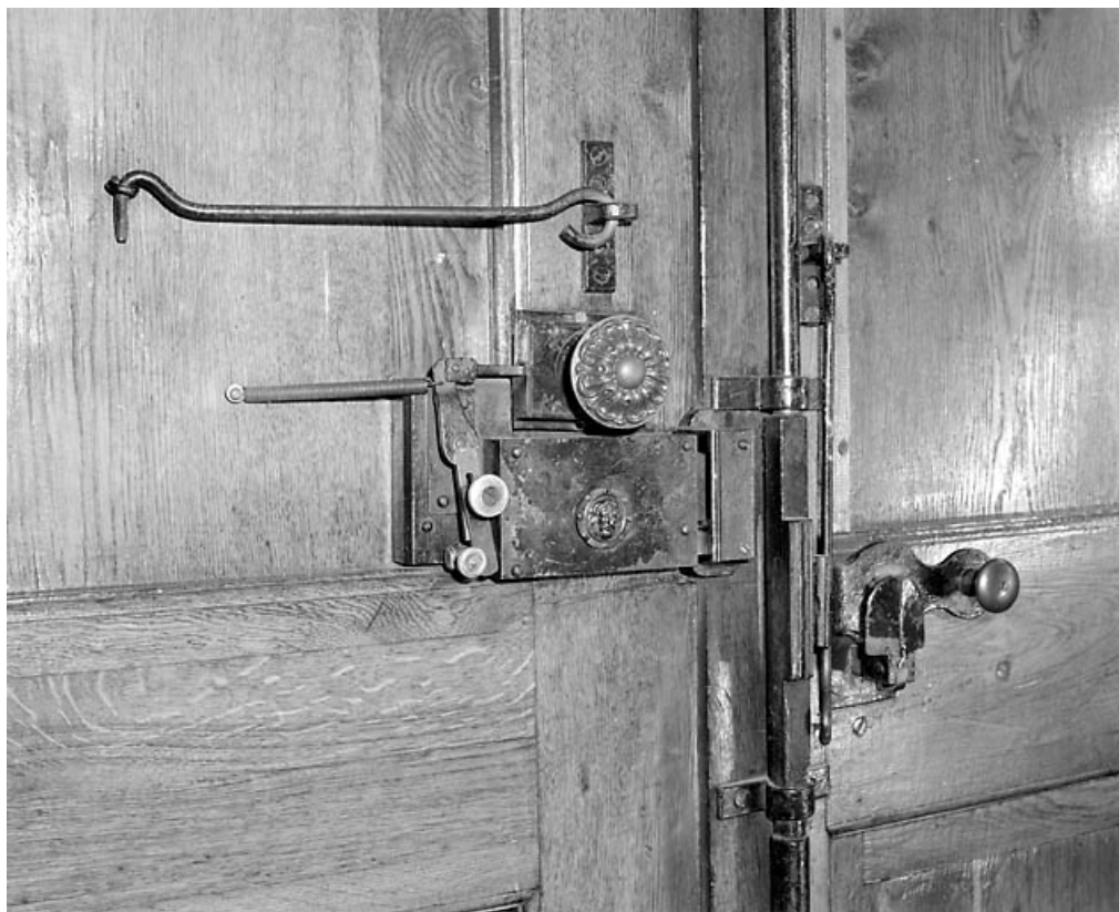
Porte principale : serrure et fermeture intérieure.