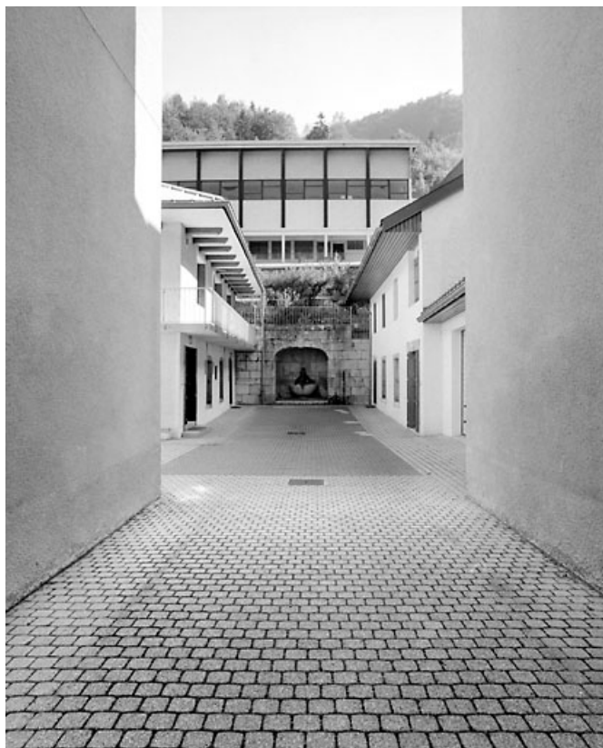
Vue d'ensemble de la cour et des anciennes dépendances.