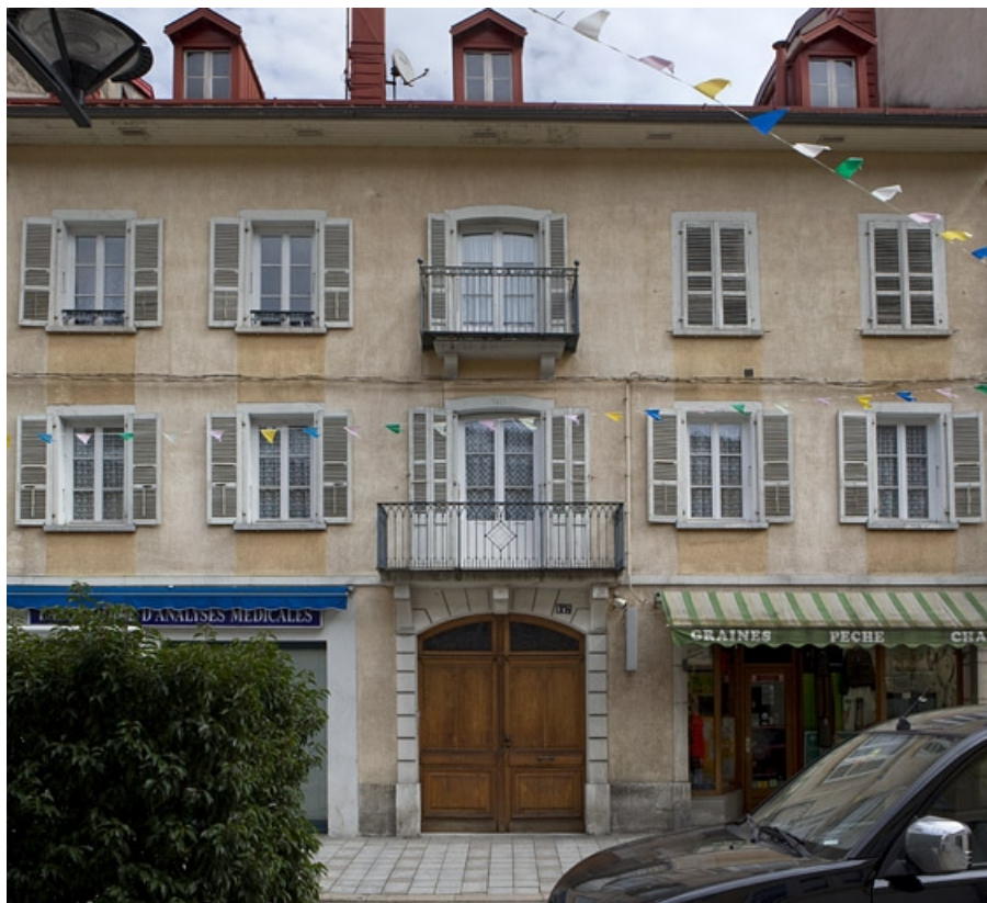
Vue d'ensemble de la façade antérieure.