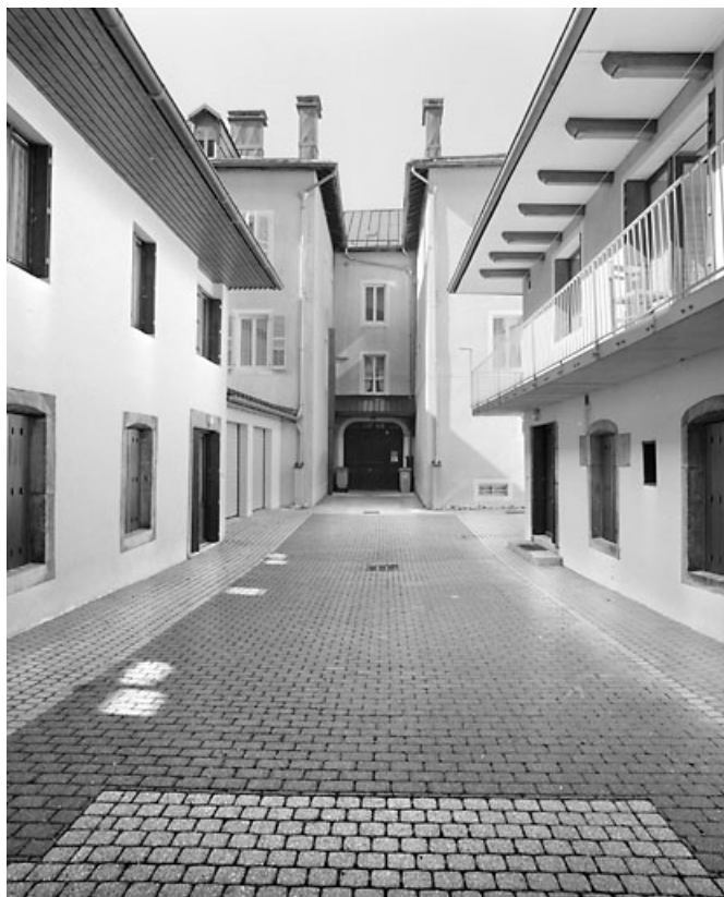
Vue d'ensemble de la façade postérieure et de la cour.