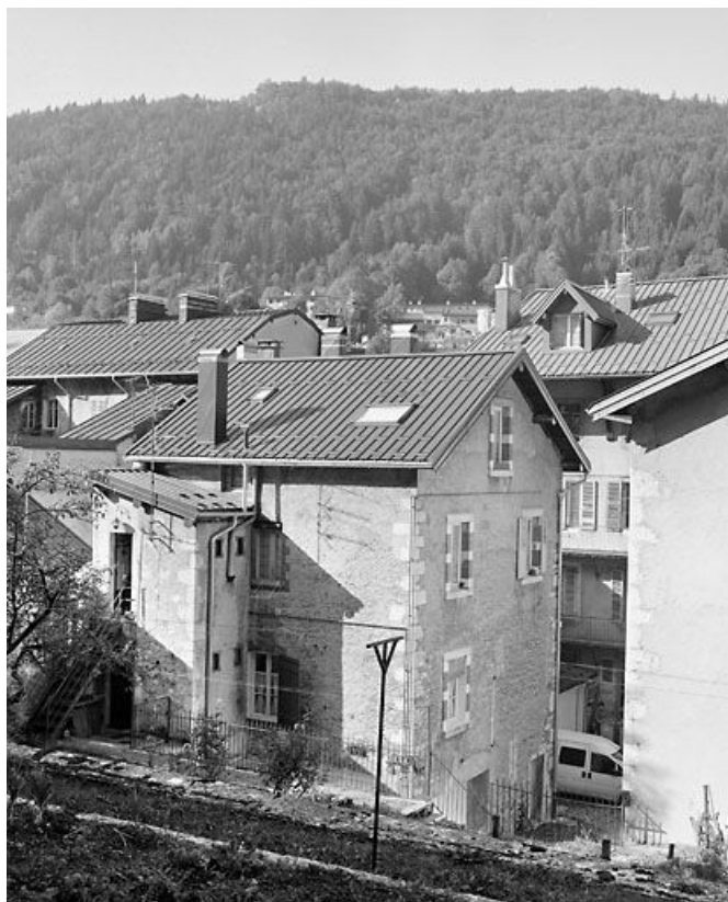
Bâtiment sud, vu du jardin.