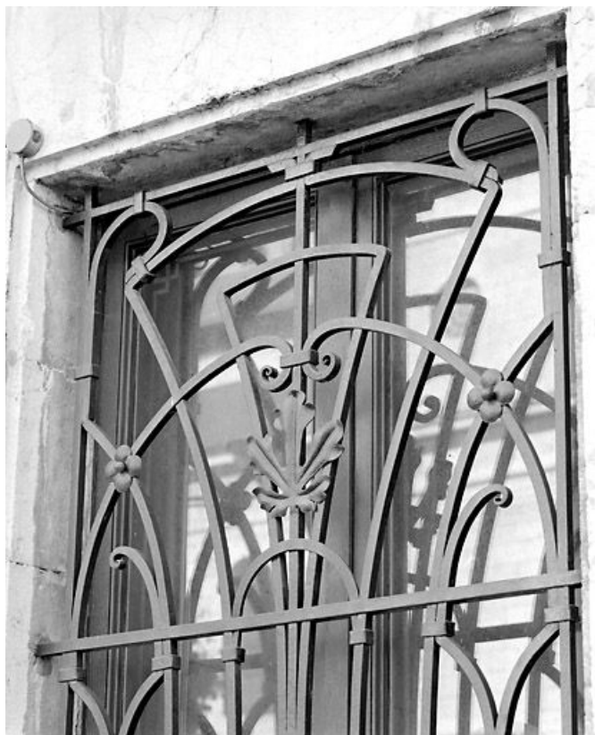
Façade latérale gauche : détail de la grille.