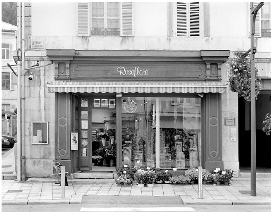
Façade antérieure : devanture de boutique.