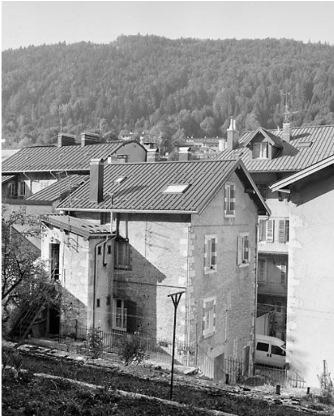
Bâtiment sud, vu du jardin.