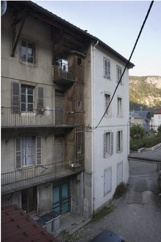
Façade postérieure, de trois quarts gauche. 39, Morez, 145 rue de la République