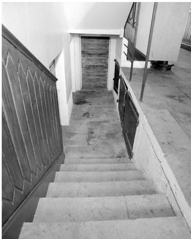
Escalier : volée menant au sous-sol. Noter les trois niches à droite.