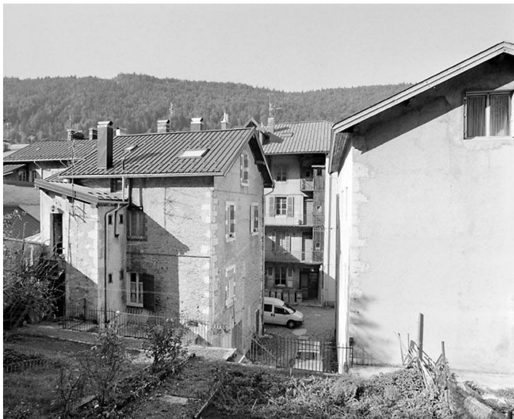
Vue d'ensemble depuis le jardin (à l'est).