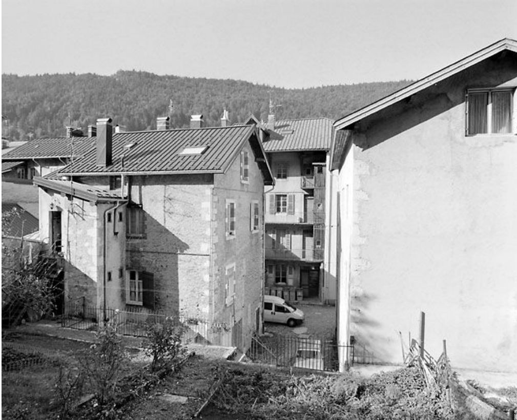
Vue d'ensemble depuis le jardin (à l'est).