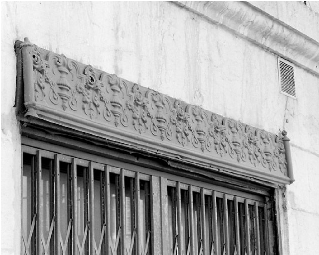
Façade latérale gauche : décor en tôle estampée.