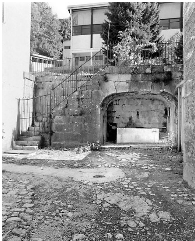
Immeuble (19e siècle) au n° 145 rue de la République : fontaine, escalier isolé et mur de soutènement. Immeuble (AI 69). 39, Morez, 145 rue de la République