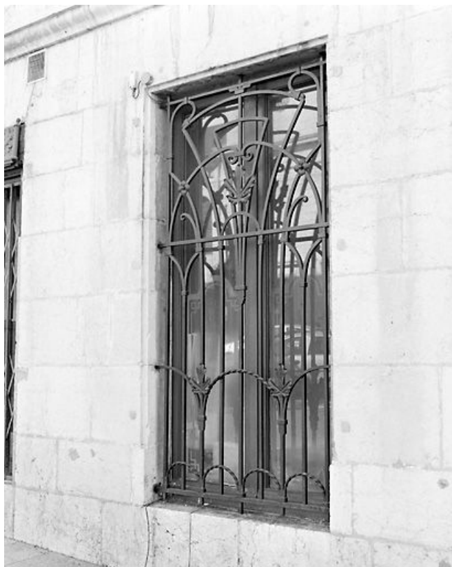
Façade latérale gauche : grille Art déco.