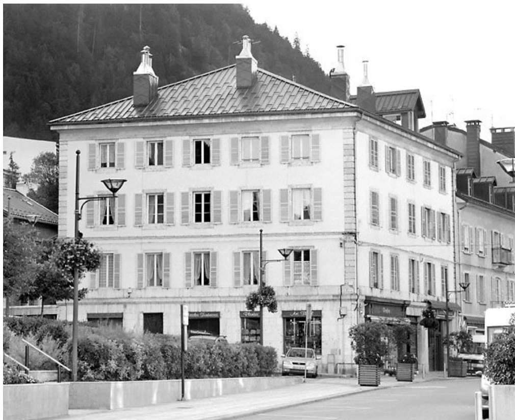
Vue d'ensemble, de trois quarts gauche.