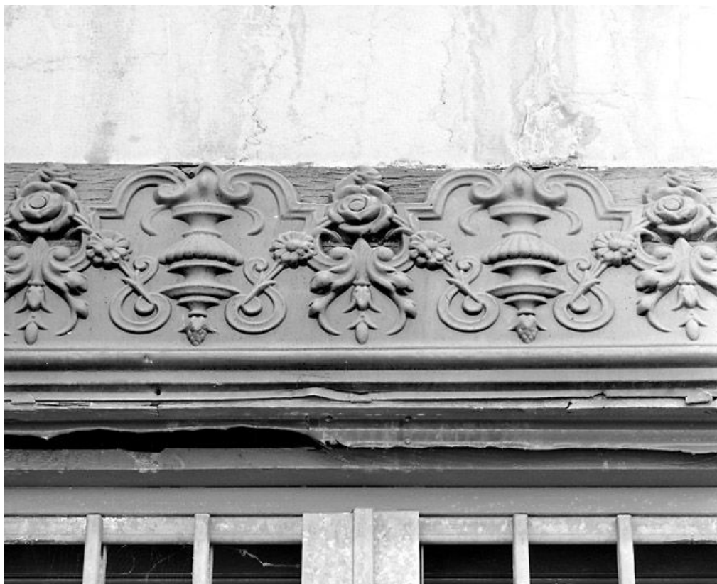
Façade latérale gauche : détail du décor.