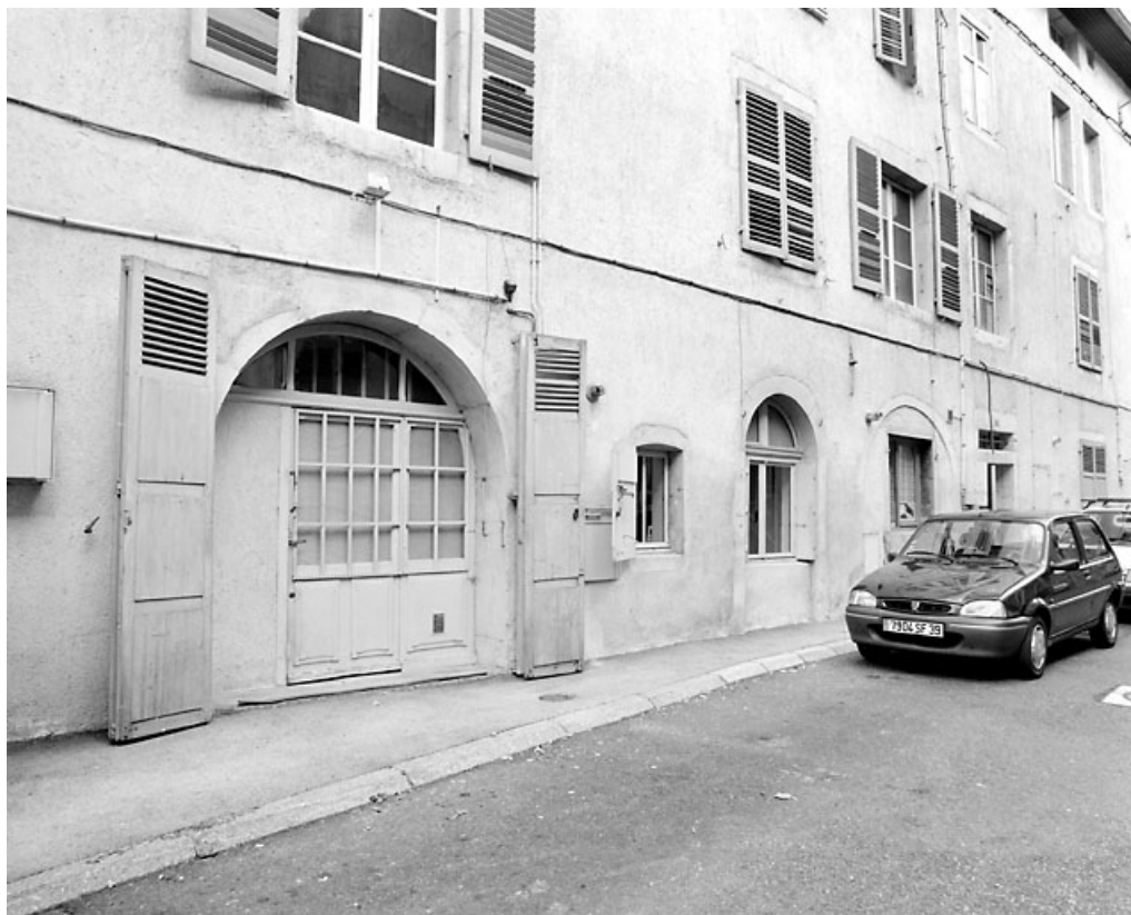
Élévation postérieure : baies du rez-de-chaussée.