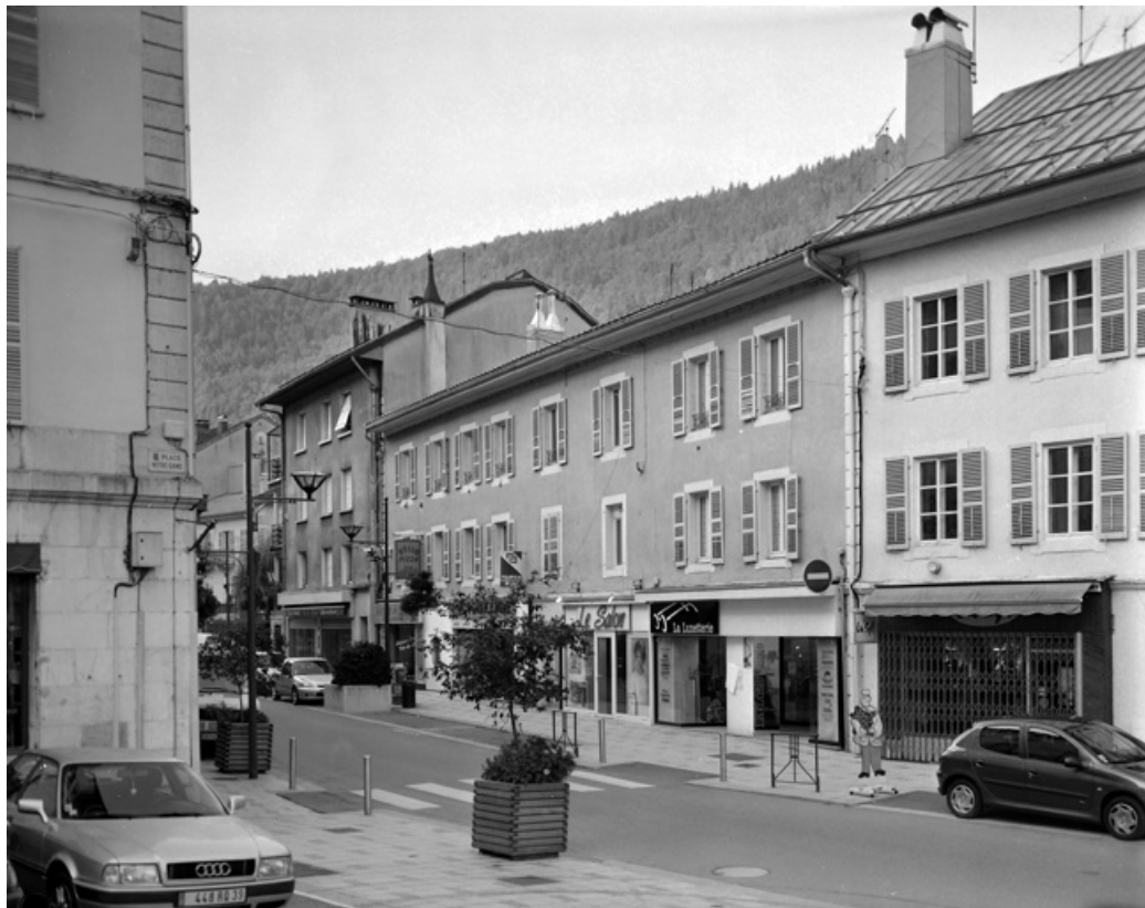
Vue d'ensemble, rue de la République.