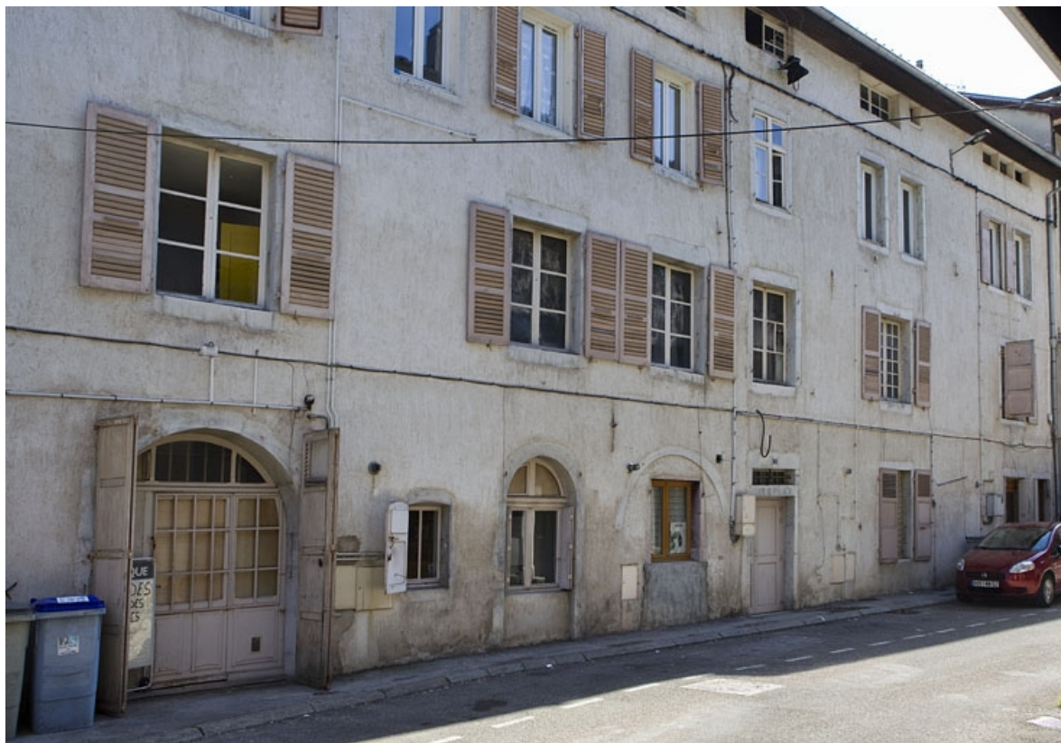
Elévation postérieure, rue des Promenades.