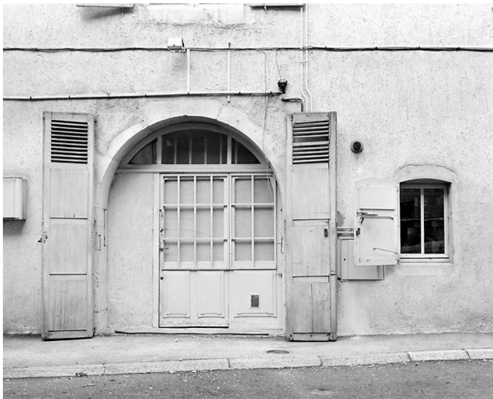
Baie en arc plein cintre.