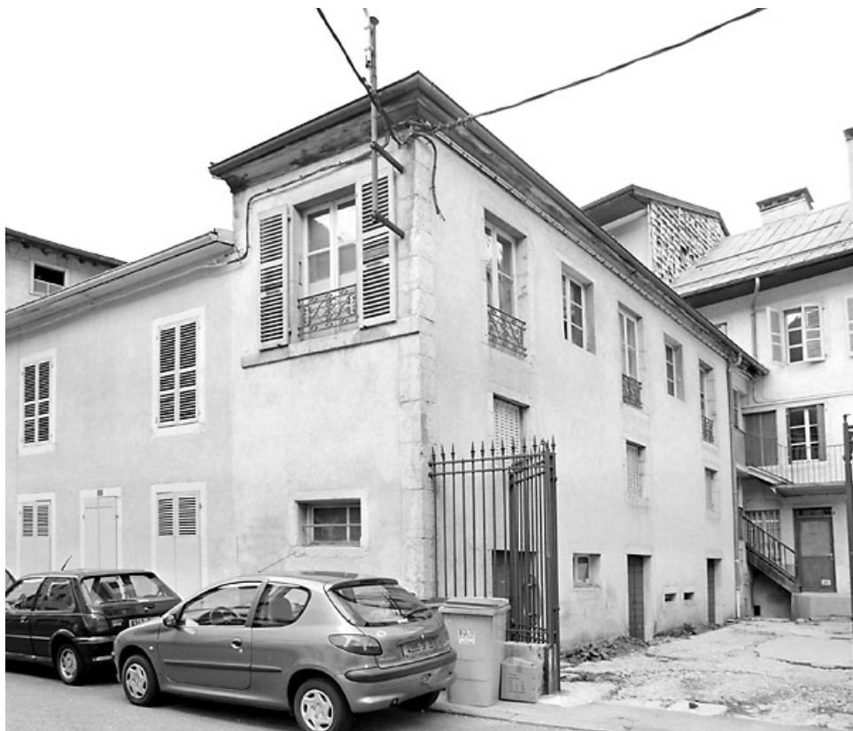
Aile nord, de trois quarts gauche. 39, Morez, 130 rue de la République