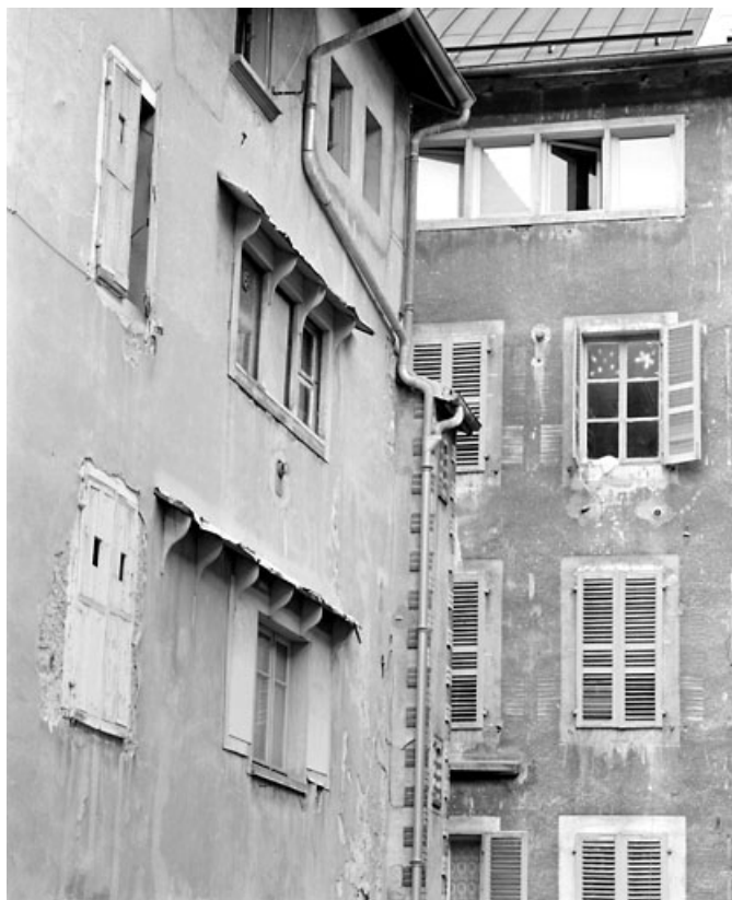
Aile nord (9 rue des Promenades) : fenêtres lunetières des ateliers.

39, Morez, 124, 126 rue de la République