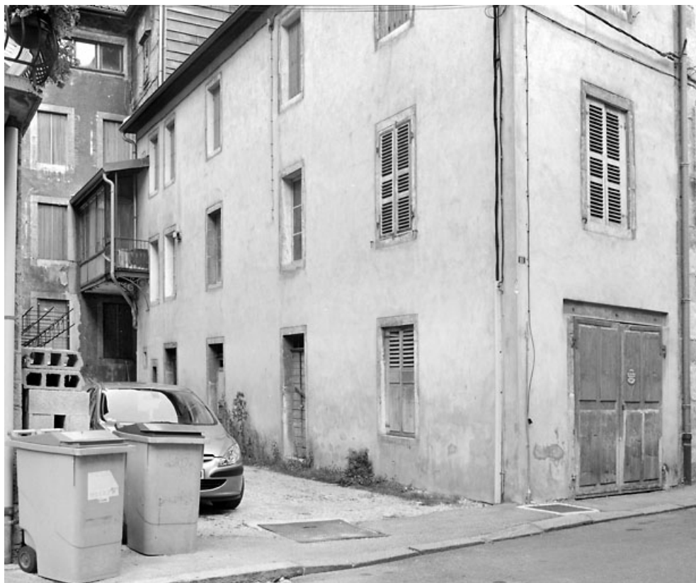
Aile sud (11 rue des Promenades), de trois quarts droite.

39, Morez, 124, 126 rue de la République