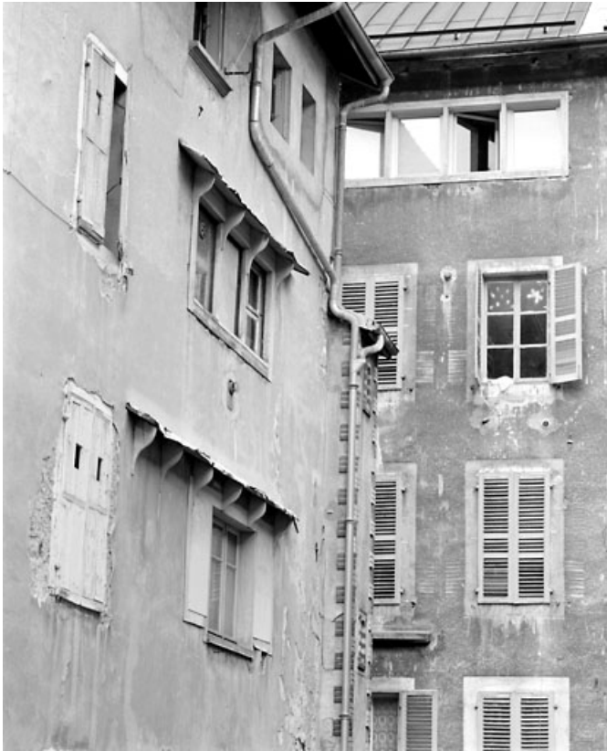
Aile nord (9 rue des Promenades) : fenêtres lunetières des ateliers.

39, Morez, 124, 126 rue de la République