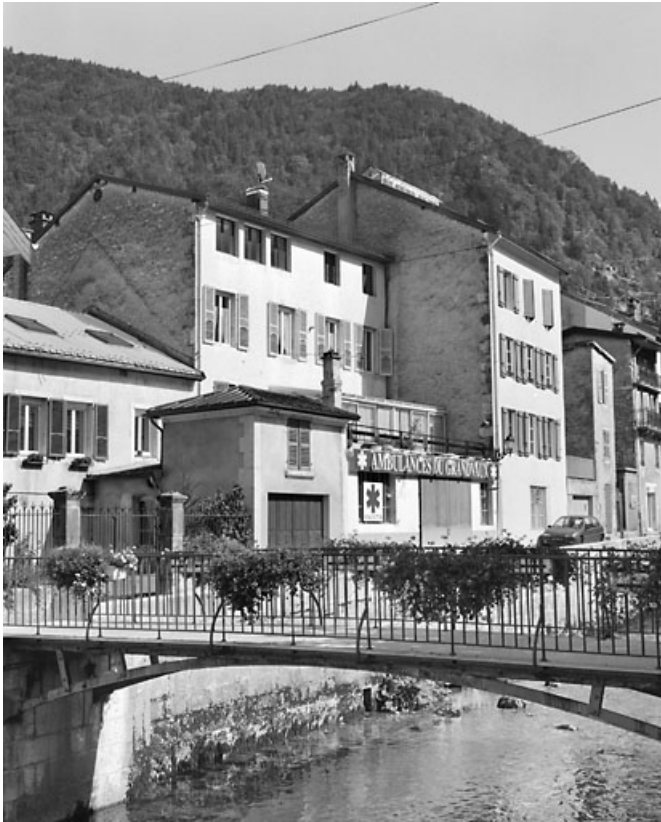
Vue d'ensemble de l'élévation postérieure et du Petit Quai, depuis l'ouest. 39, Morez, 12 rue des Promenades