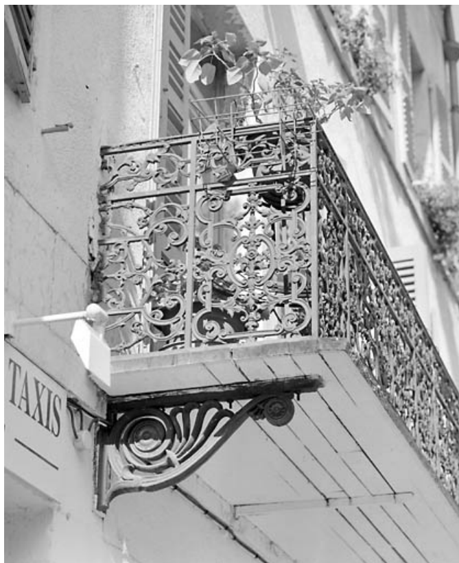
Élévation antérieure : face latérale du garde-corps du balcon.