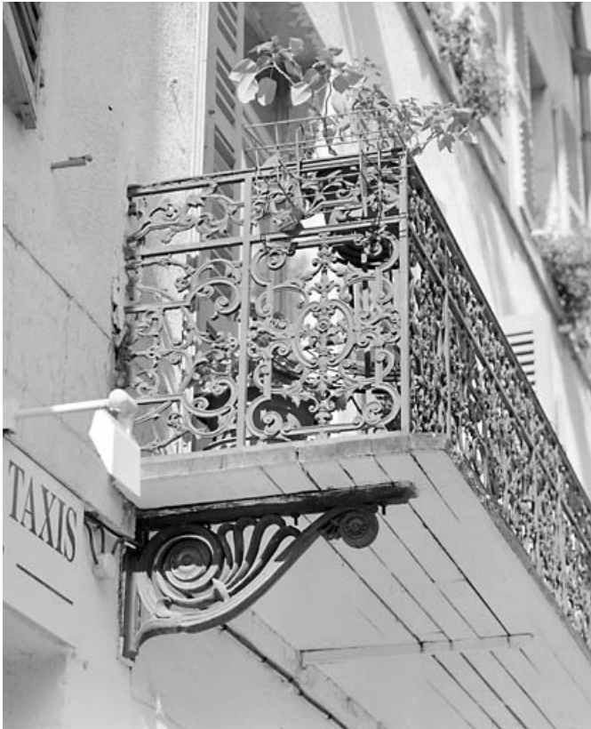
Elévation antérieure : face latérale du garde-corps du balcon. 39, Morez, 12 rue des Promenades