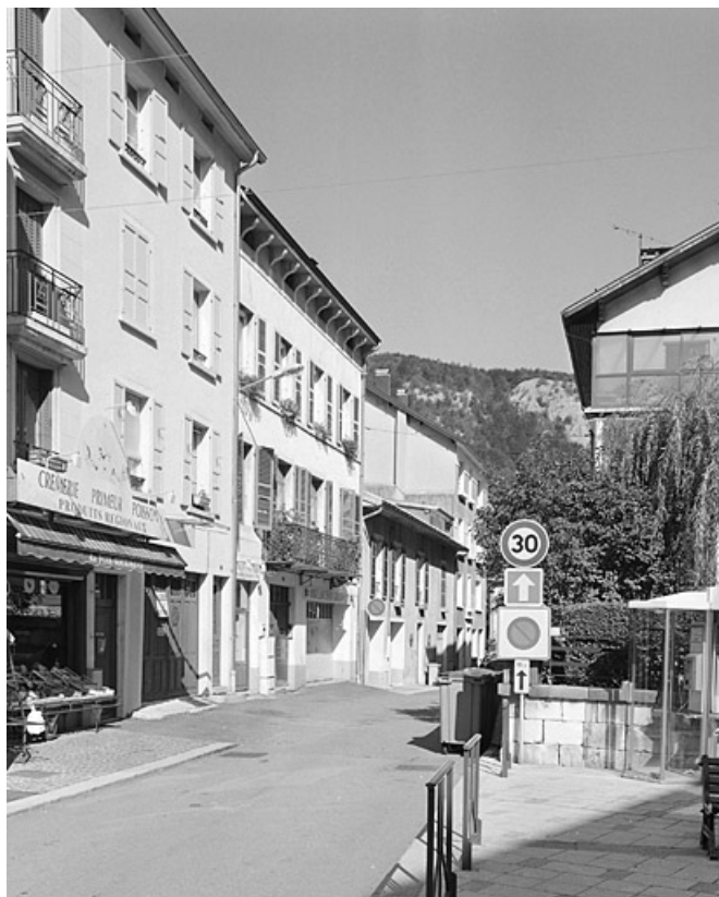
Vue d'ensemble de l'élévation antérieure et de la rue, depuis le sud-est. 39, Morez, 12 rue des Promenades