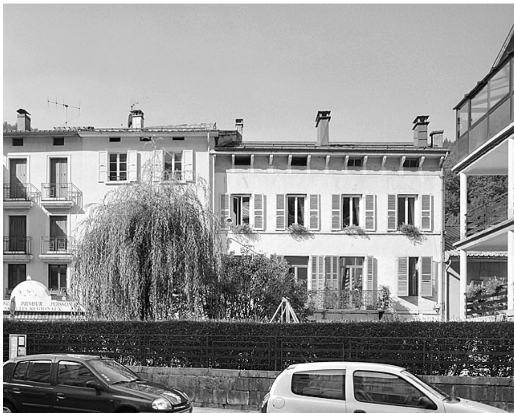
De droite à gauche, maison et immeubles aux n° 12, 14 et 16 de la rue des Promenades. 39, Morez, 12 rue des Promenades