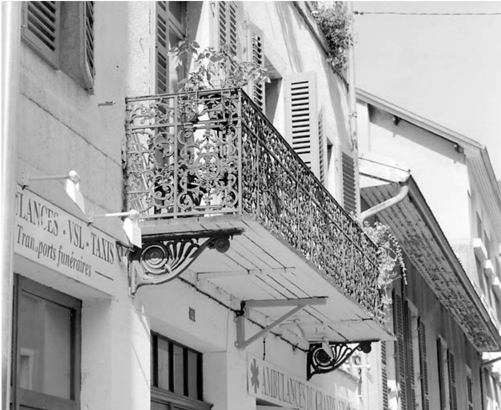
Elévation antérieure : balcon.