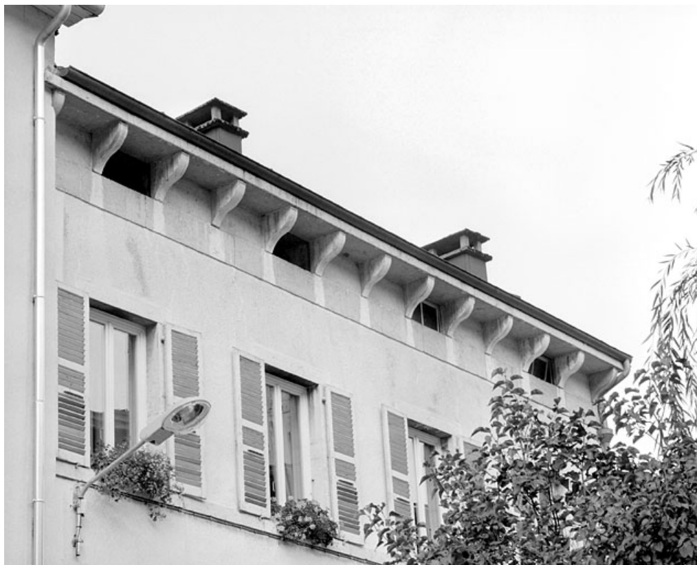
Elévation antérieure : baies du deuxième étage et du comble à surcroît, corniche et corbeaux. 39, Morez, 12 rue des Promenades