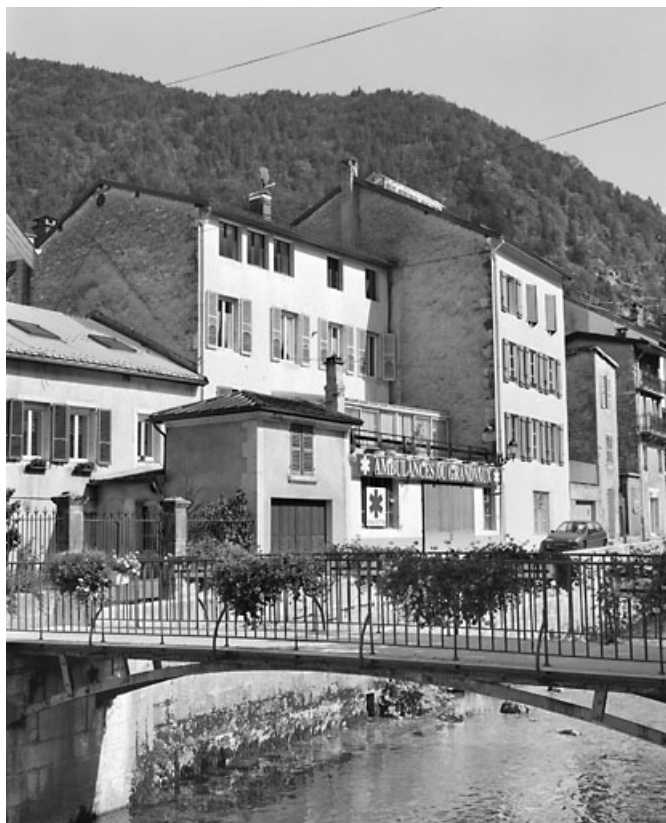
Vue d'ensemble de l'élévation postérieure et du Petit Quai, depuis l'ouest. 39, Morez, 12 rue des Promenades