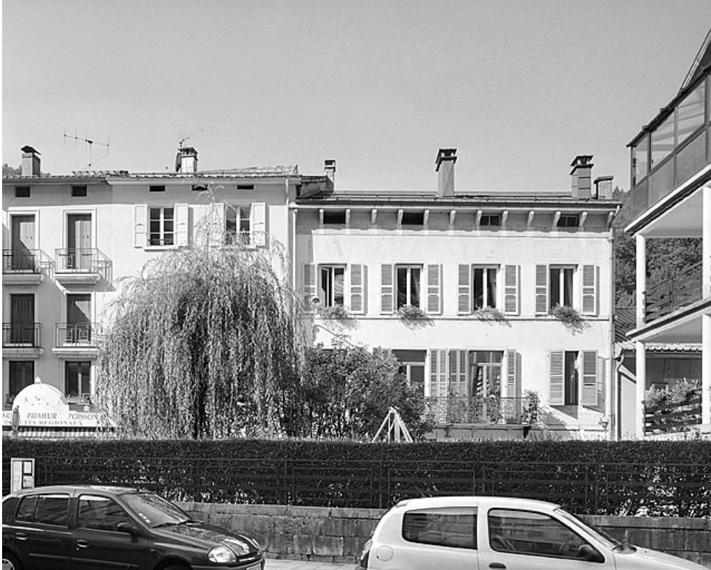
De droite à gauche, maison et immeubles aux n° 12, 14 et 16 de la rue des Promenades. 39, Morez, 12 rue des Promenades