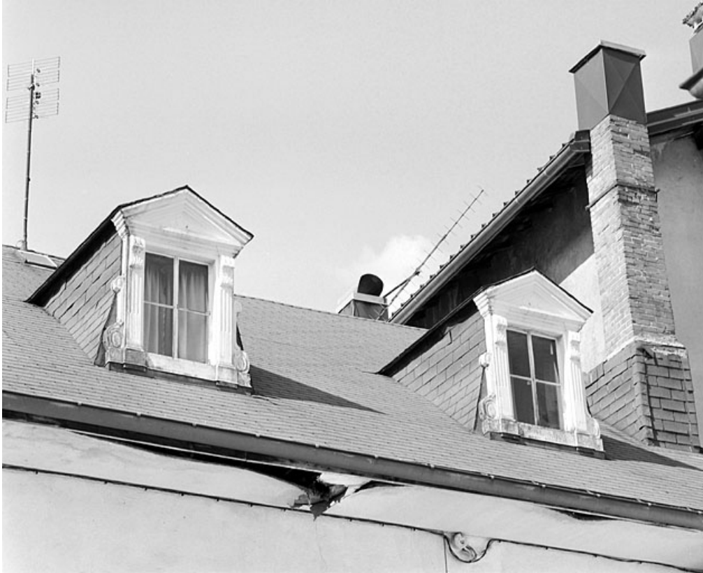
Lucarnes du versant sud.