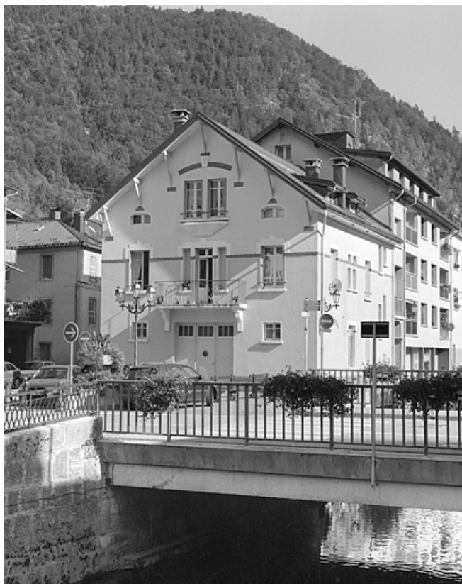
Vue d'ensemble, depuis l'ouest (cadrage vertical).