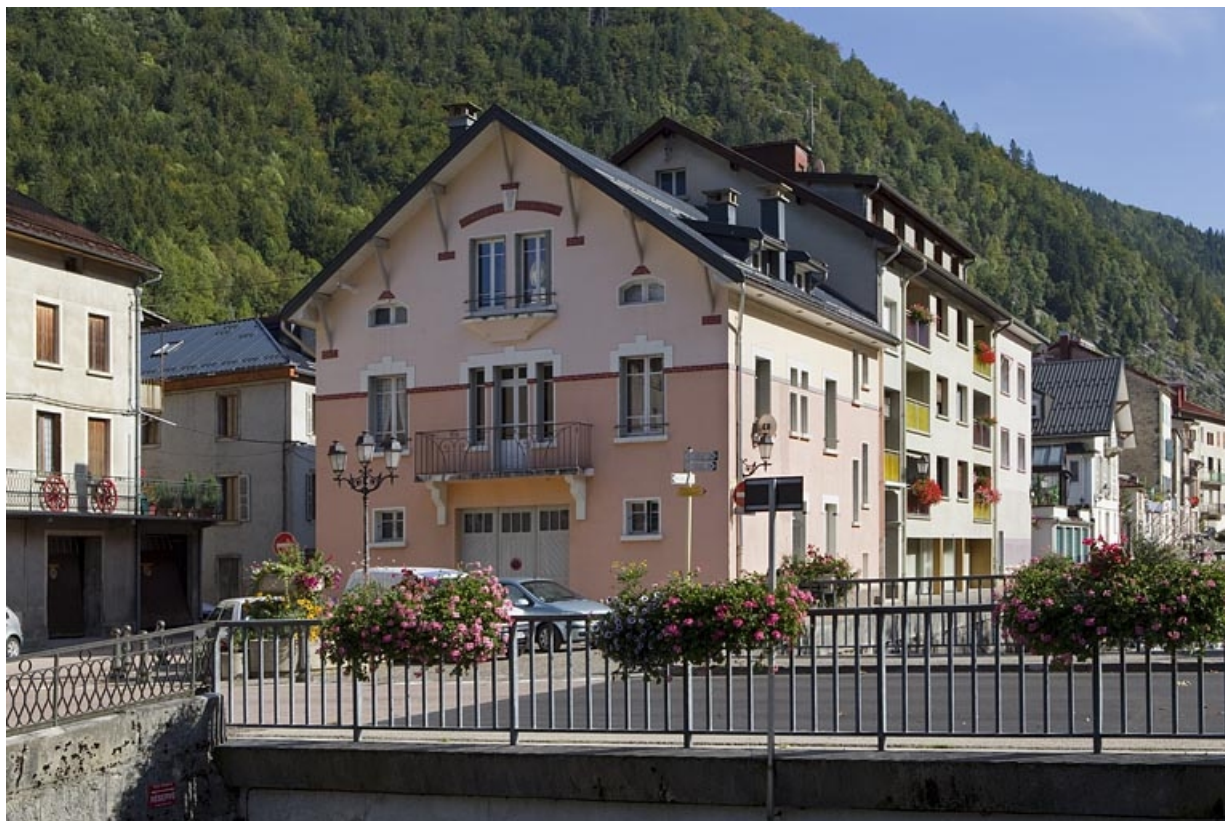
Vue d'ensemble, depuis l'ouest (cadrage horizontal).