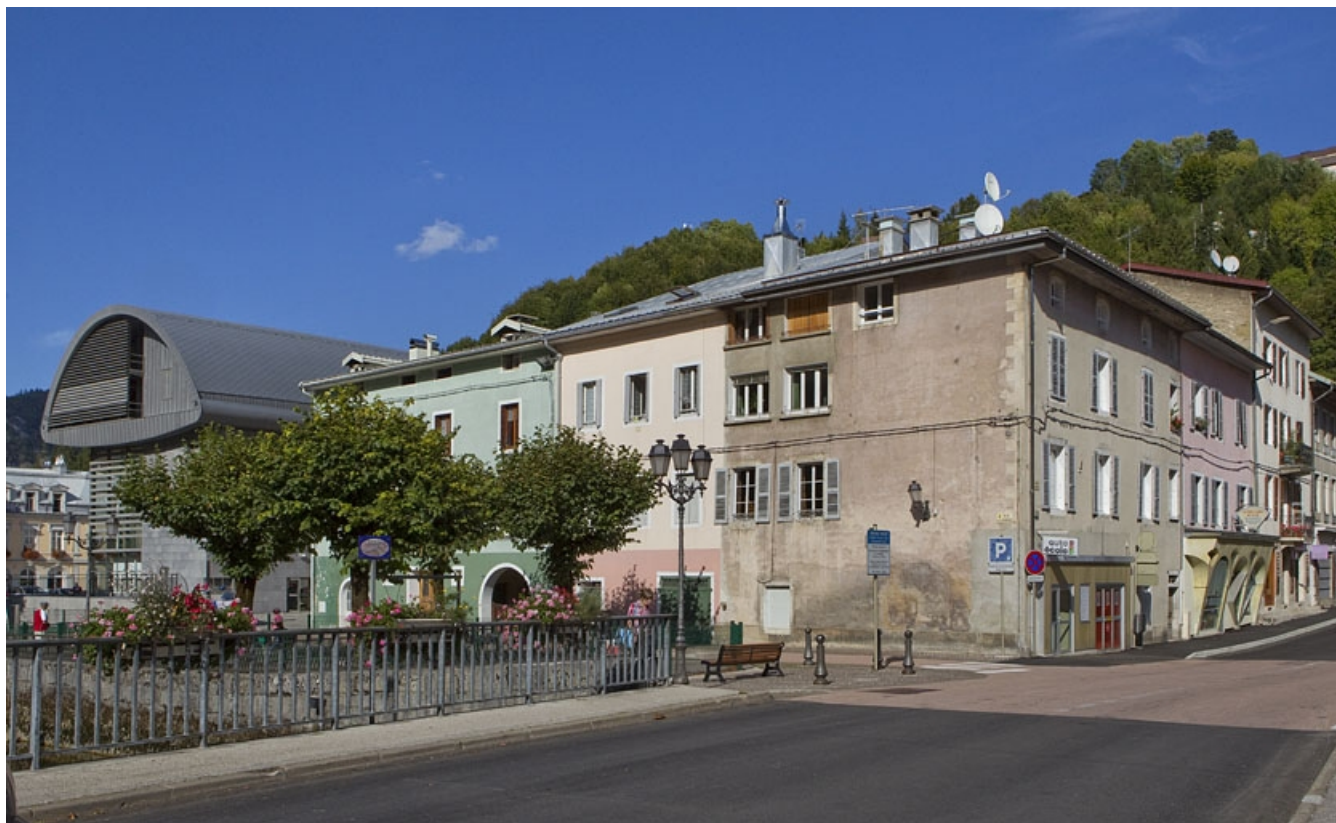
Vue d'ensemble, à l'angle de la rue Merlin et de celle des Promenades.