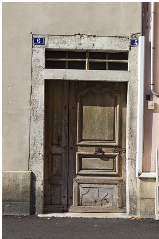
Porte principale sur la rue Merlin.