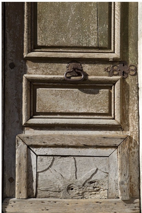
Porte principale sur la rue Merlin : détail du vantail.