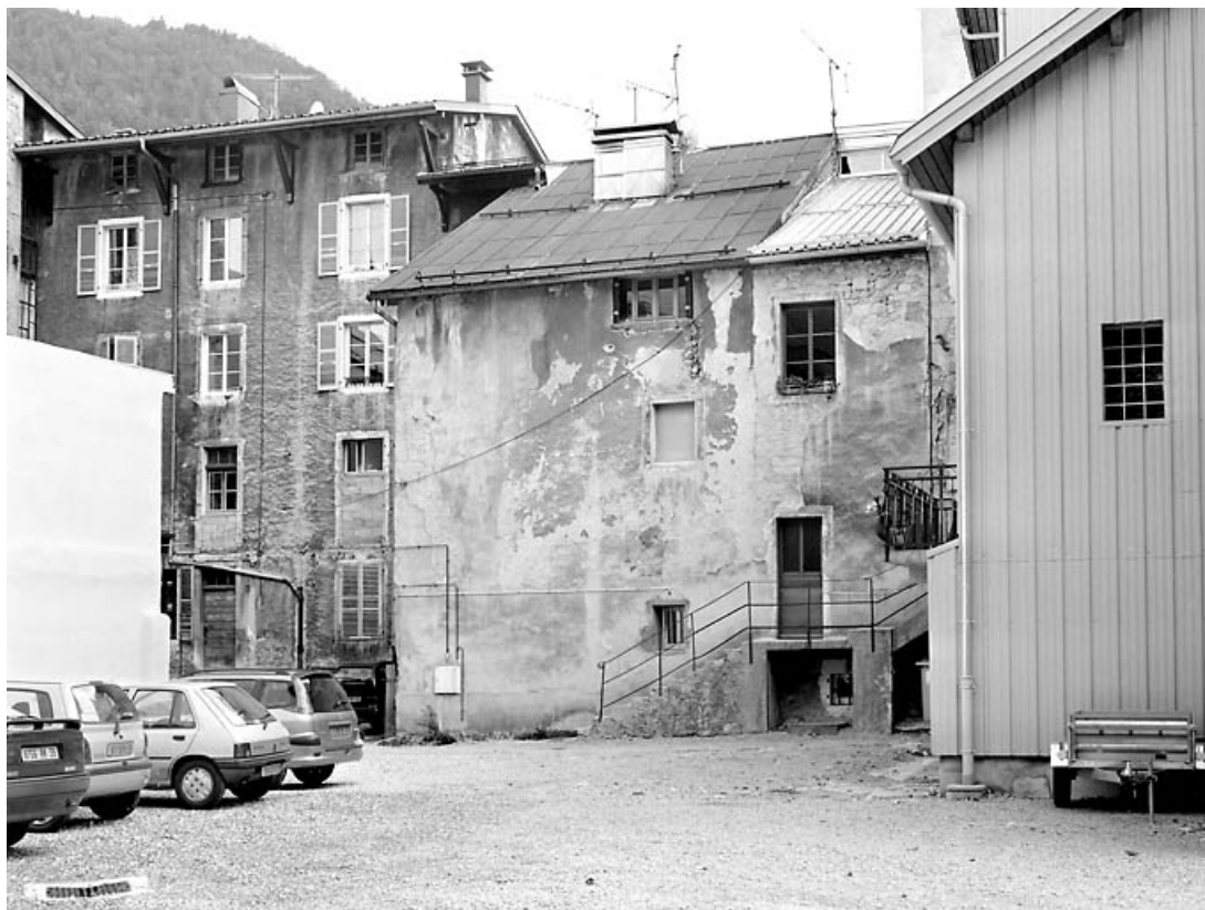
Façade postérieure du corps de bâtiment de la rue Merlin.