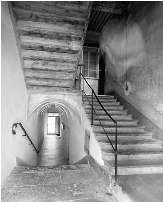
Couloir du rez-de-chaussée et escalier, depuis le premier repos. 39, Morez, 4, 6 rue Ernest Merlin