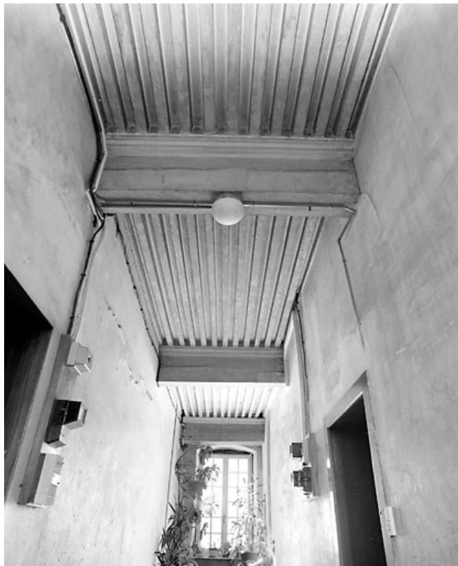
Plafond à la française dans le couloir du premier étage.