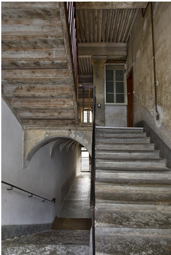
Escalier et couloir du premier étage, depuis le premier repos.