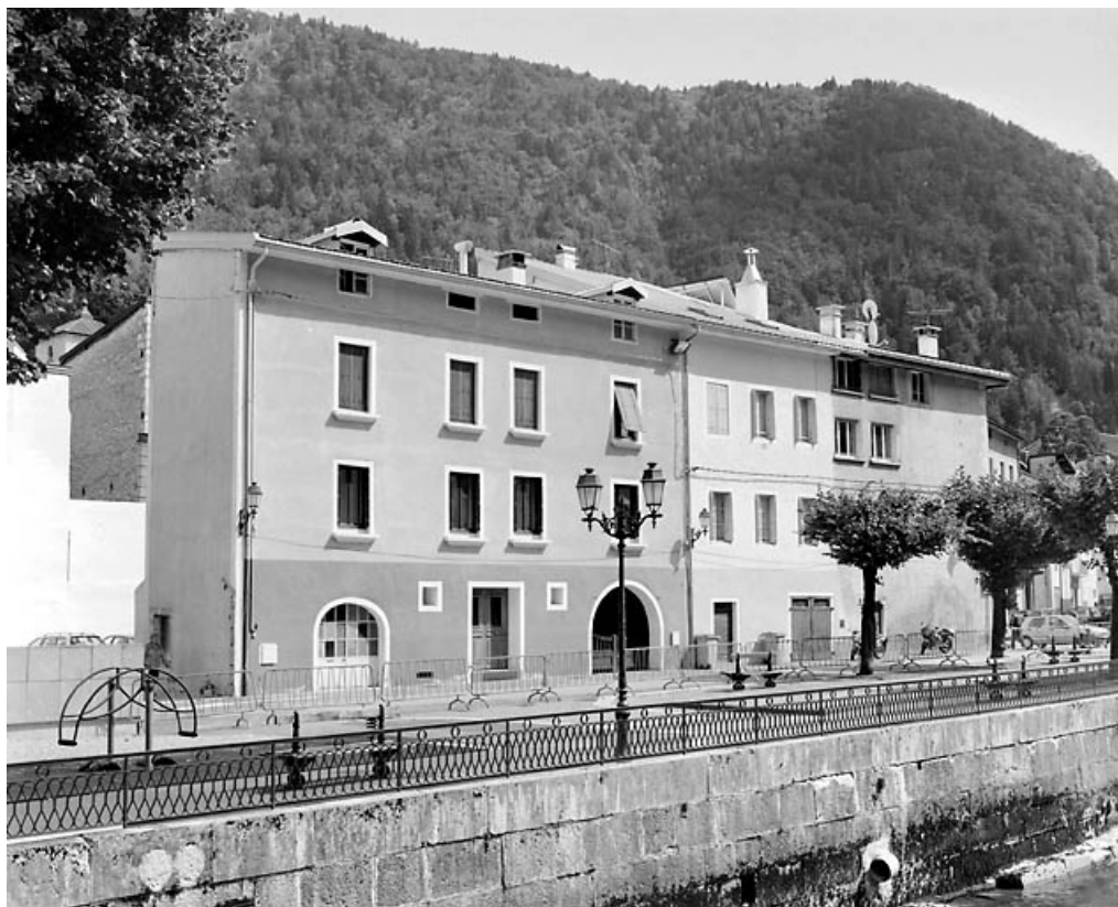
Vue d'ensemble sur la rue des Promenades.