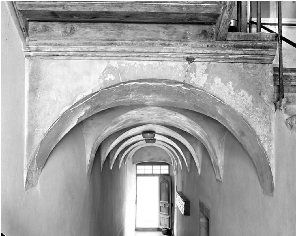
Voûte d'arêtes du couloir.