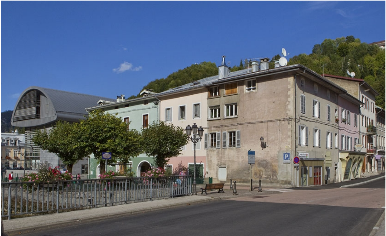
Vue d'ensemble, à l'angle de la rue Merlin et de celle des Promenades.