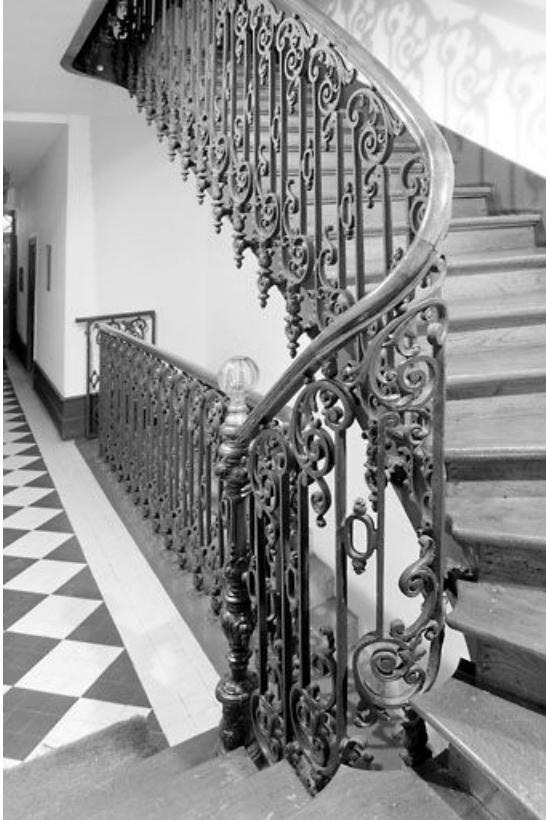
Escalier tournant, depuis l'extrémité du couloir.