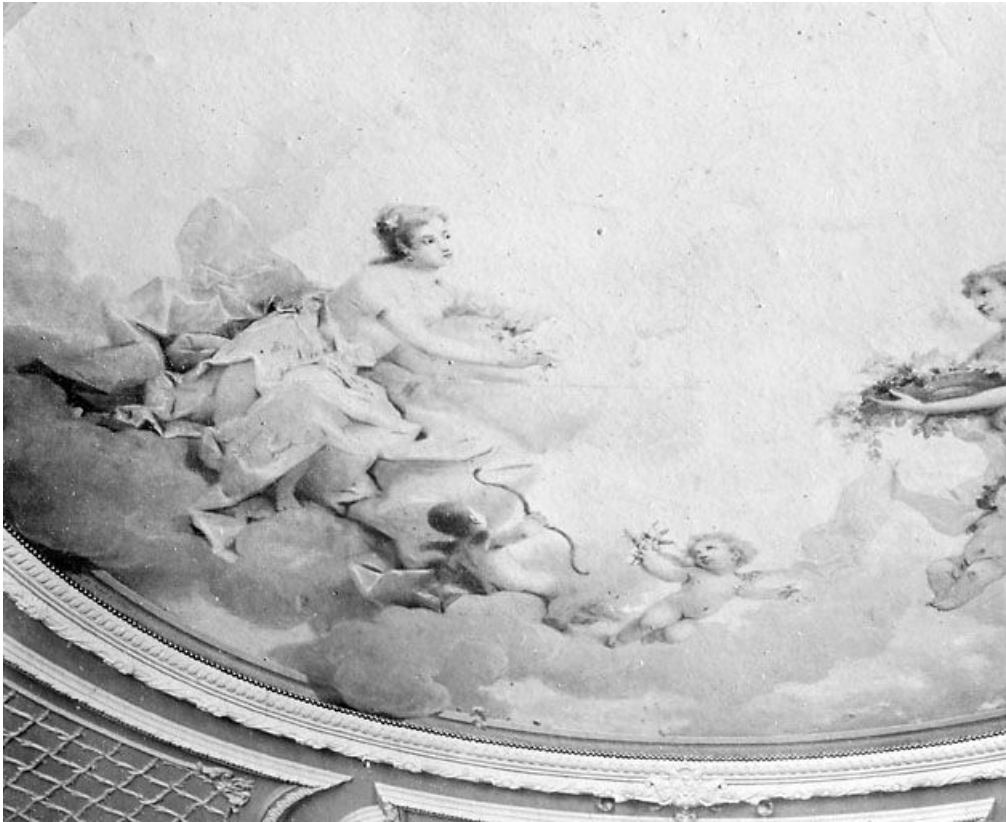
[Scène mythologique peinte au plafond du salon principal : détail de la partie gauche], [limite 19e siècle 20e siècle ?]. 39, Morez, 116 rue de la République