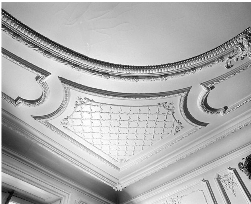
Grand salon : décor du plafond dans un angle.