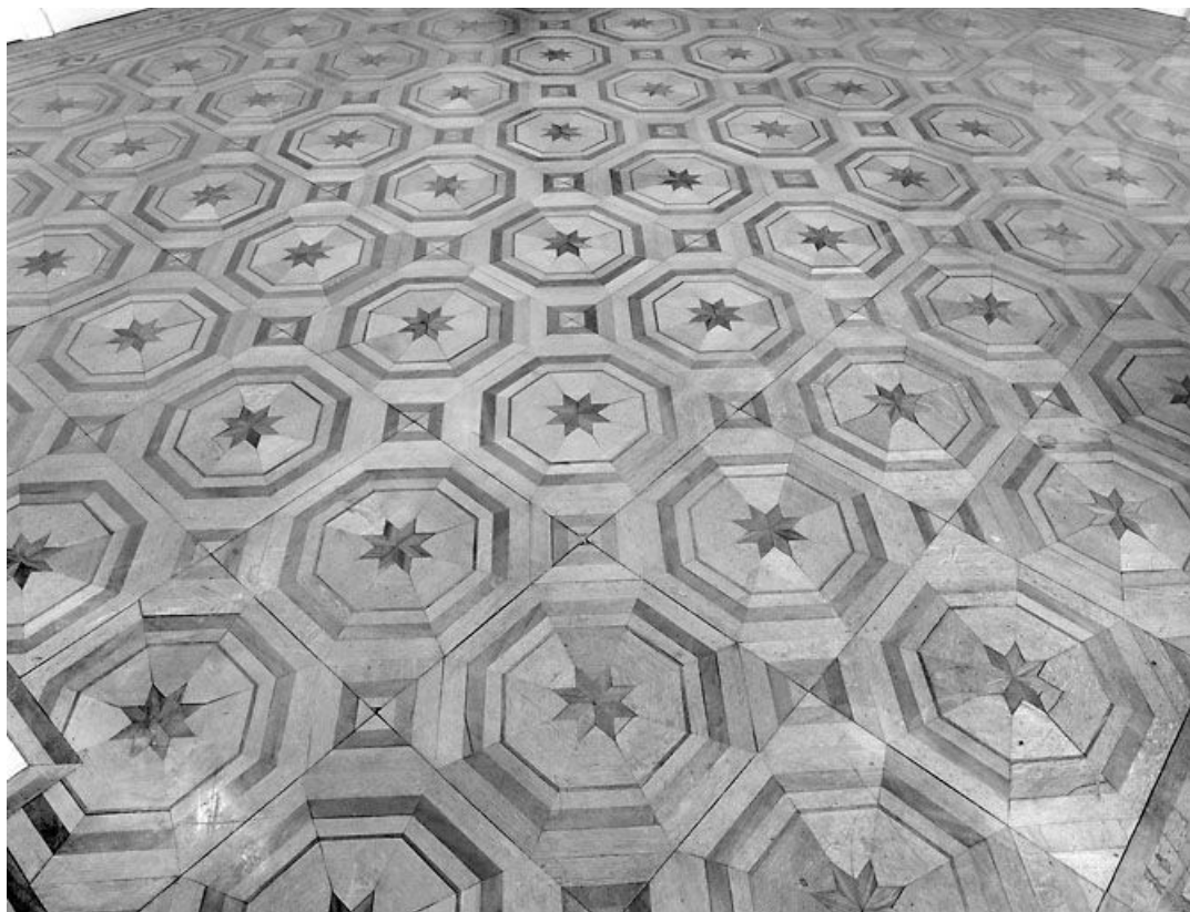
Grand salon : parquet en marqueterie.