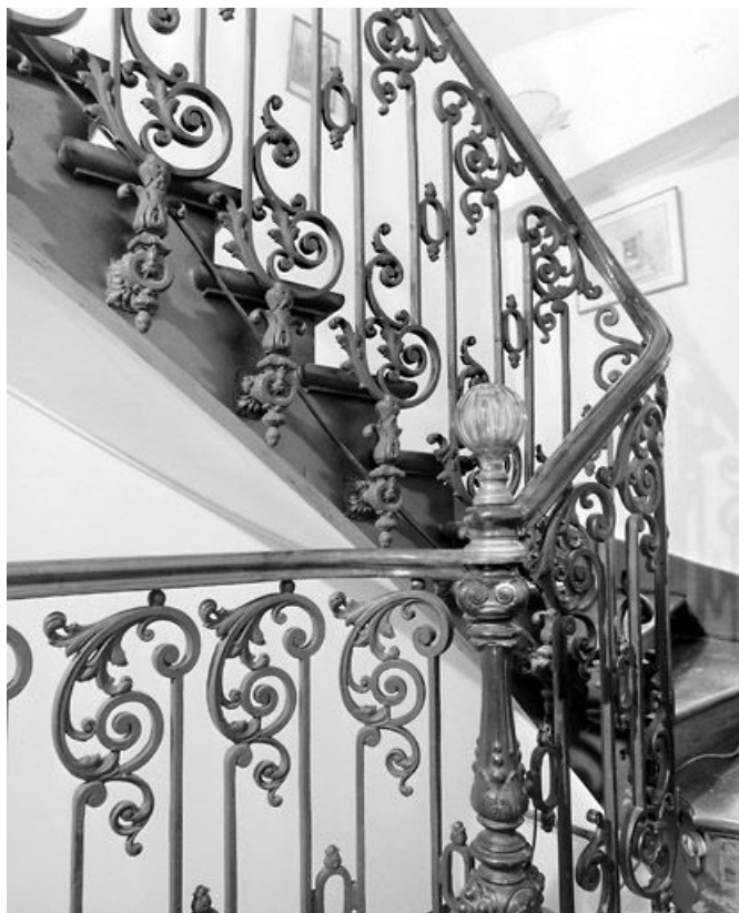
Escalier tournant : détail du garde-corps.