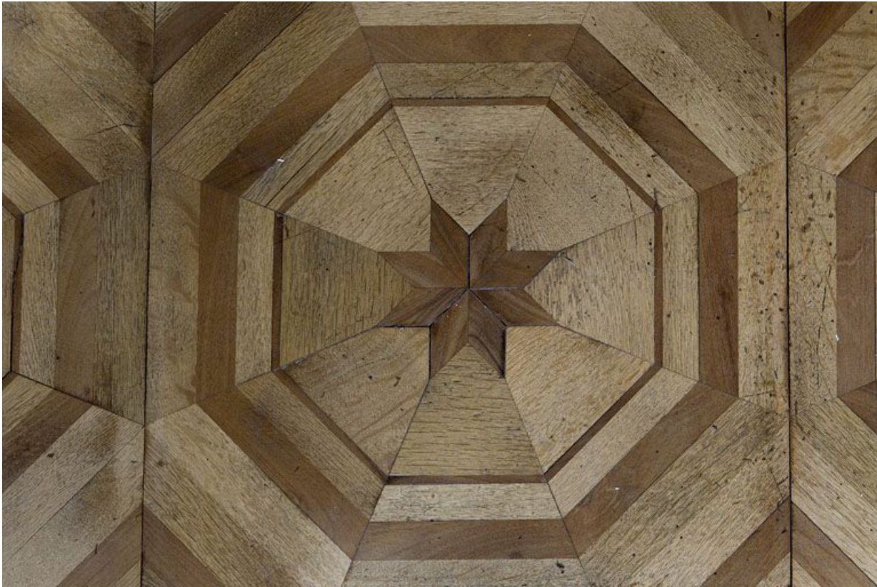
Grand salon : détail du parquet en marqueterie.