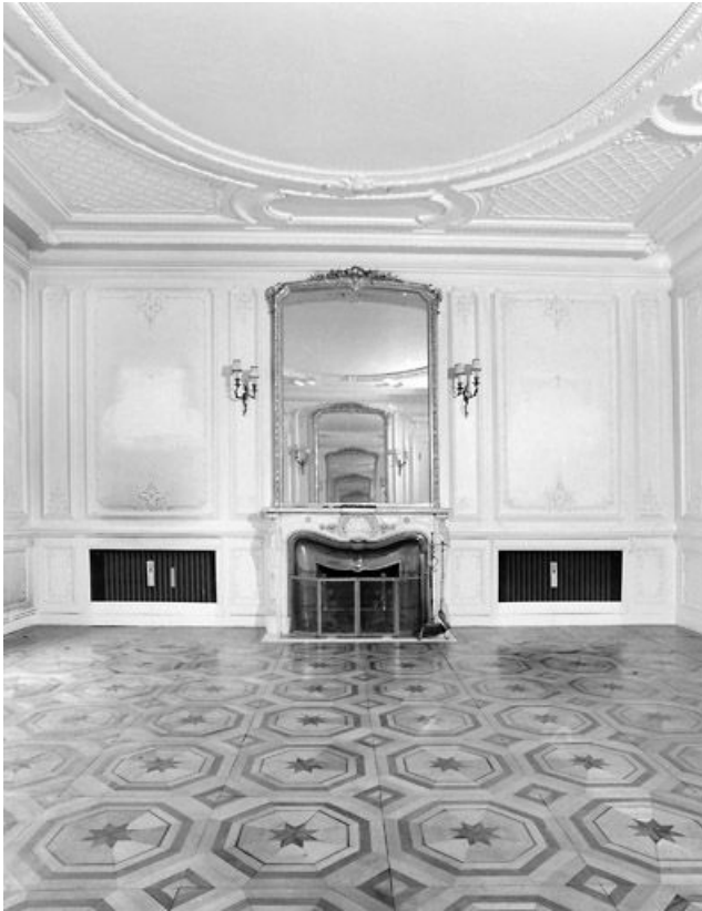
Grand salon : cheminée.