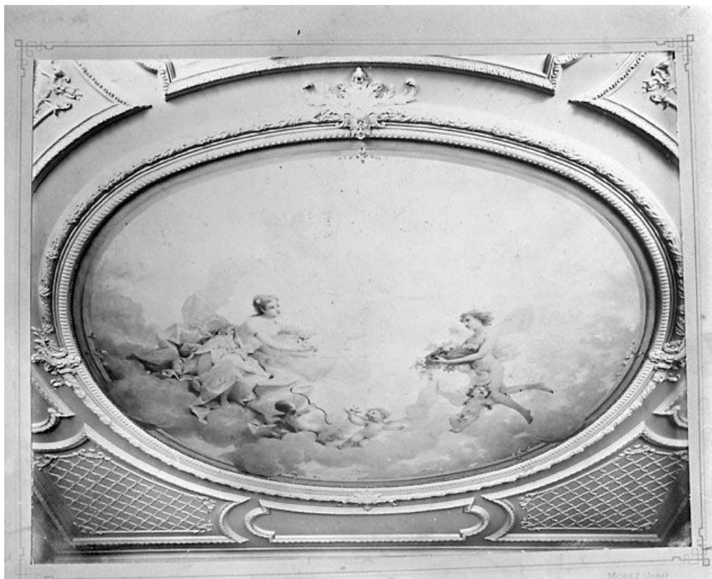
[Scène mythologique peinte au plafond du salon principal], [limite 19e siècle 20e siècle ?]. 39, Morez, 116 rue de la République