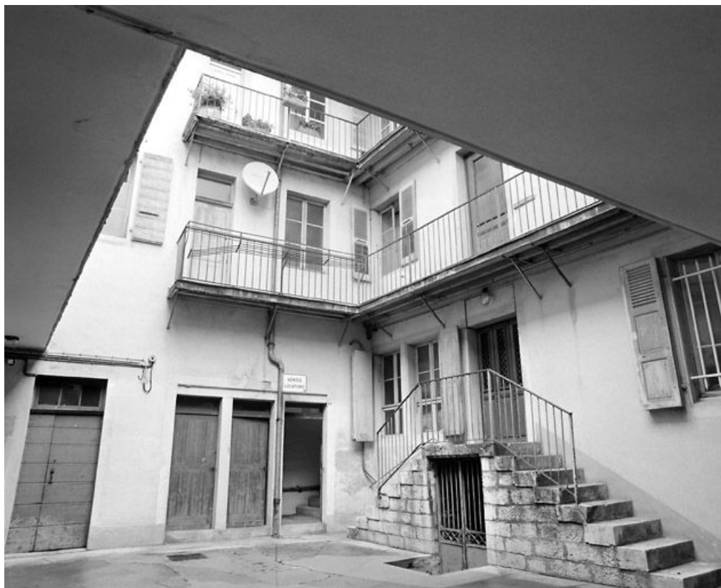
Façade postérieure, sur la cour, et corps de bâtiment nord.