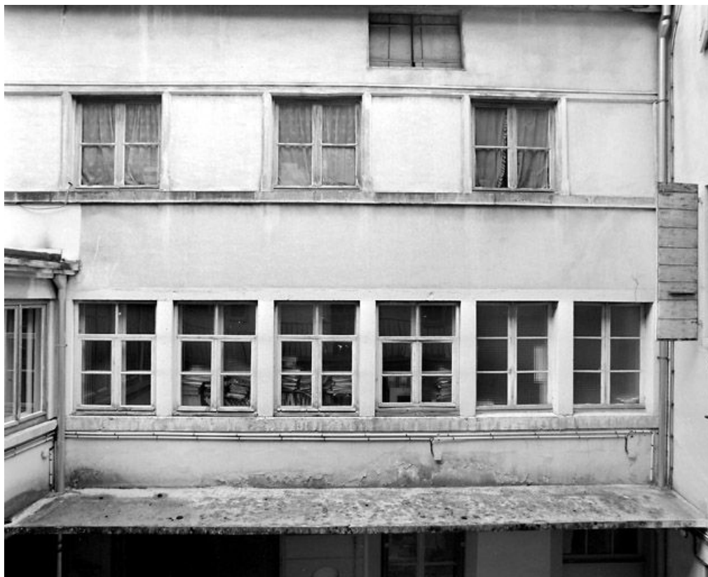
Façade antérieure de l'ancien atelier (ouest) : premier et deuxième étages.