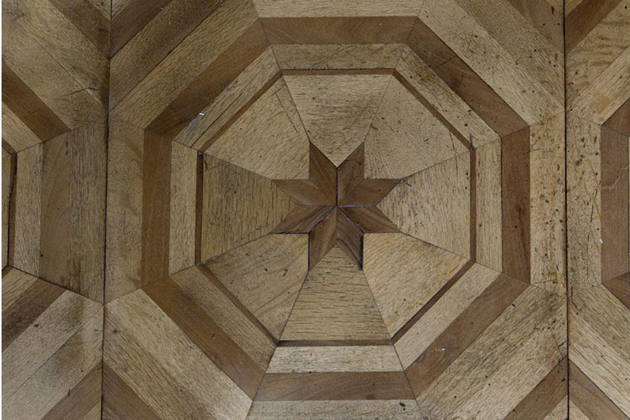
Grand salon : détail du parquet en marqueterie.