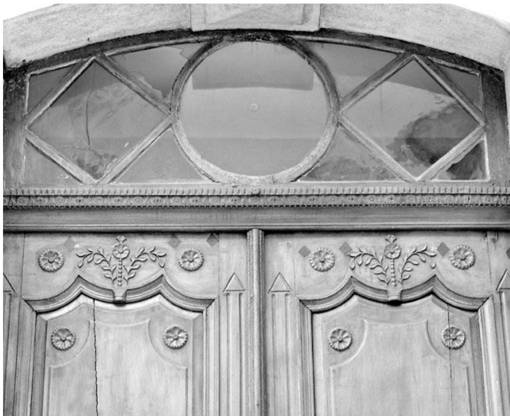
Façade antérieure : partie supérieure de la porte principale et imposte.