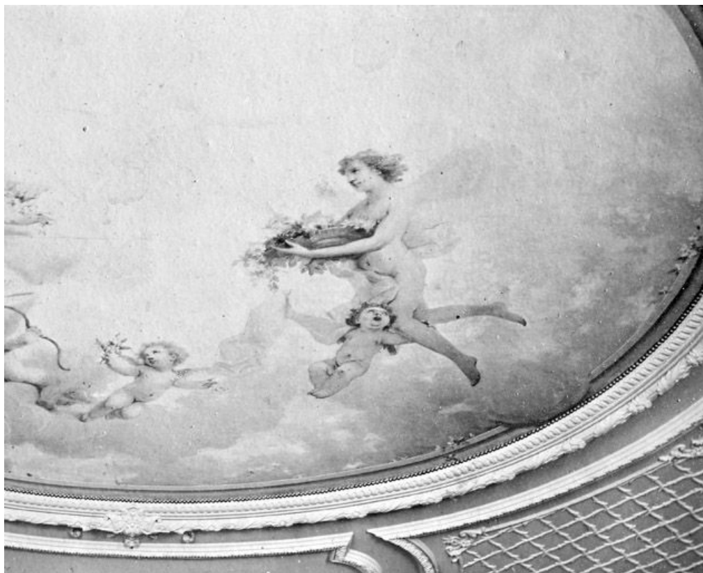
[Scène mythologique peinte au plafond du salon principal : détail de la partie droite], [limite 19e siècle 20e siècle ?]. 39, Morez, 116 rue de la République