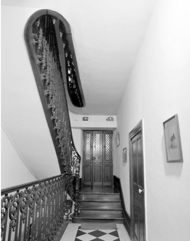
Escalier tournant, depuis la porte principale.