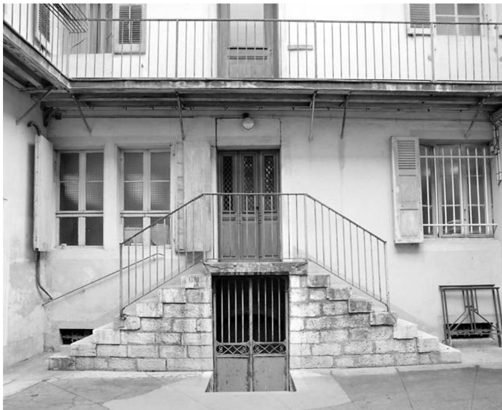
Façade postérieure : rez-de-chaussée surélevé et escalier extérieur.