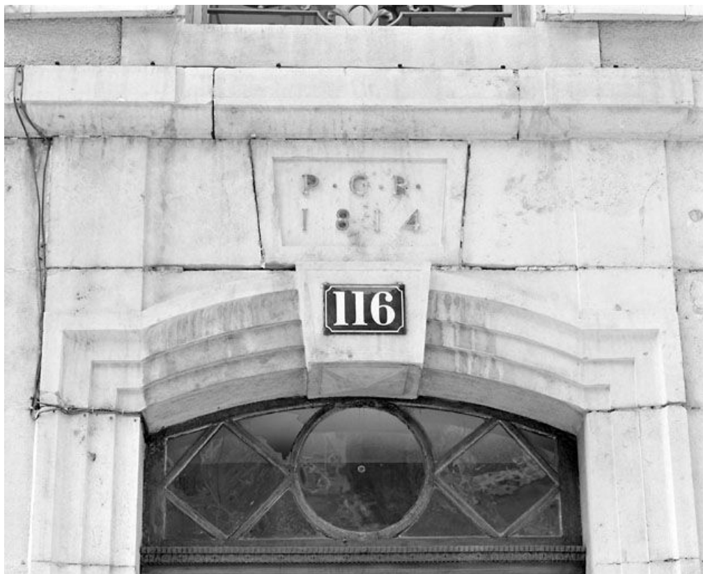
Façade antérieure : linteau de la porte principale et chronogramme.