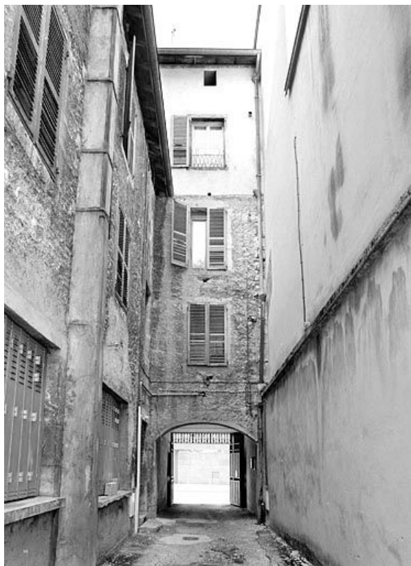
Façade postérieure du n° 141 et passage.