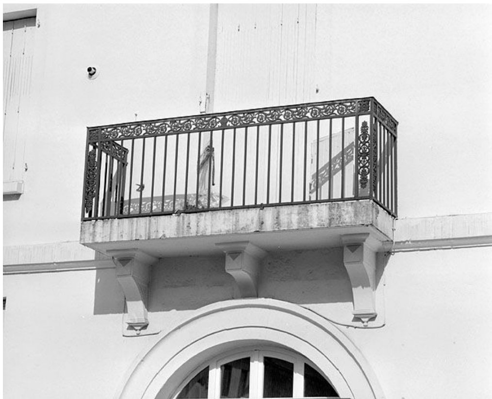
Façade latérale droite : balcon du premier étage.