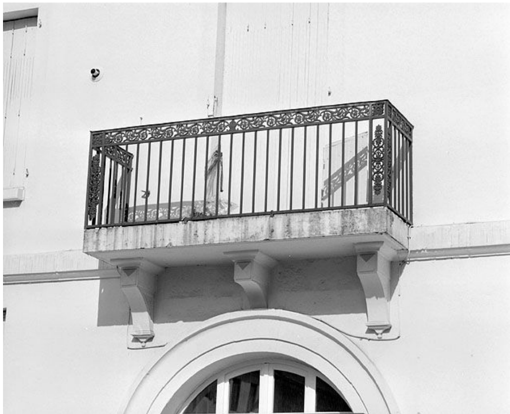
Façade latérale droite : balcon du premier étage.