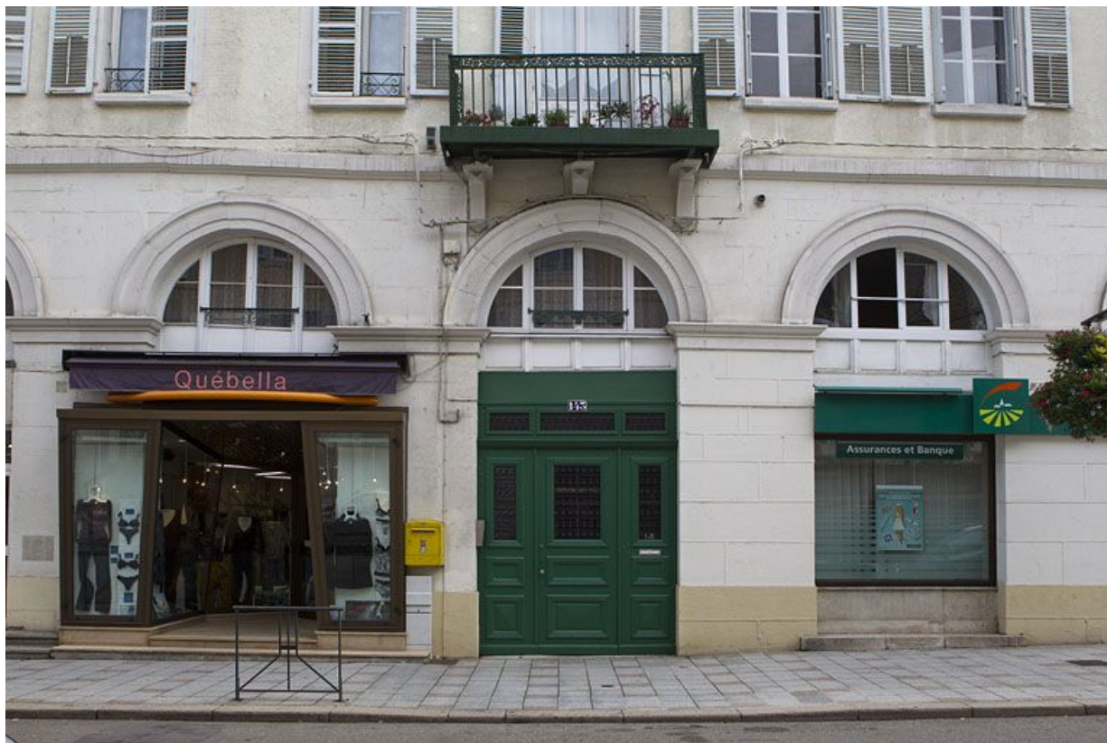
Façade antérieure : baies du rez-de-chaussée et de l'entresol, de face.