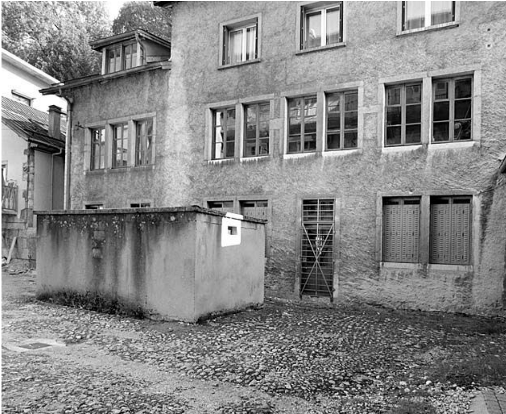
Bâtiment est : façade antérieure.