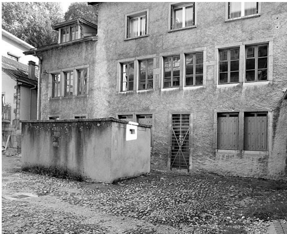
Bâtiment est : façade antérieure.