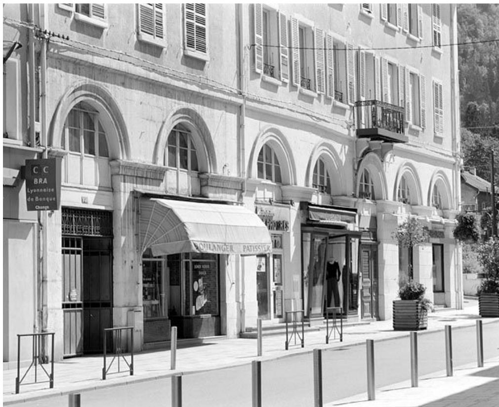
Façade antérieure : baies du rez-de-chaussée et de l'entresol, en enfilade.