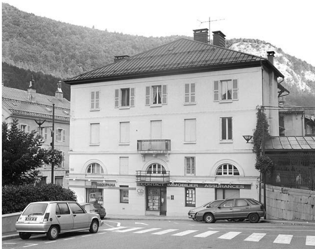
Façade latérale droite (place Notre-Dame).