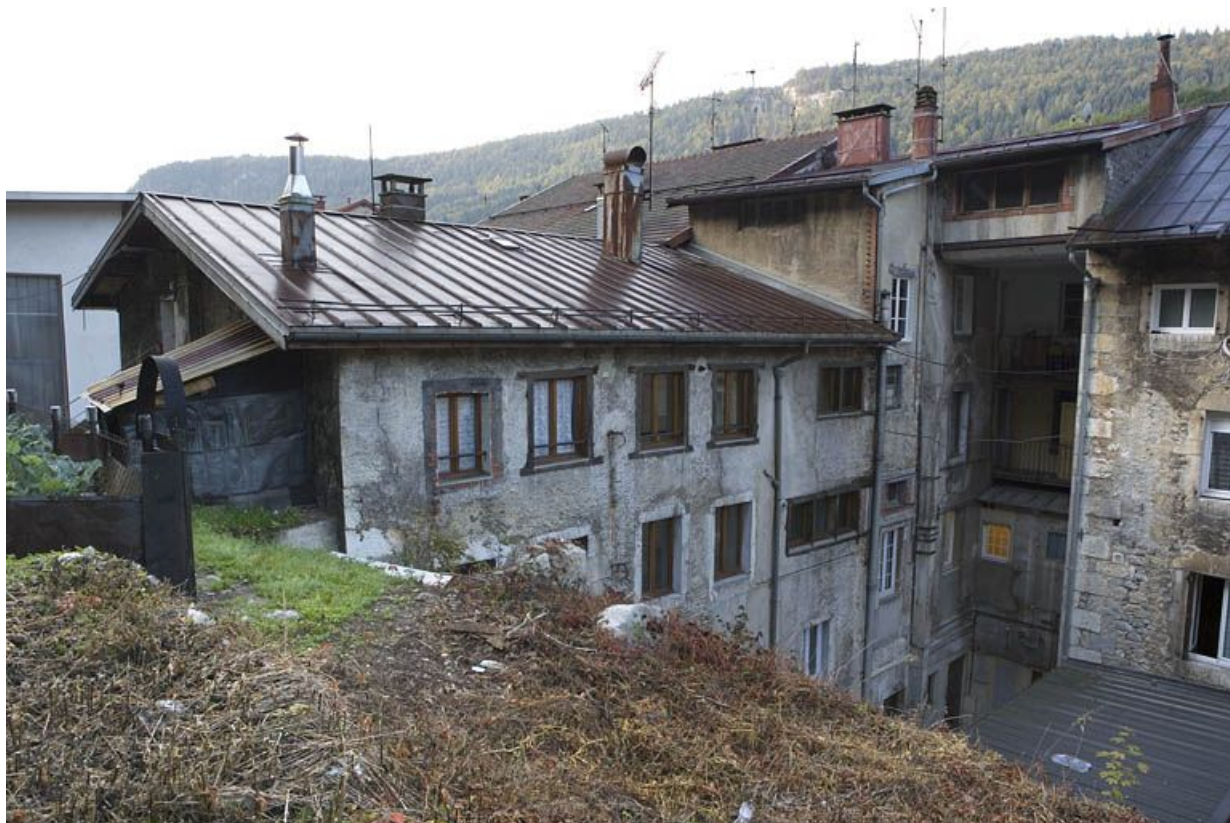
Façade postérieure et ancien atelier, depuis le nord-est.