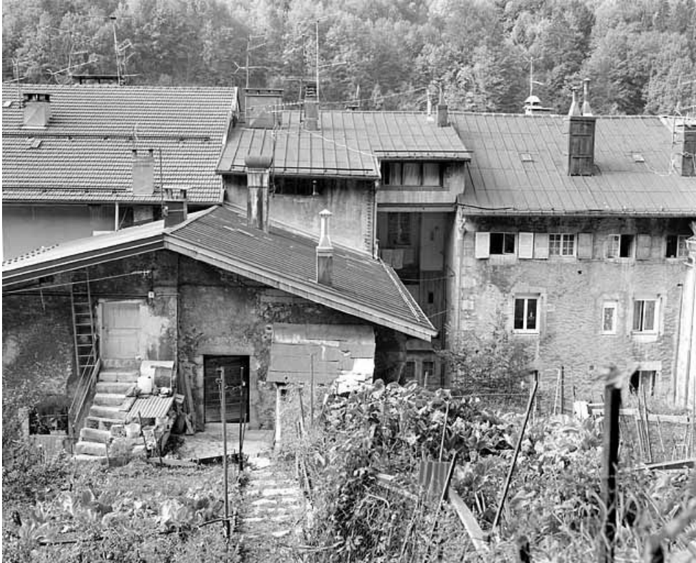
Ancien atelier : mur pignon oriental.