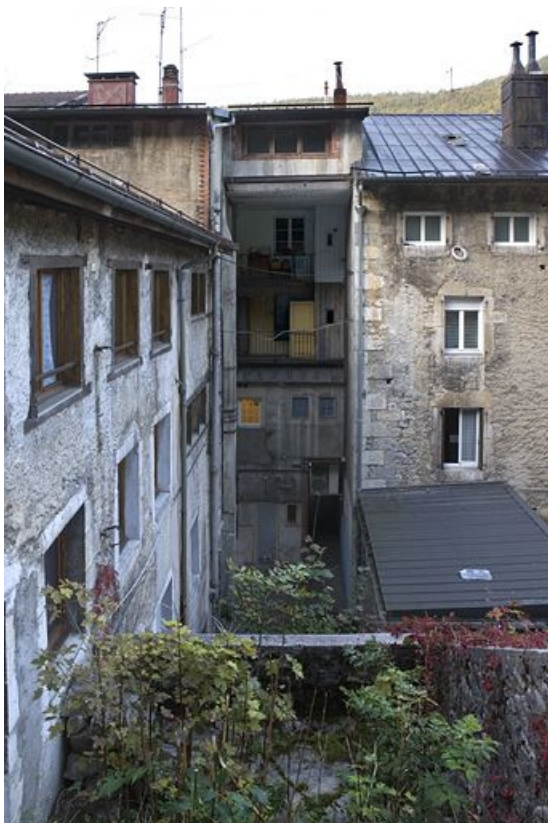
Façade postérieure, depuis le nord-est.