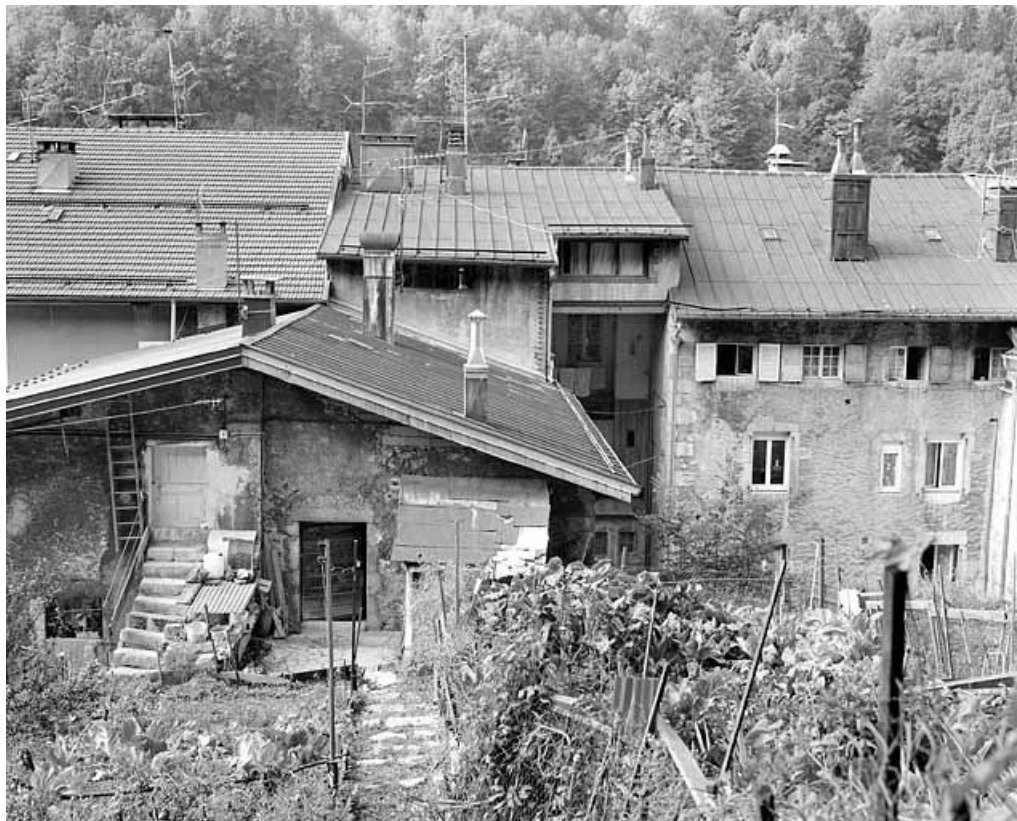
Ancien atelier : mur pignon oriental.