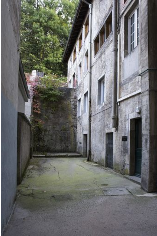
Cour, ancien atelier et mur de soutènement.