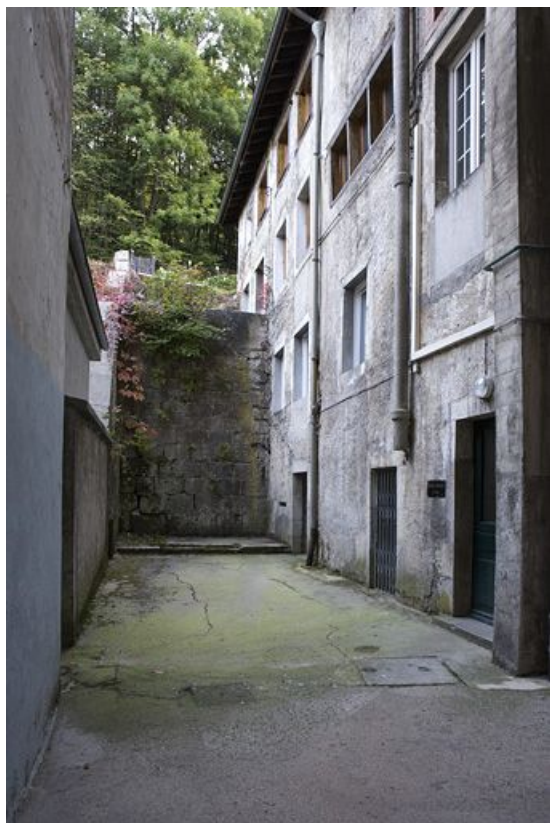
Cour, ancien atelier et mur de soutènement.