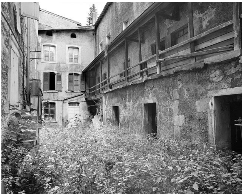
Cour à l'arrière des n° 129 et 131 : atelier à droite, logements au fond.