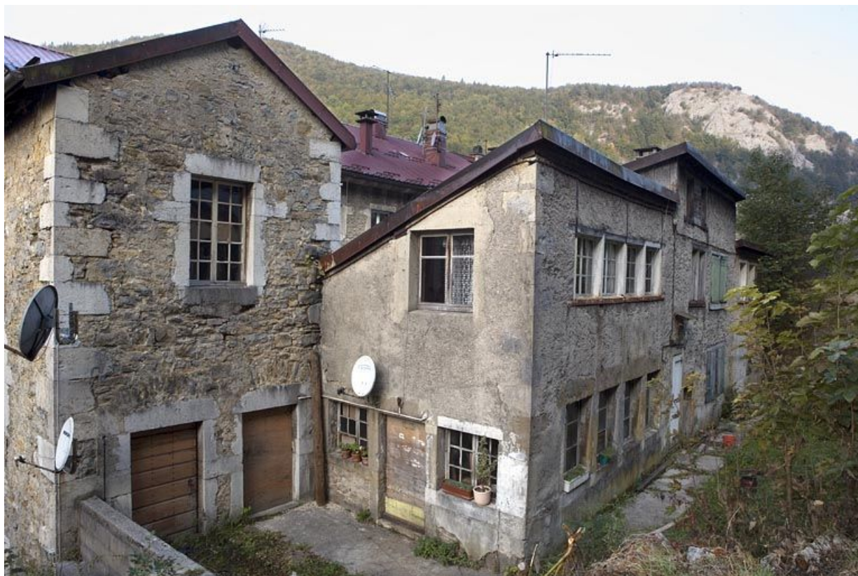
Façade postérieure de l'atelier à l'arrière des n° 129 et 131.