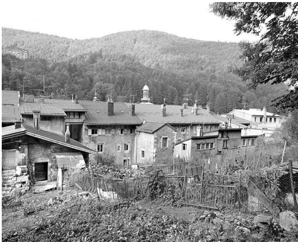
Vue d'ensemble des façades postérieures, de trois quarts gauche.