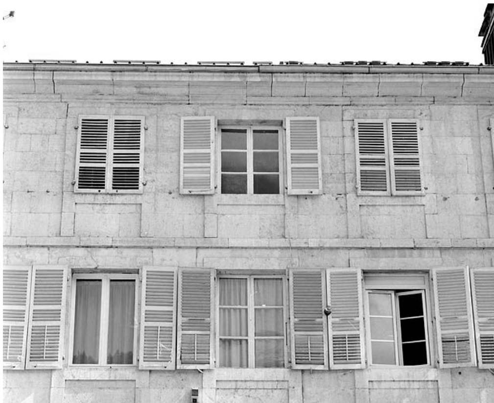
Façade antérieure des n° 131 et 133 : fenêtres aux 2e et 3e étages.