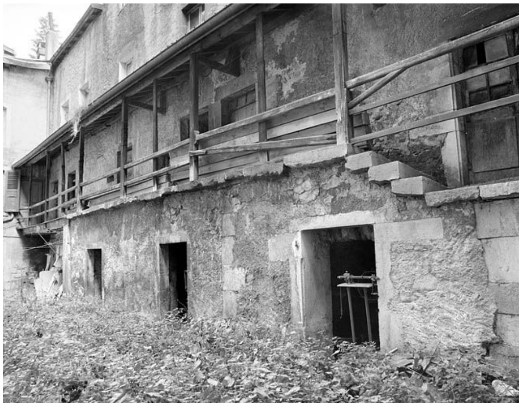
Cour à l'arrière des n° 129 et 131 : atelier. 39, Morez, 129-133 rue de la République