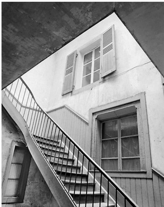
Fenêtres du corps occidental donnant sur la cage d'escalier, au premier étage. 39, Morez place Jean Jaurès