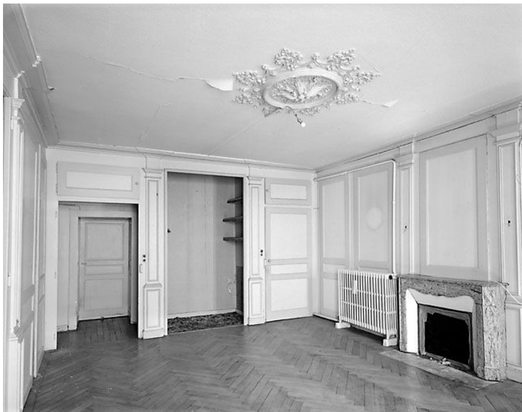
Salon côté rue au premier étage.