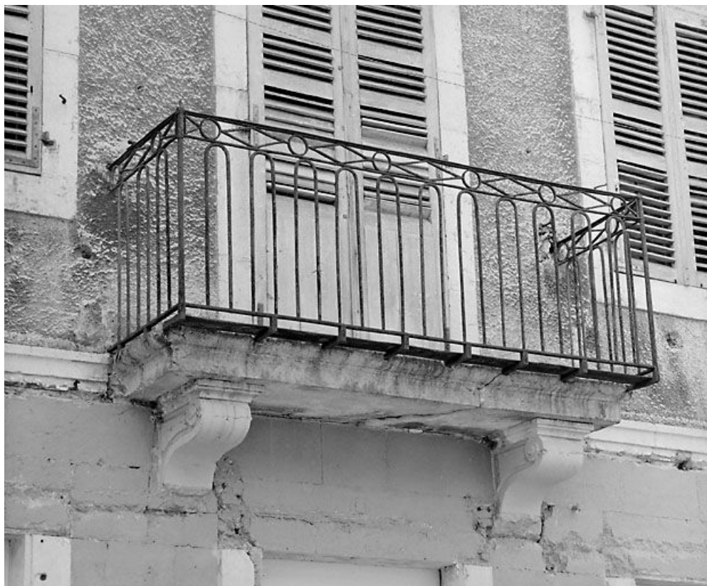
Balcon du corps de bâtiment oriental.