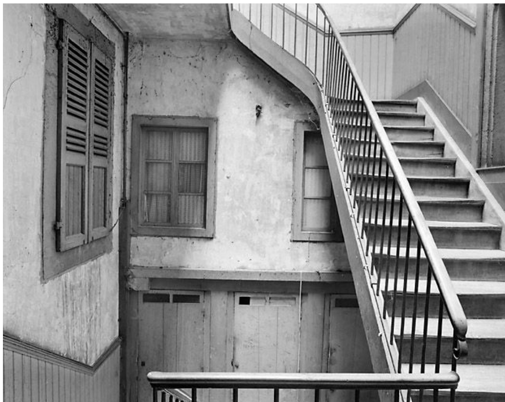
Cage d'escalier, au premier étage.