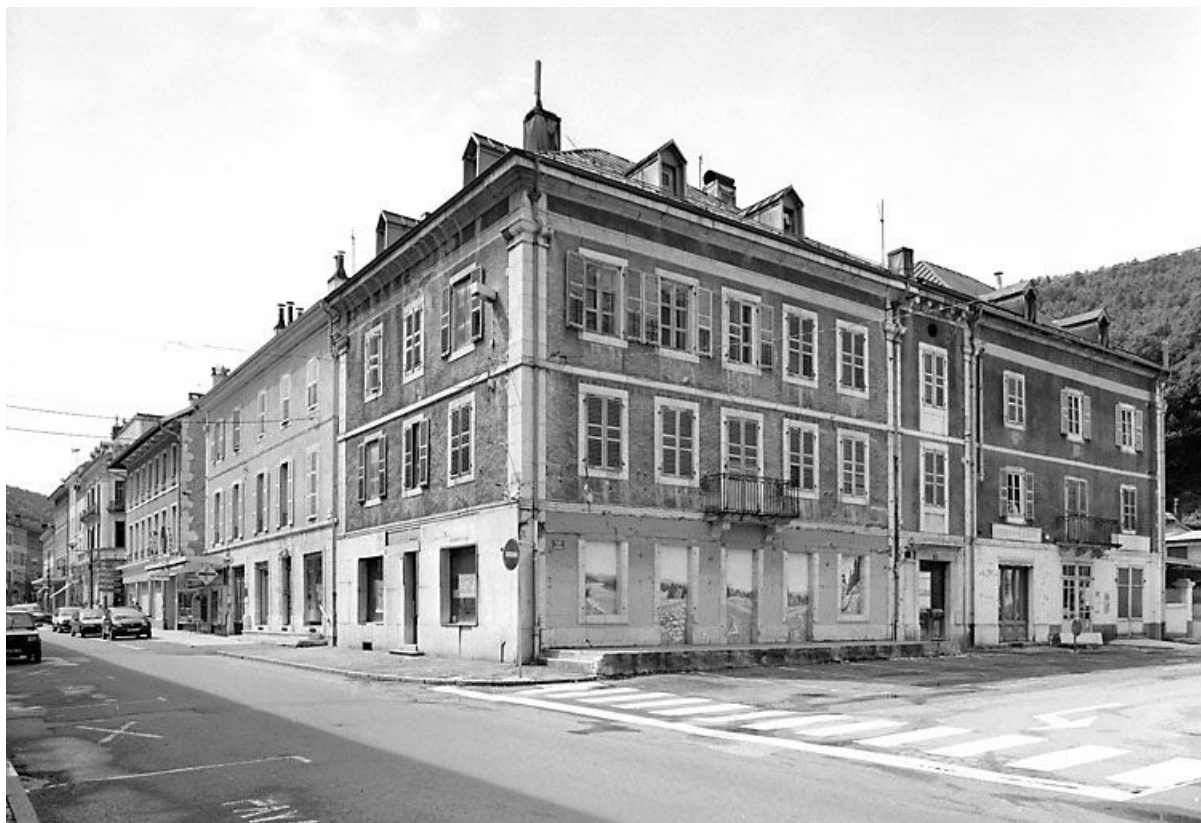
Vue d'ensemble, de trois quarts gauche.