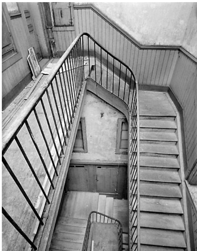
Vue plongeante sur la cage d'escalier.