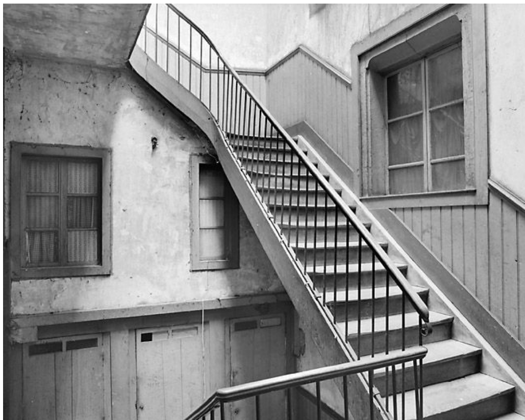
Escalier depuis le palier du premier étage.