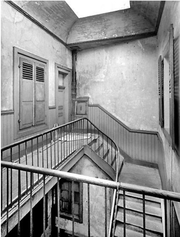
Palier du deuxième étage.