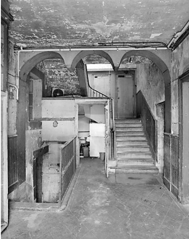
Entrée de la cage d'escalier dans la travée centrale.