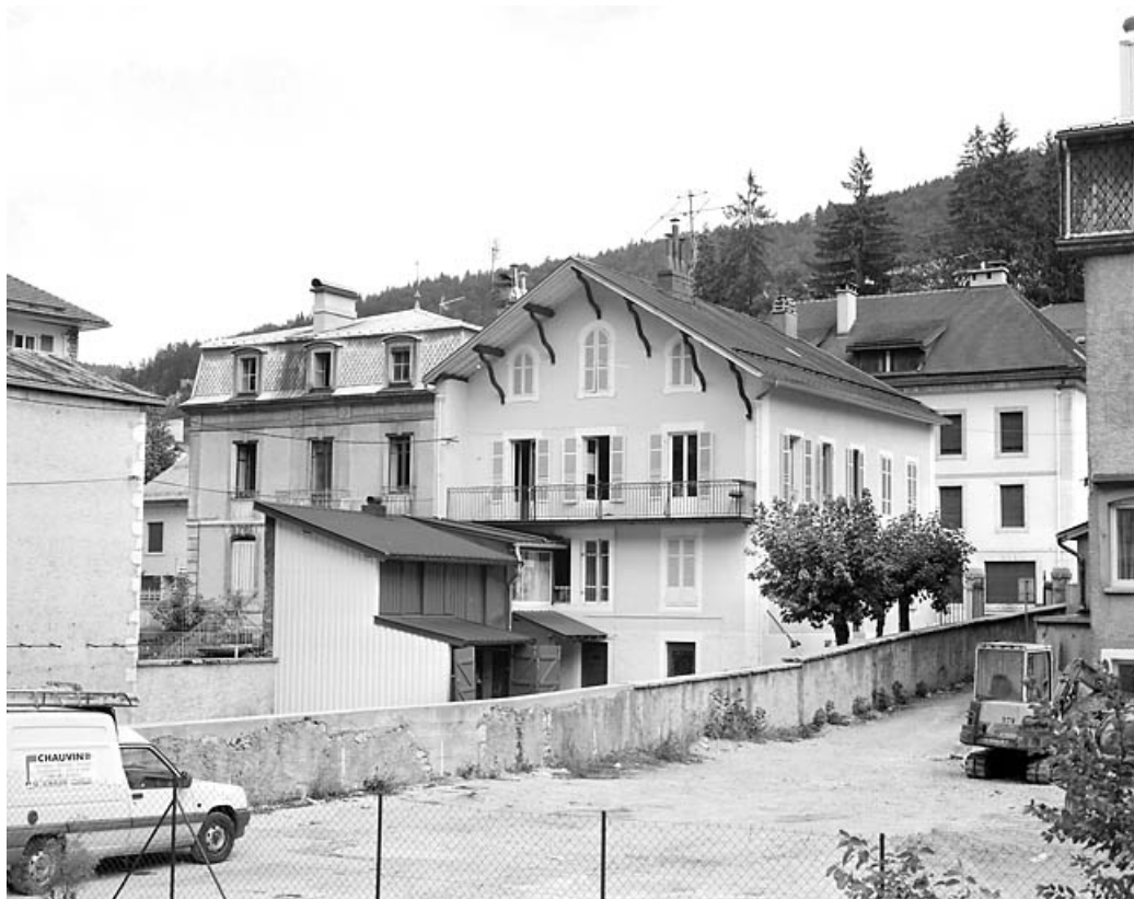
Vue d'ensemble, de trois quarts gauche.