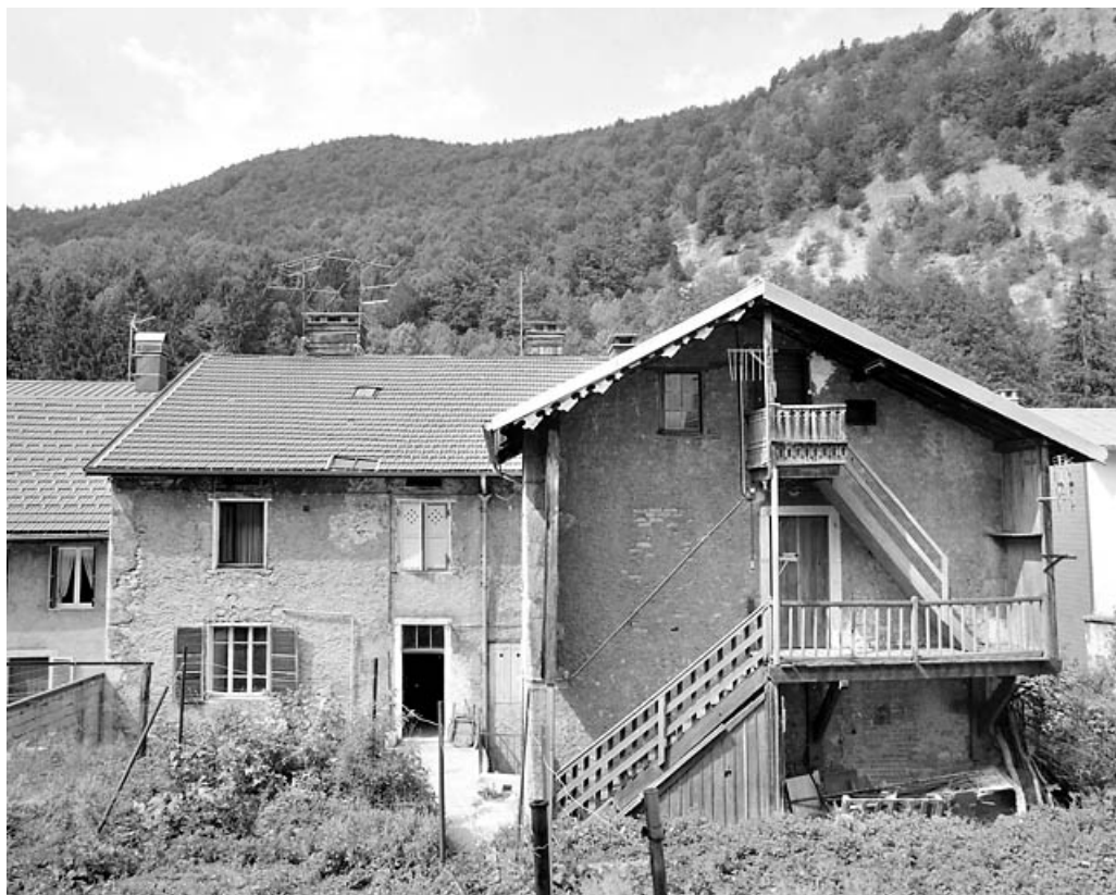
Façade postérieure et pignon du corps en retour.