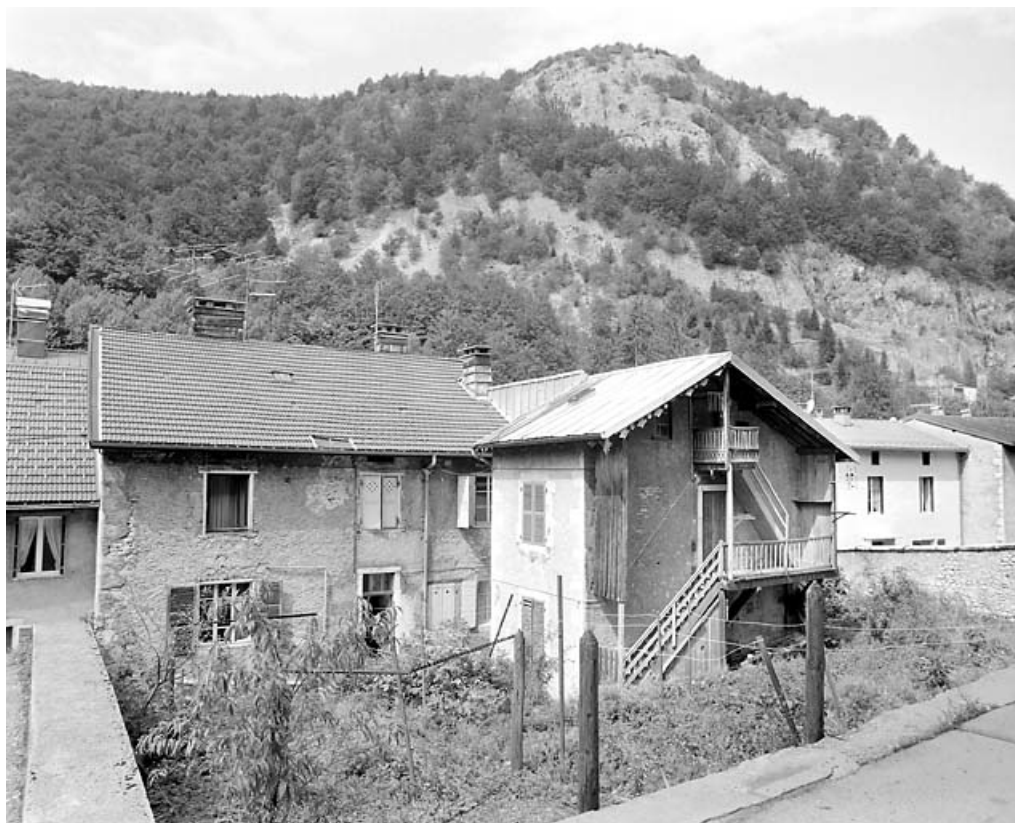
Vue d'ensemble, depuis l'est.