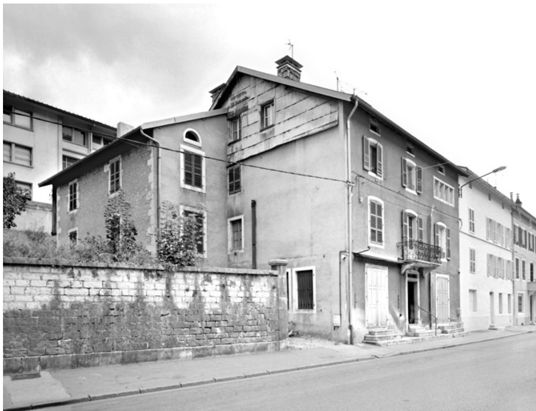
Vue d'ensemble, depuis le nord.