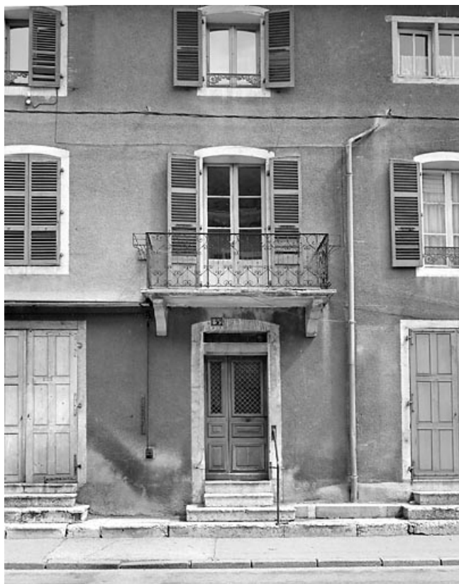
Façade antérieure : travée centrale.