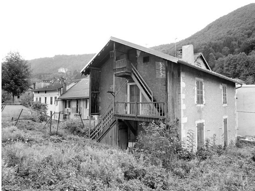
Corps en retour, vu du nord-est.