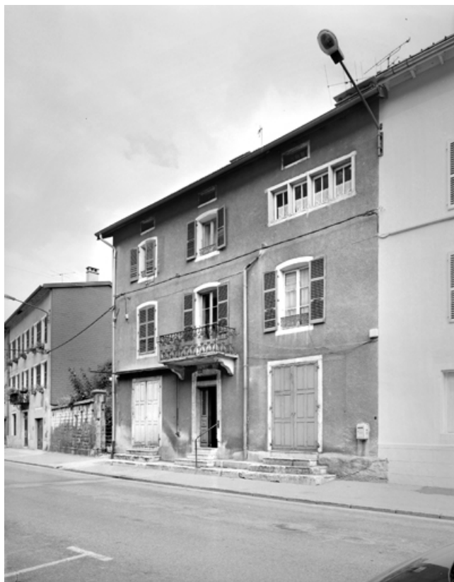
Façade antérieure, de trois quarts droite.