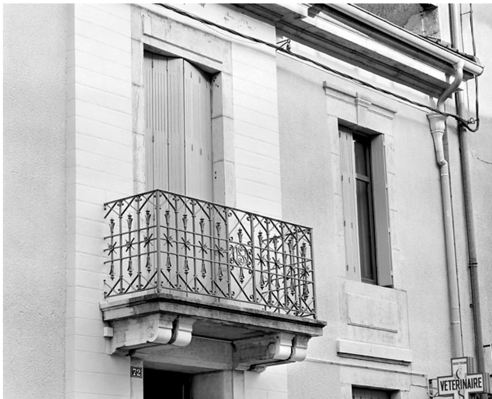
Façade antérieure : balcon et baies de l'étage.