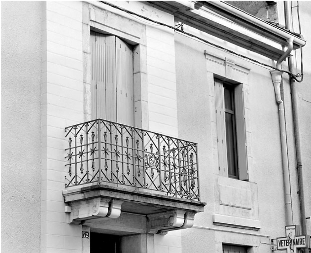
Façade antérieure : balcon et baies de l'étage.