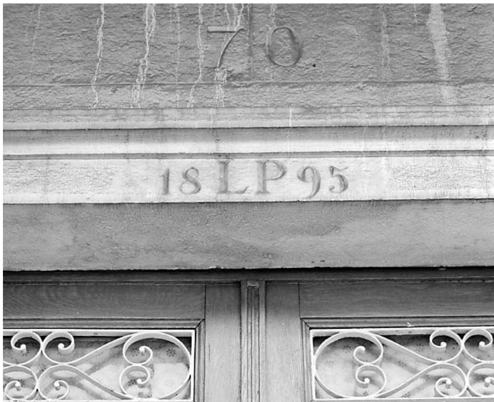
Linteau daté de la porte d'entrée, avant restauration.