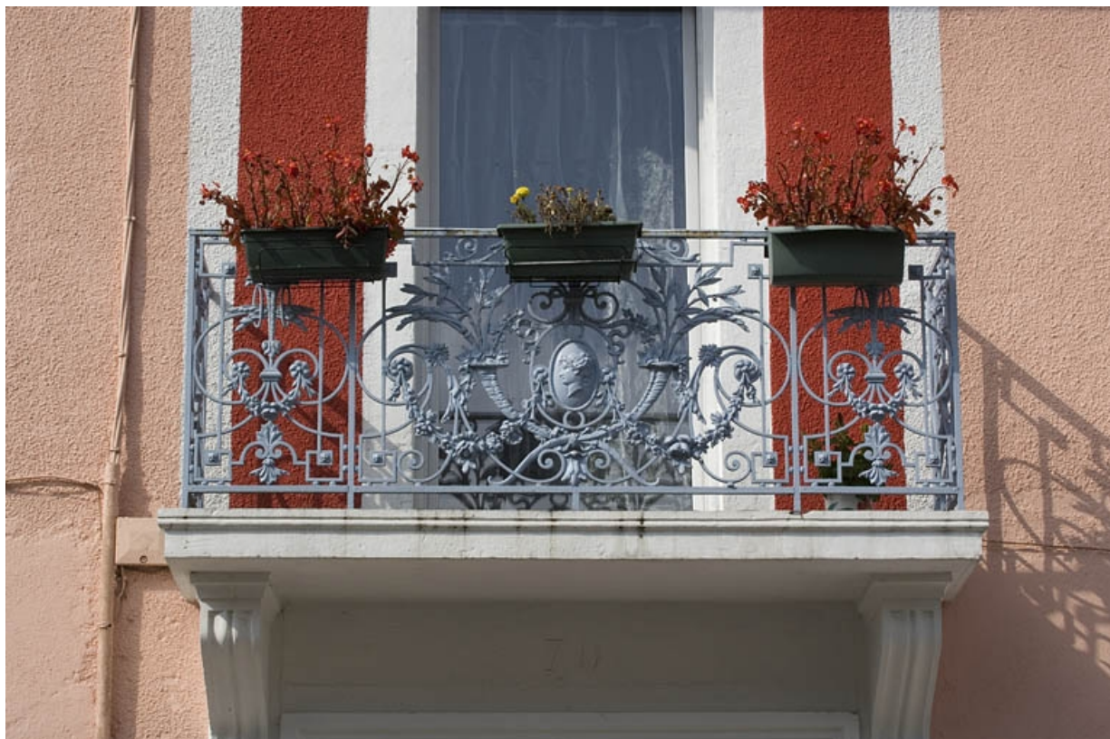
Balcon du premier étage, surmontant la porte d'entrée.