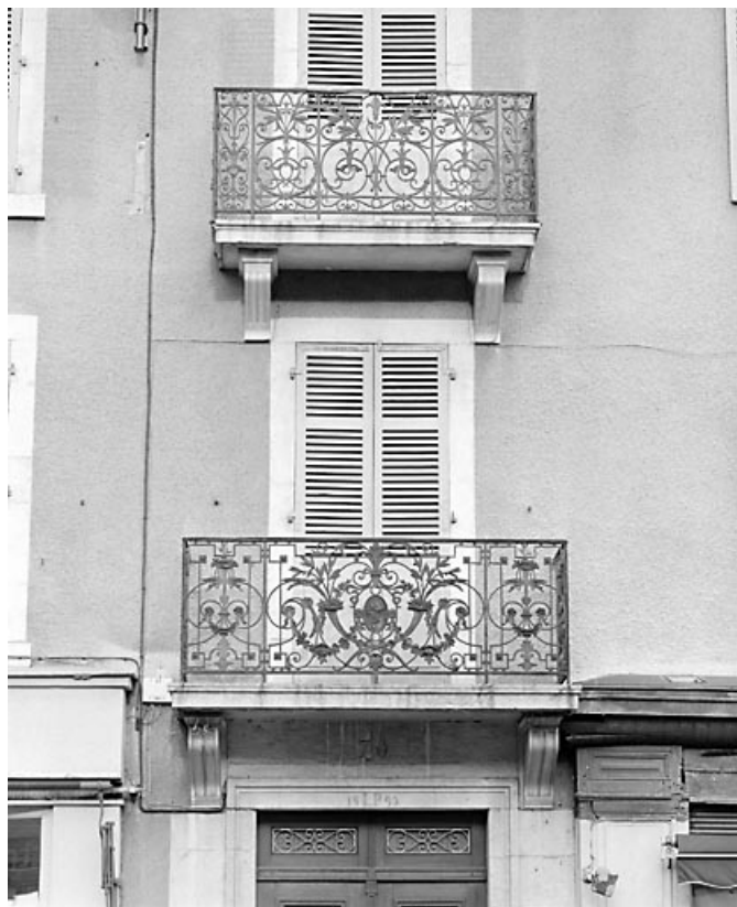
Balcons surmontant la porte d'entrée, avant restauration.