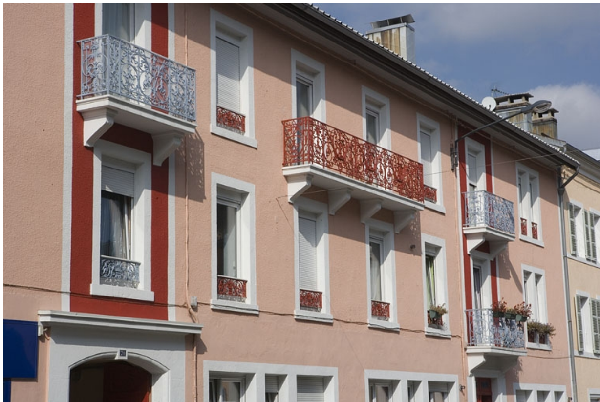
Façade antérieure : étages carrés, de trois quarts gauche.