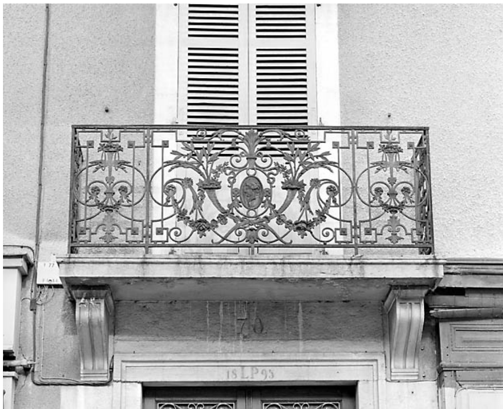
Balcon du premier étage, surmontant la porte d'entrée, avant restauration.