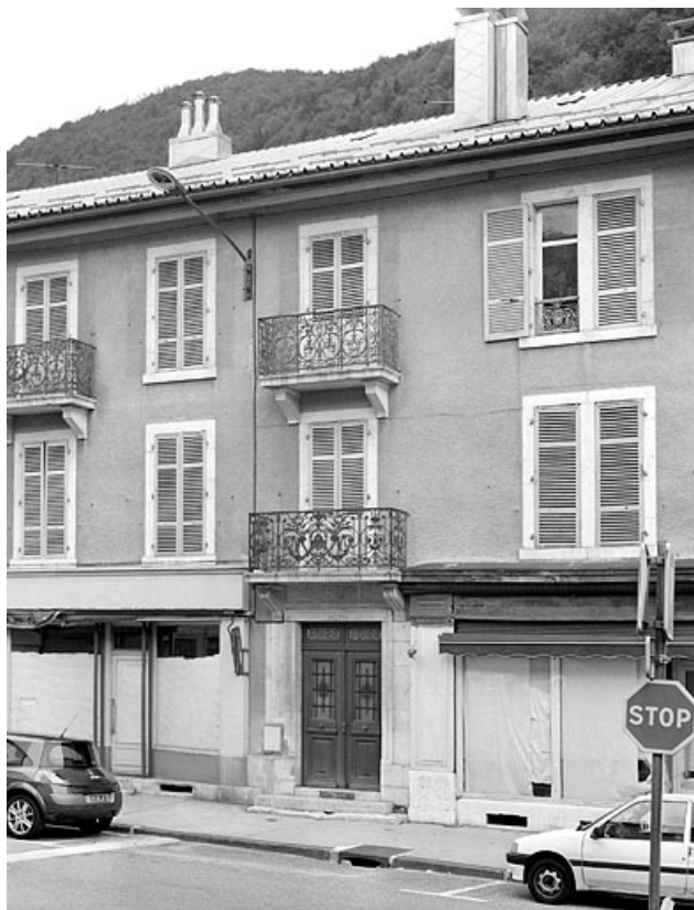
Façade antérieure, avant restauration : travée de la porte d'entrée. 39, Morez, 70 rue de la République