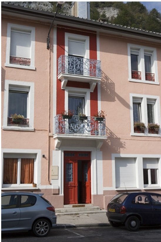
Façade antérieure : travée de la porte d'entrée. 39, Morez, 70 rue de la République