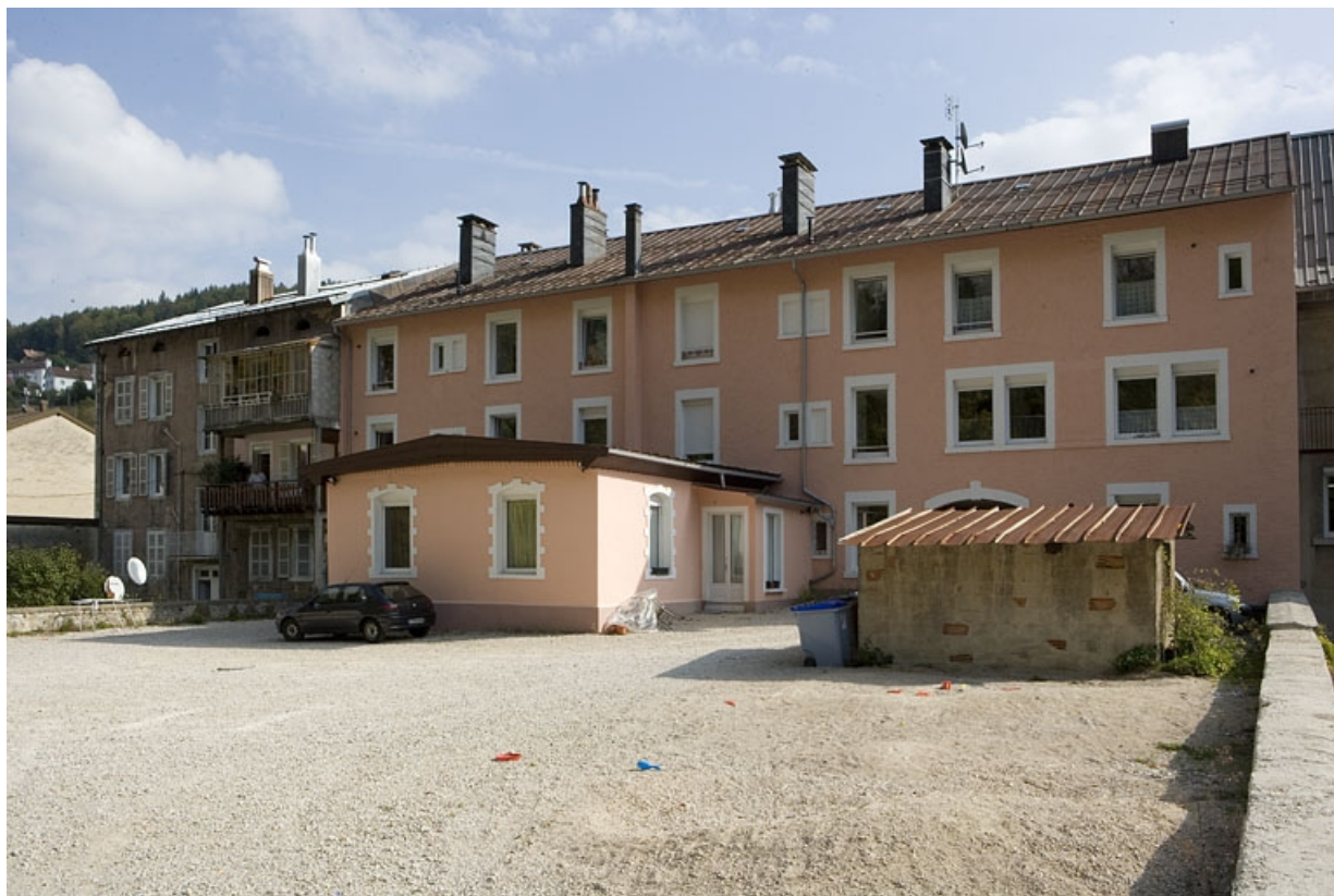
Façade postérieure, de trois quarts droite.