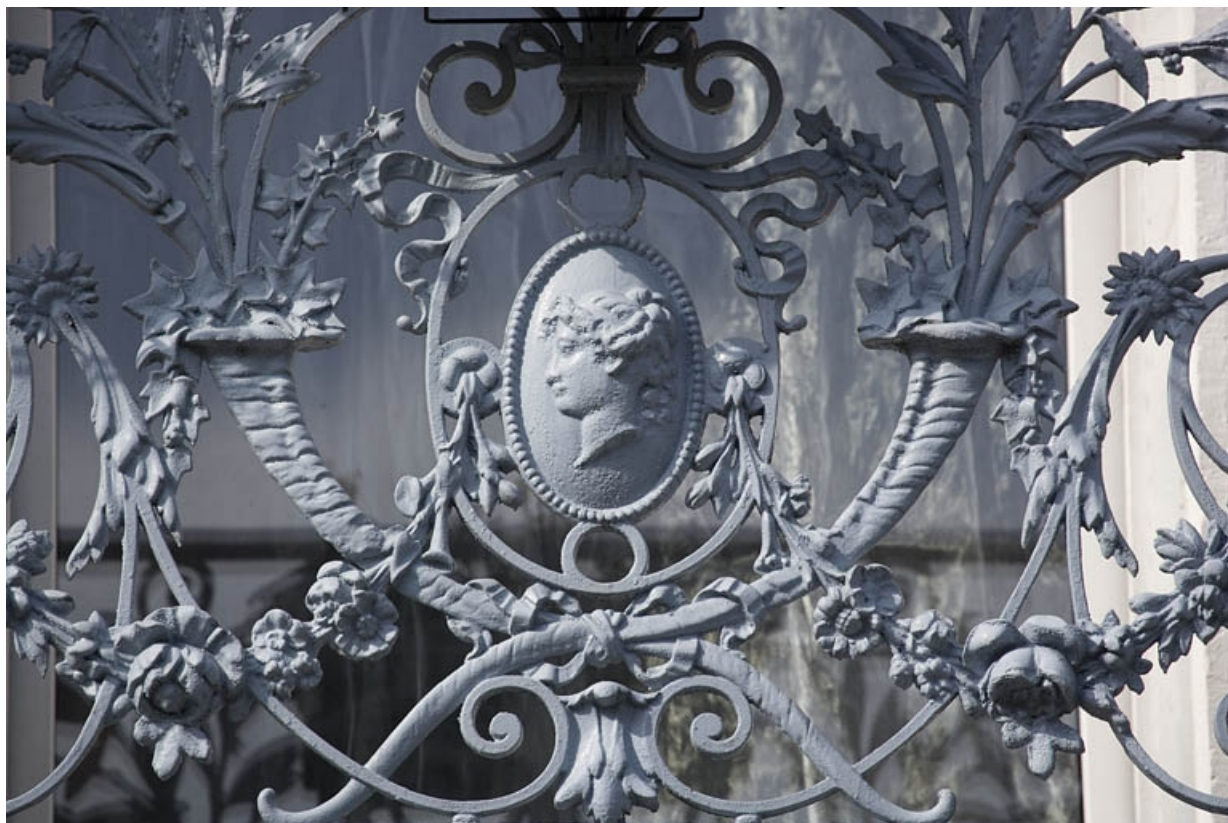
Ferronnerie du balcon du premier étage, surmontant la porte d'entrée.