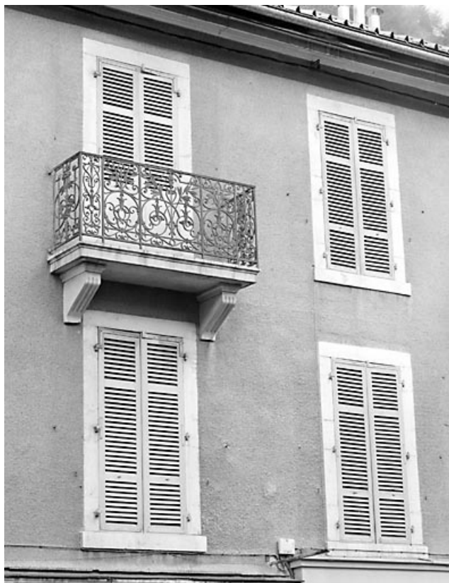
Balcon et baies des étages carrés, avant restauration.