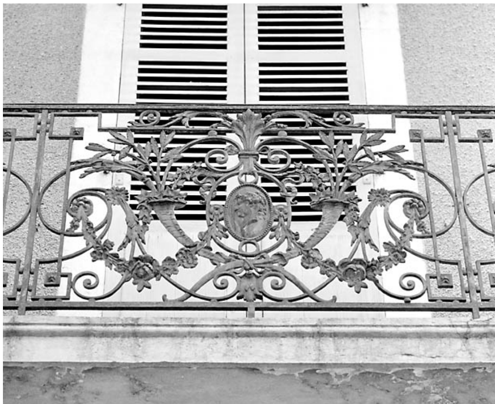
Ferronnerie du balcon du premier étage, surmontant la porte d'entrée, avant restauration. 39, Morez, 70 rue de la République