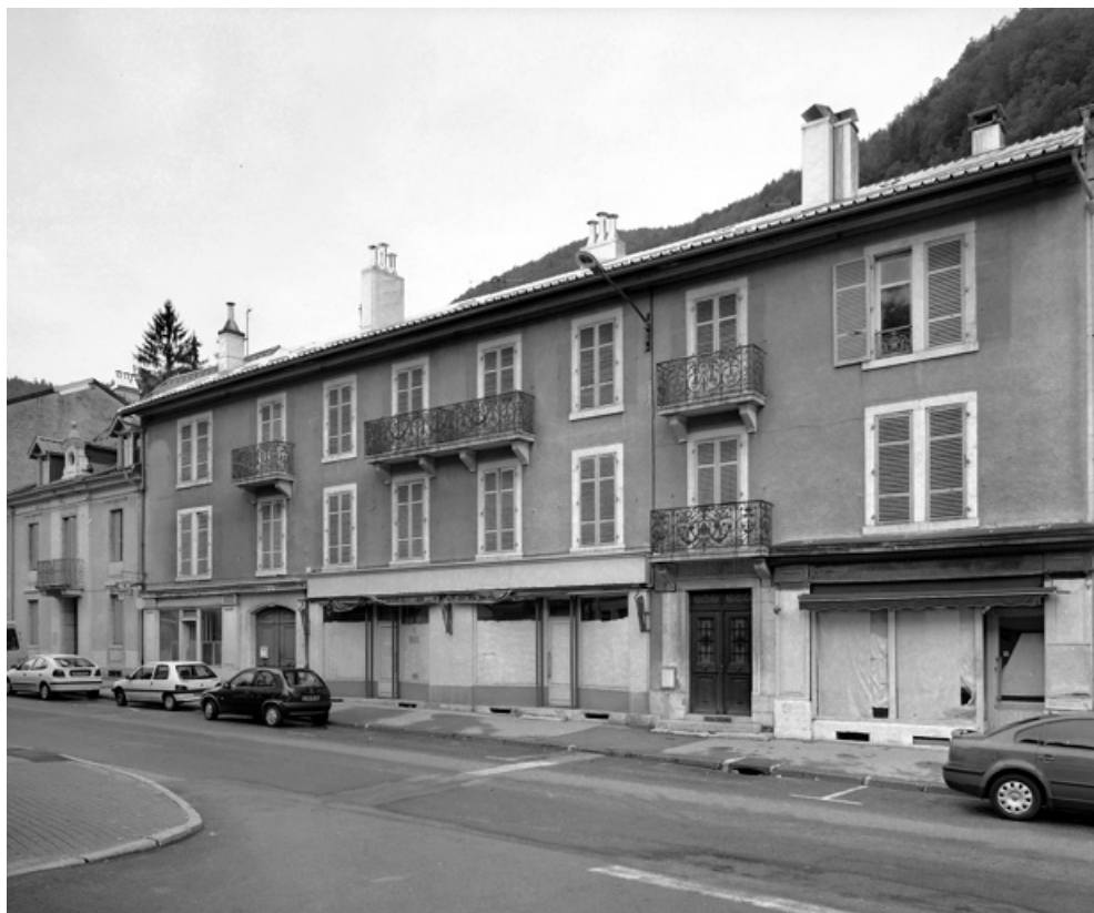
Façade antérieure de trois quarts droite, avant restauration.