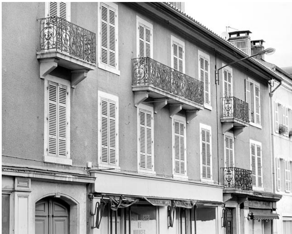
Façade antérieure, avant restauration : étages carrés, de trois quarts gauche. 39, Morez, 70 rue de la République