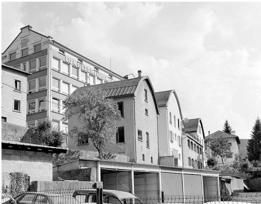
Façade postérieure, de trois quarts gauche.