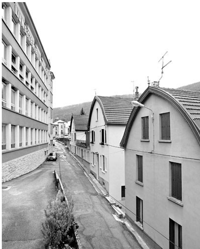
Façade antérieure, de trois quarts droite. Les deux bâtiments semblables à gauche sont les logements de l'usine Pelletier et Cok. 39, Morez, 6 rue de la Paix