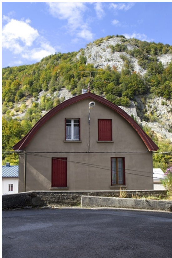
Façade antérieure : étage carré et étage en surcroît. 39, Morez, 6 rue de la Paix