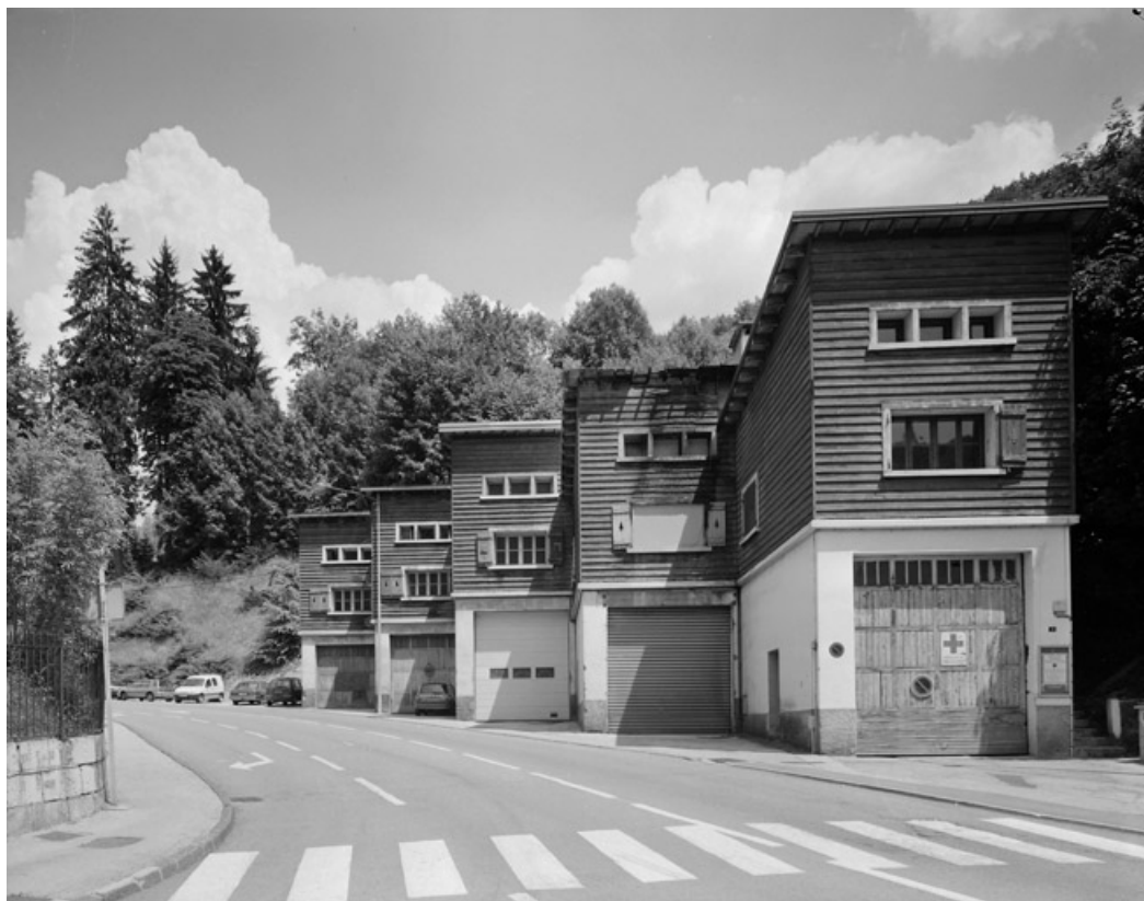
Vue d'ensemble, depuis l'ouest.