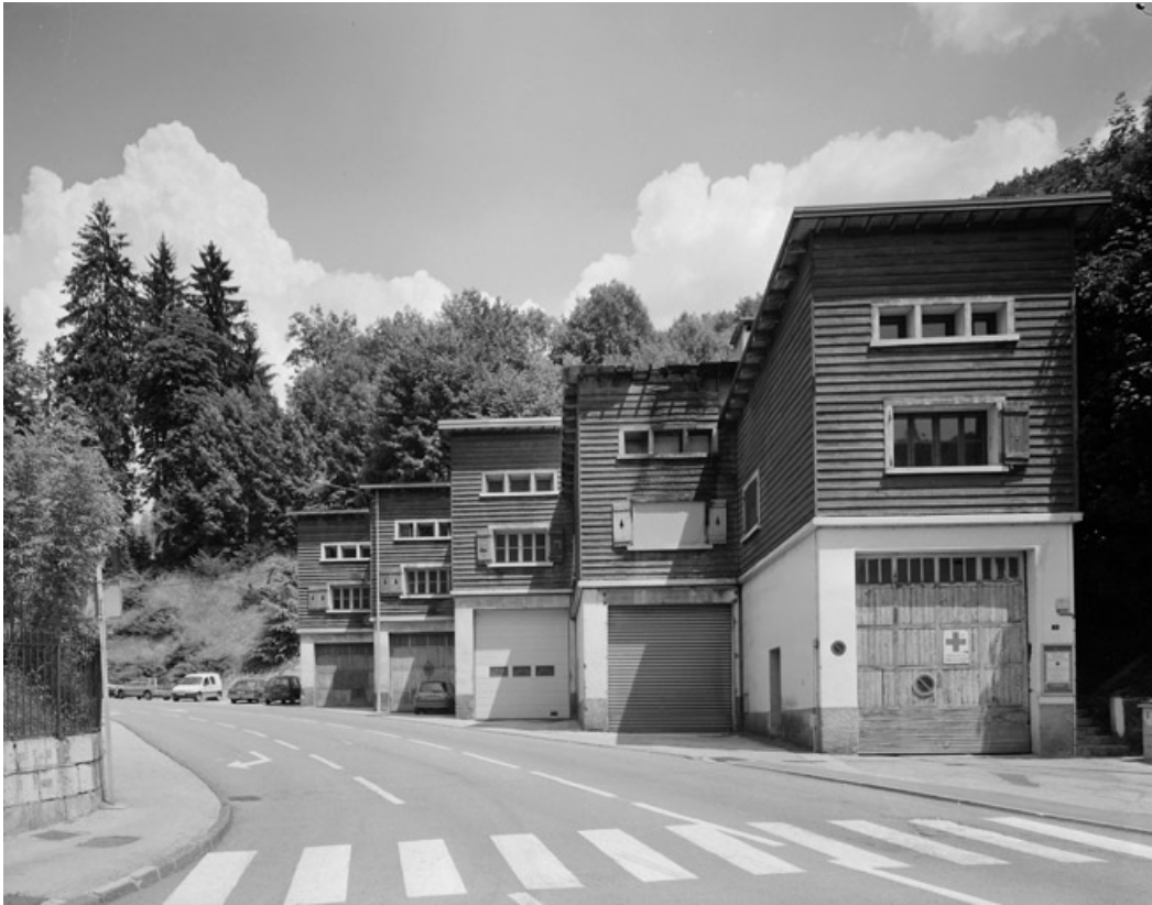
Vue d'ensemble, depuis l'ouest.