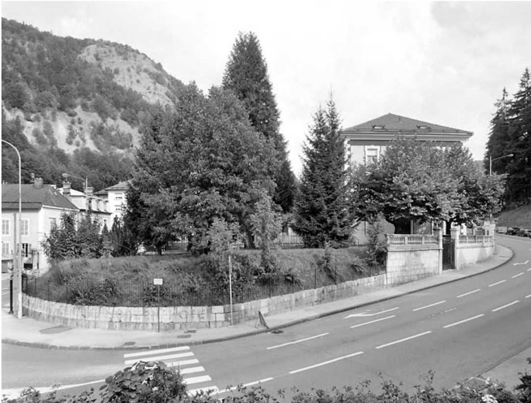
Vue d'ensemble, depuis le sud.