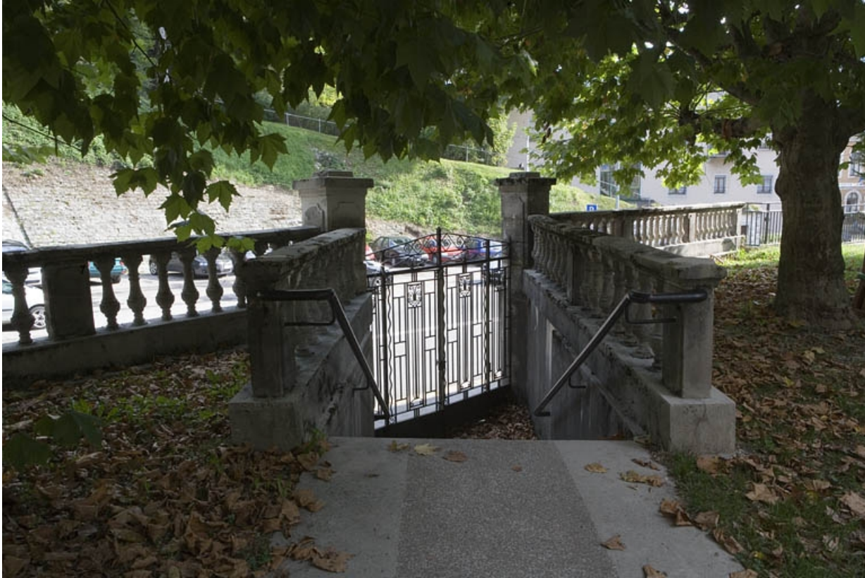
Escalier indépendant, côté jardin.