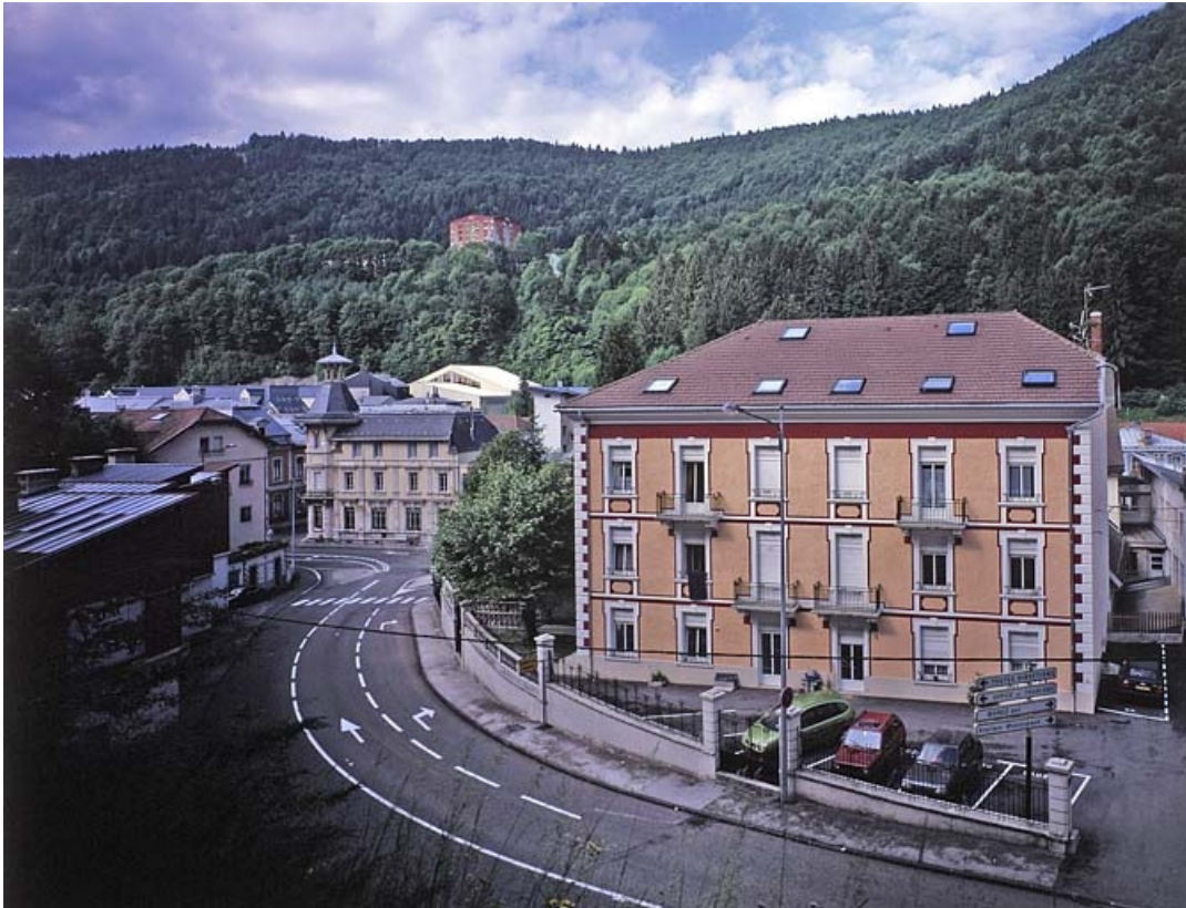
Vue d'ensemble plongeante, depuis l'est.