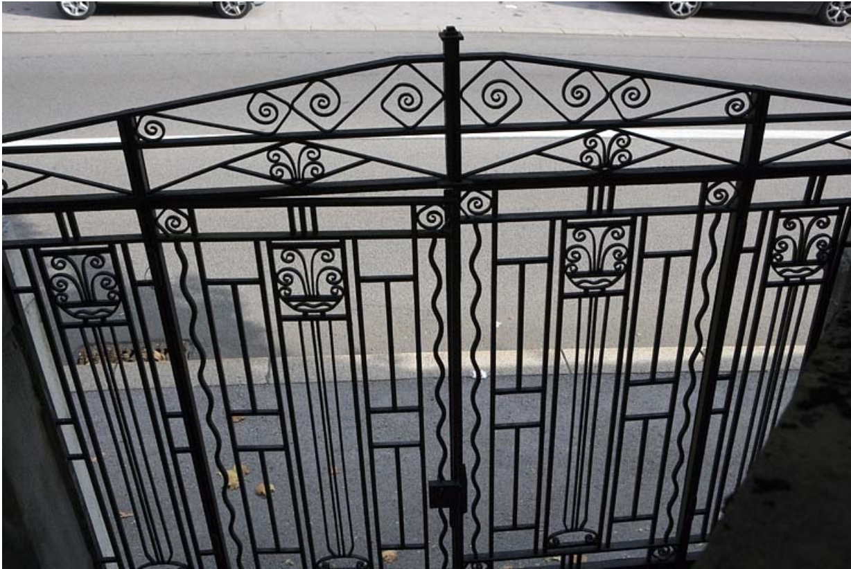
Détail de la grille de l'escalier indépendant.