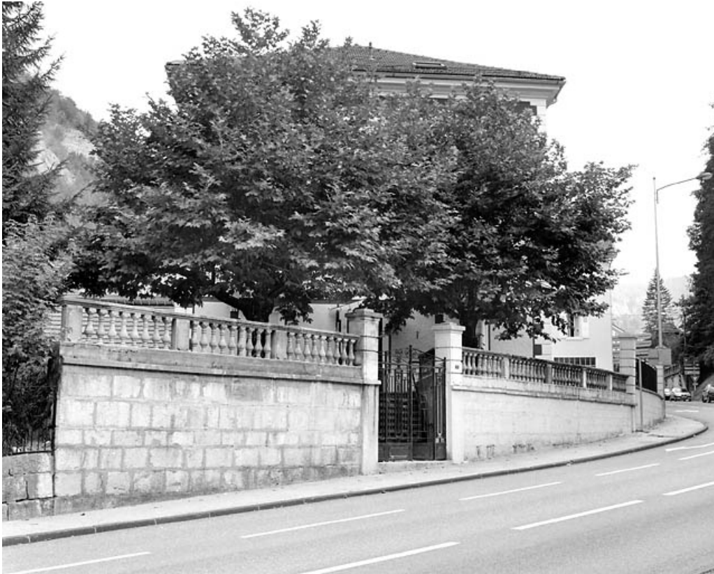
Mur de soutènement et escalier indépendant, côté rue.