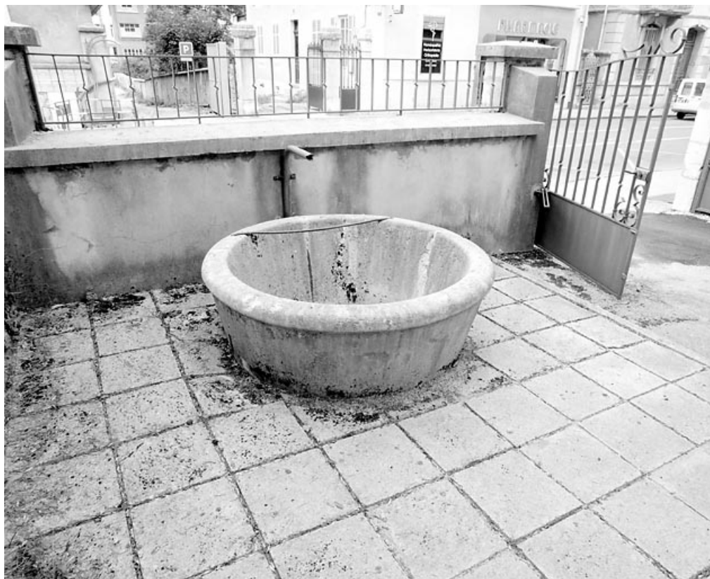
Fontaine (vestige de la brasserie).