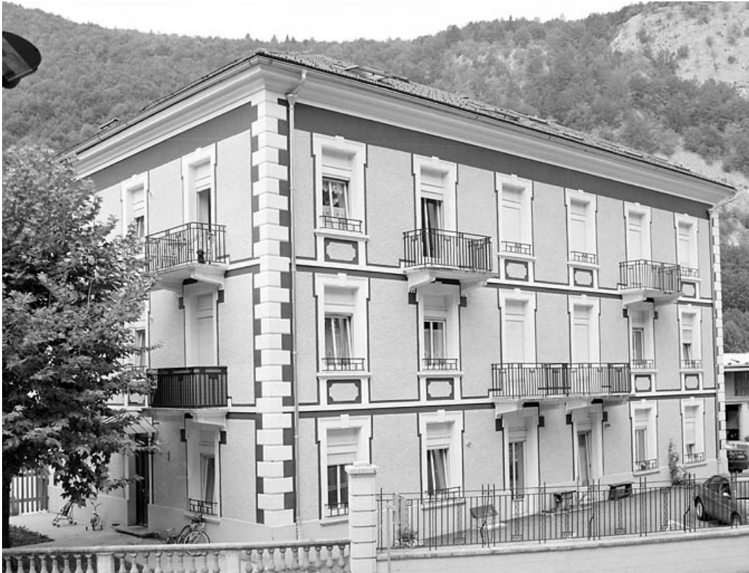
Façade antérieure, de trois quarts gauche.