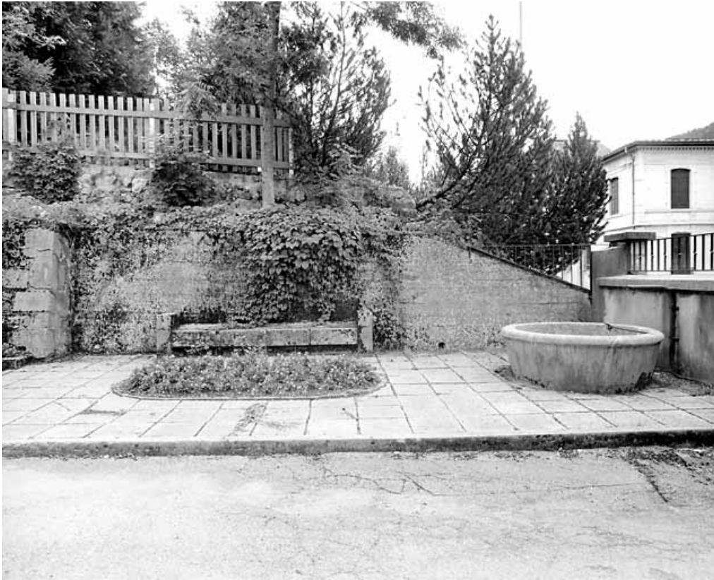
Fontaine et banc (vestiges de la brasserie ?).