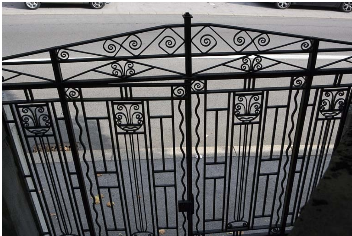
Détail de la grille de l'escalier indépendant.