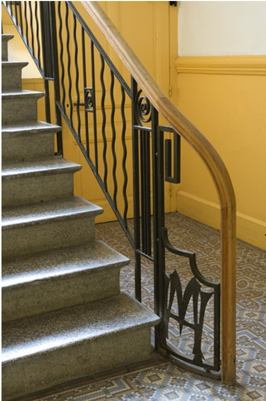
Rampe d'escalier, avec le monogramme MH.