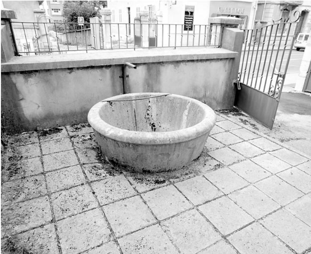
Fontaine (vestige de la brasserie).