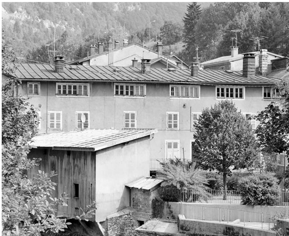
Façade principale : les deux étages carrés.