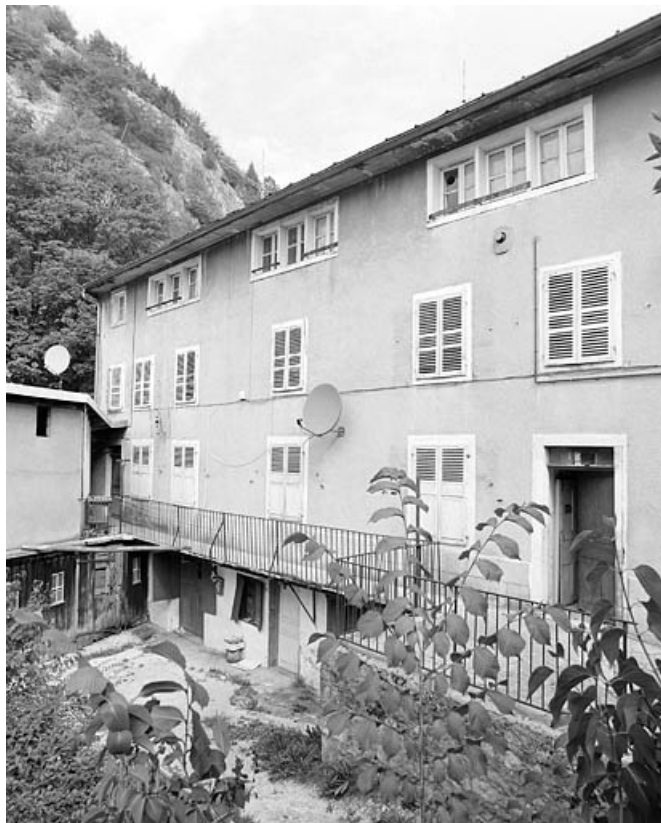
Façade principale : extension de 1861.