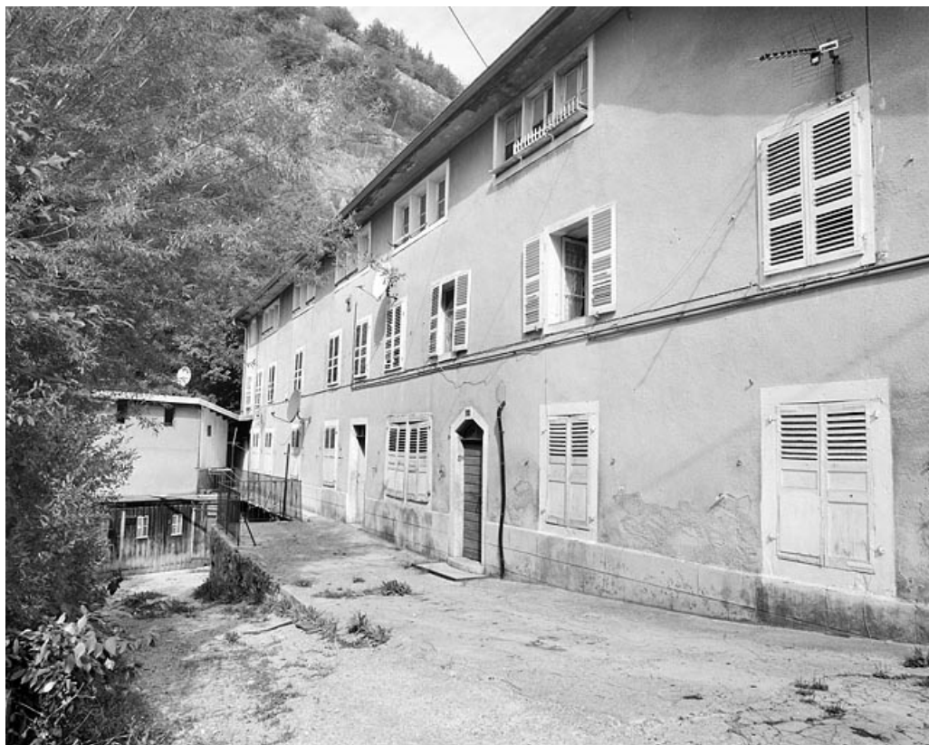
Façade principale, de trois quarts droite.