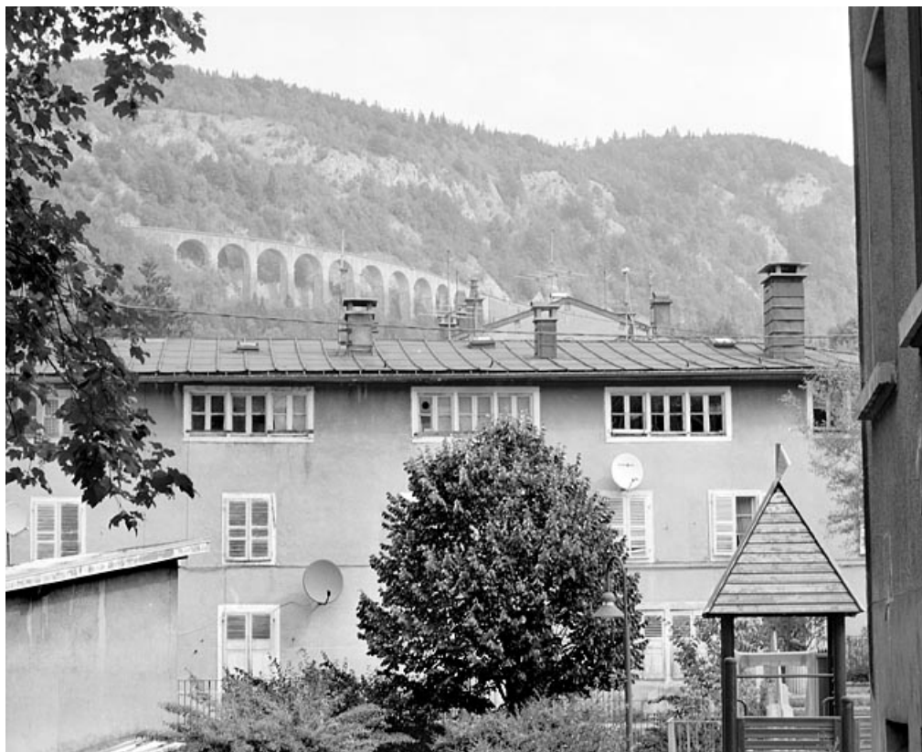
Façade principale : ensembles de baies lunetières.