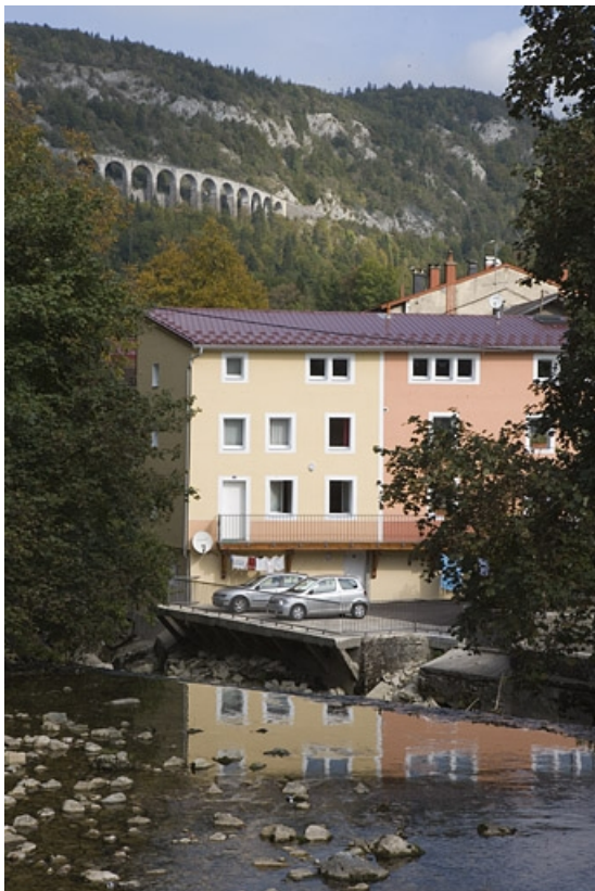
Vue d'ensemble depuis le sud, après restauration.