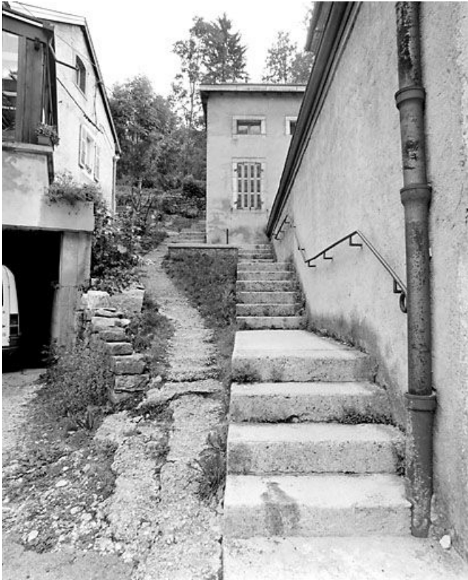
Escalier conduisant à l'ancien atelier de fabrication (au 35 bis). 39, Morez, 35 et 35 bis rue de la République