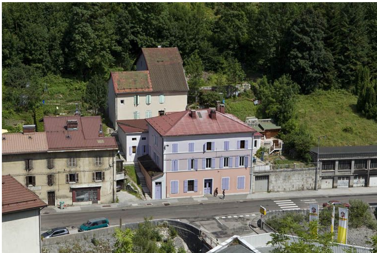
Vue d'ensemble plongeante, depuis l'ouest.

39, Morez, 35 et 35 bis rue de la République