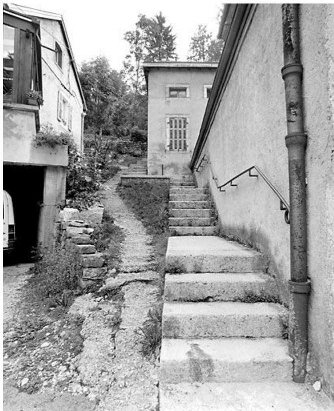
Escalier conduisant à l'ancien atelier de fabrication (au 35 bis). 39, Morez, 35 et 35 bis rue de la République