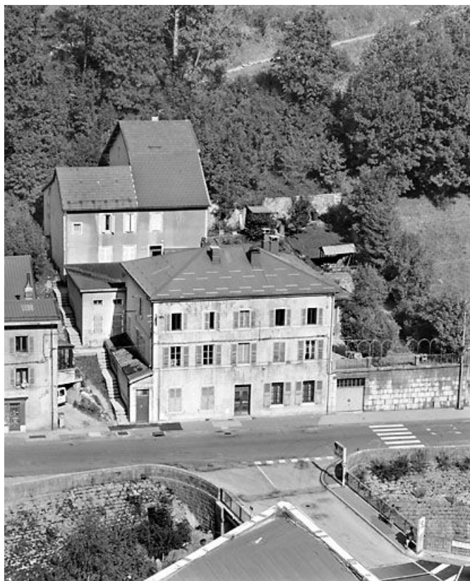
Maison avec atelier (19 e siècle) aux n° 35 et 35 bis rue de la République. Maison (AD 211) bâtie vers 1840. 39, Morez, 35 et 35 bis rue de la République