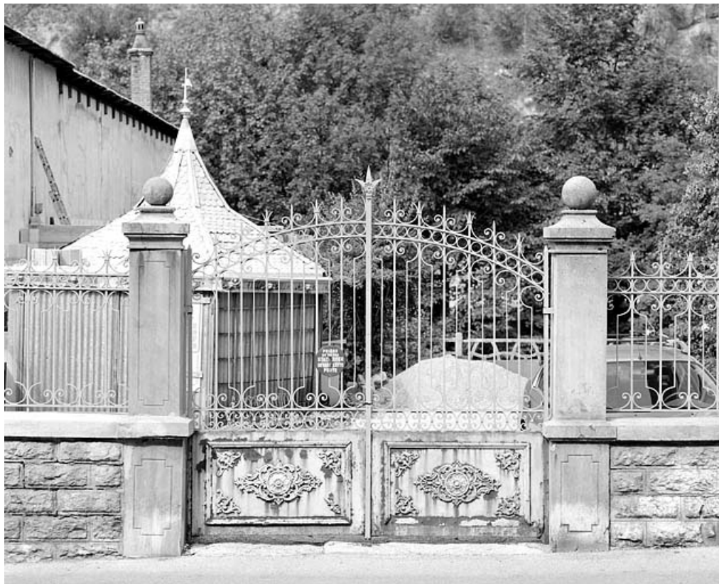
Portail et fabrique de jardin.