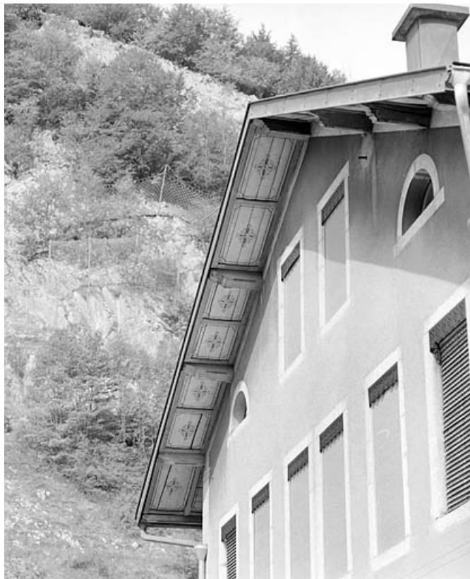
Saillie de rive peinte.