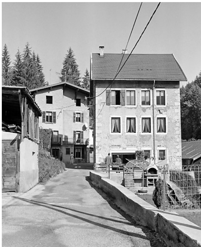
Vue d'ensemble, depuis le sud.