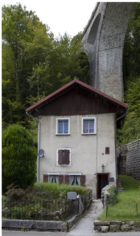
Élévation antérieure. 39, Morez, 5 rue Voltaire