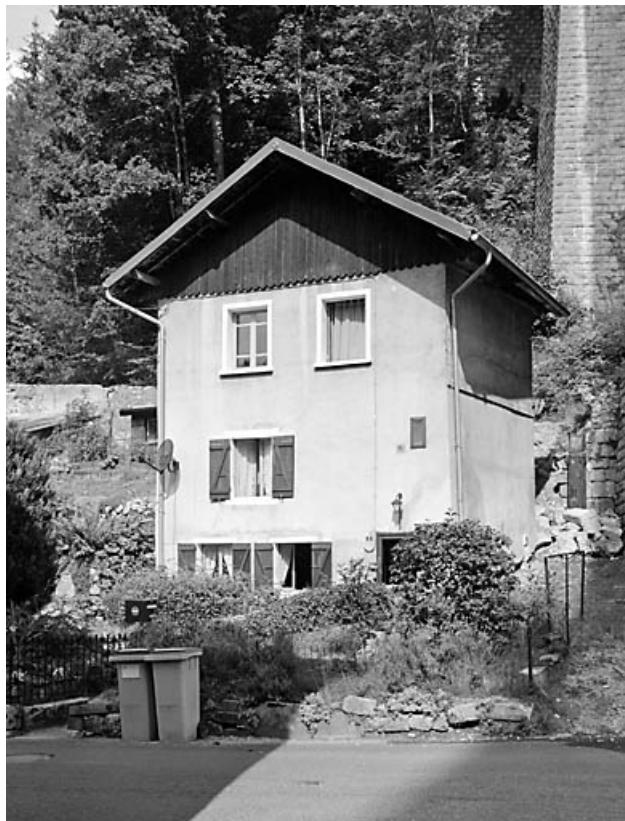
Elévations antérieure et latérale droite.