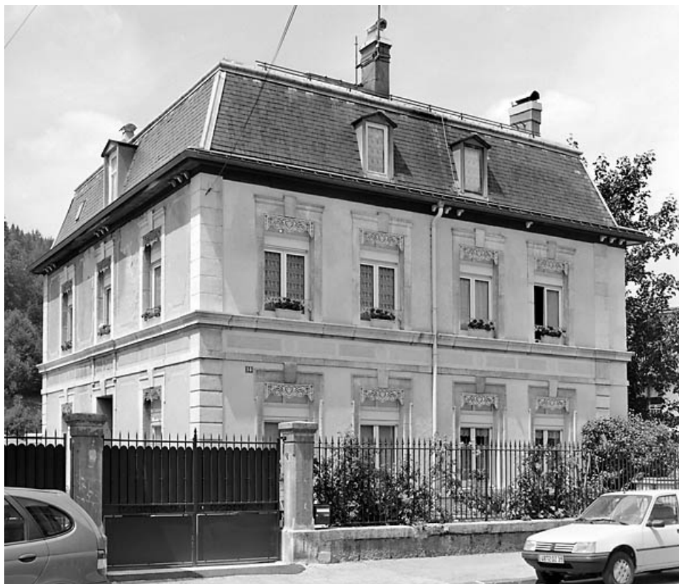
Elévations antérieure et latérale gauche.