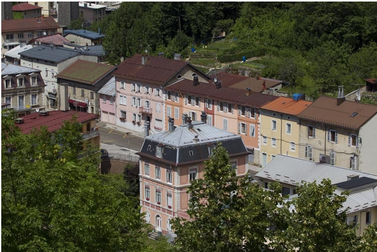
Vue d'ensemble plongeante, depuis le sud (élévations postérieure et latérale gauche). 39, Morez, 14 rue de la République