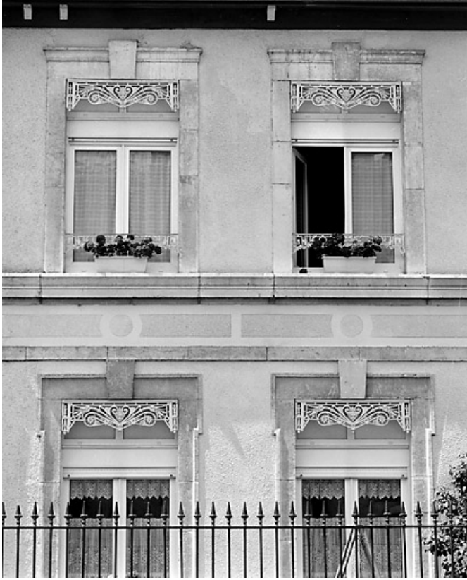
Élévation antérieure : baies.