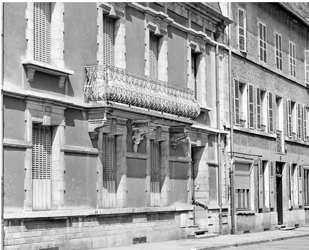
Elévation antérieure : baies.