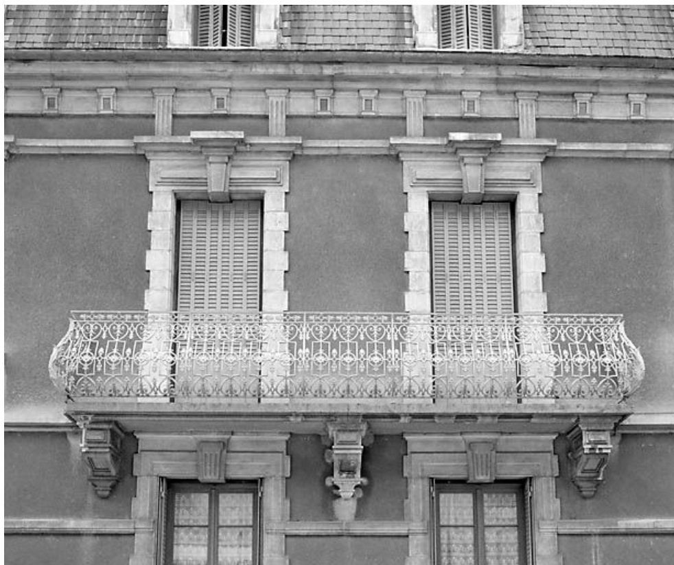
Elévation antérieure : balcon.