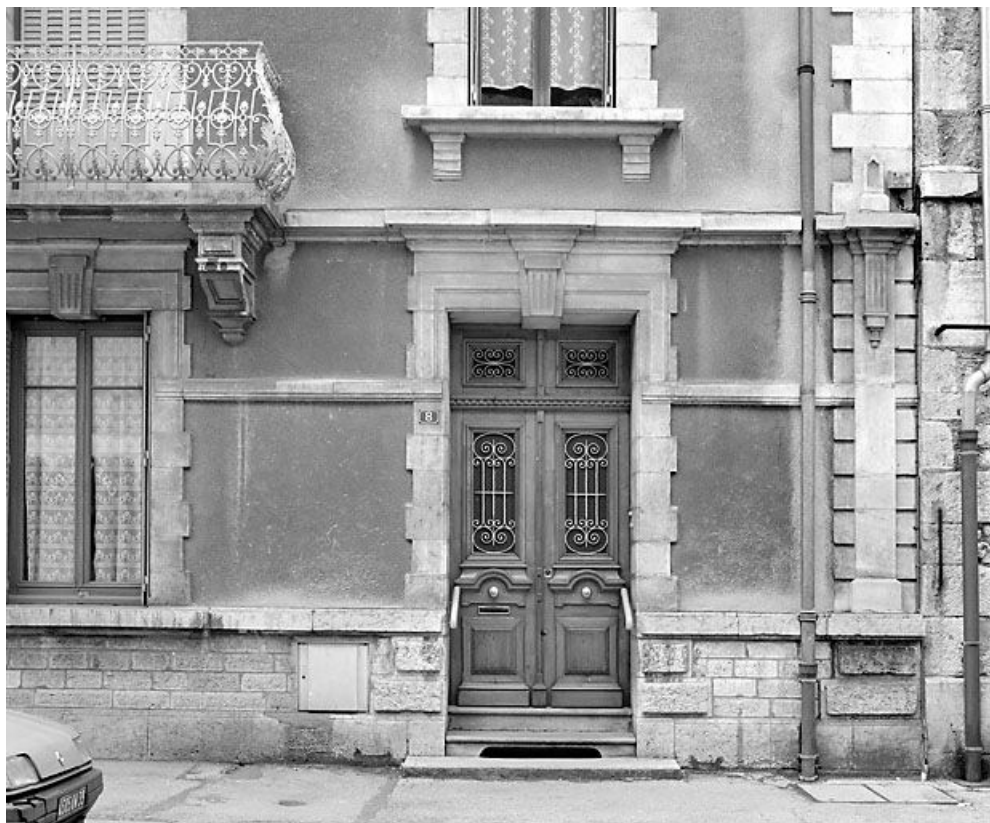
Elévation antérieure : porte.