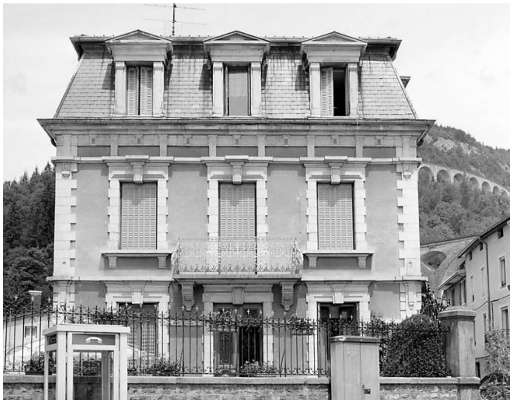
Elévation latérale gauche (vue rapprochée).