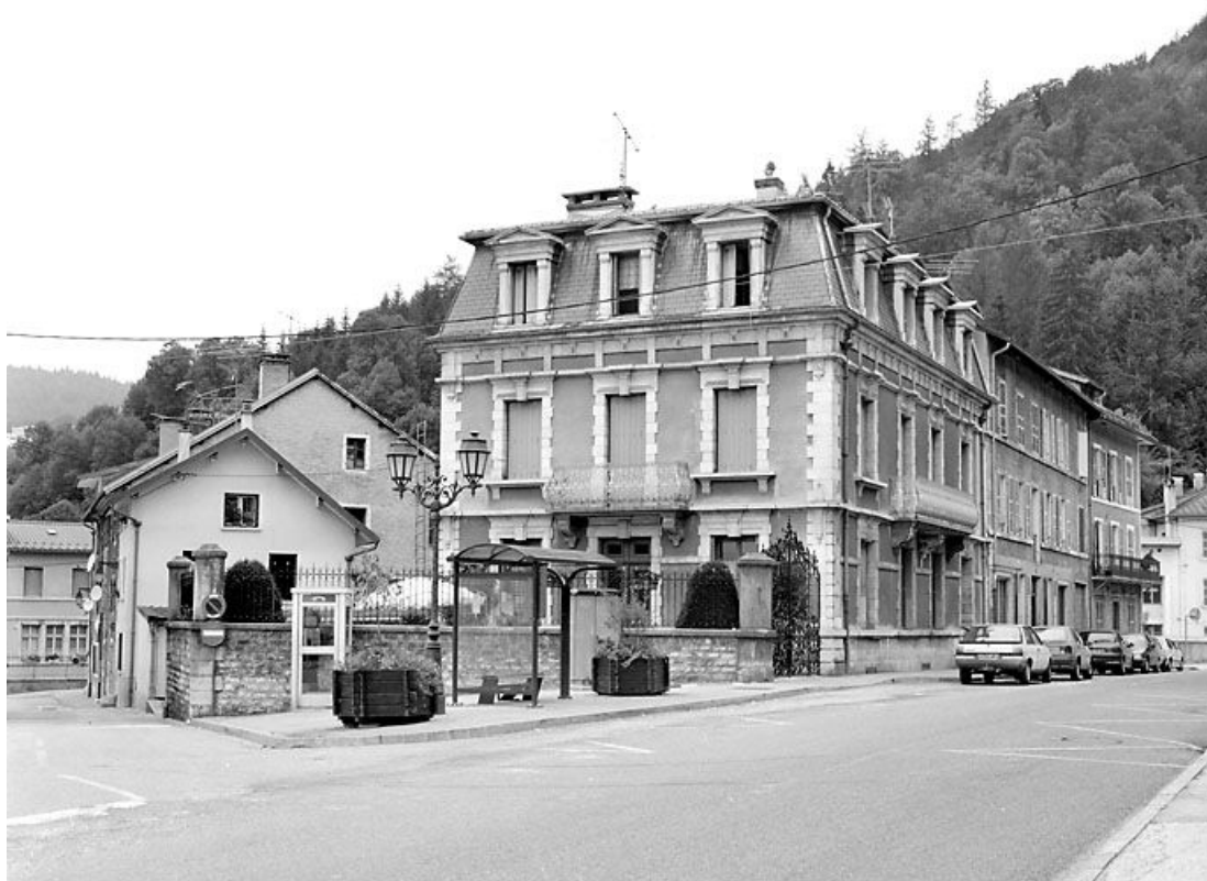
Maison de notable (1907-1908) au n° 8 rue de la République. Maison (AB 68). 39, Morez, 8 rue de la République