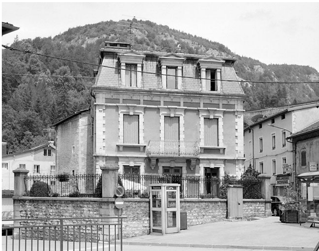
Elévation latérale gauche.