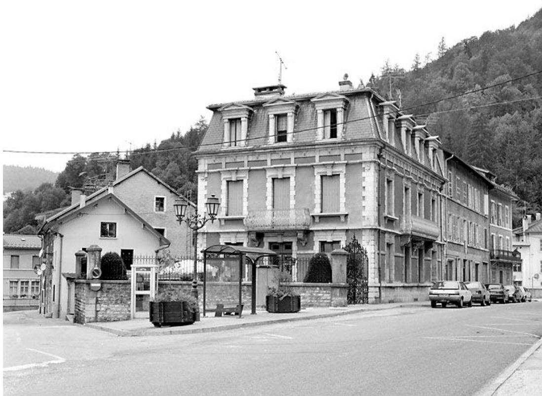
Maison de notable (1907-1908) au n° 8 rue de la République. Maison (AB 68).