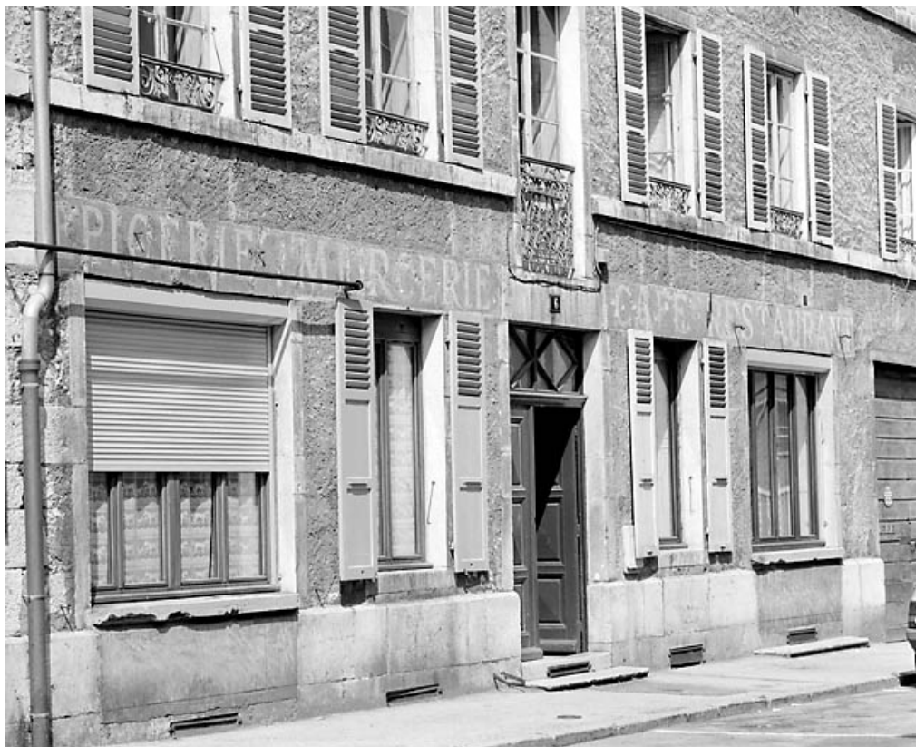
Baies de l'élévation antérieure.