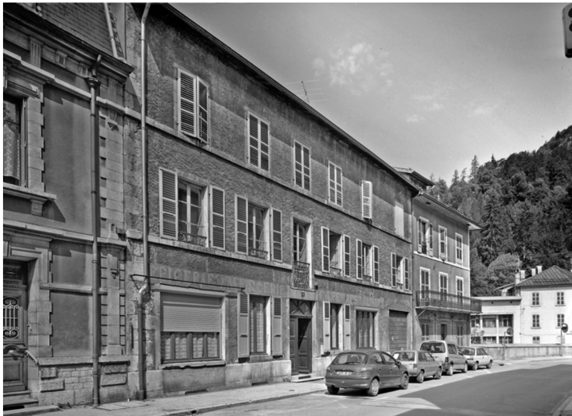
Élévation antérieure, de trois quarts gauche.