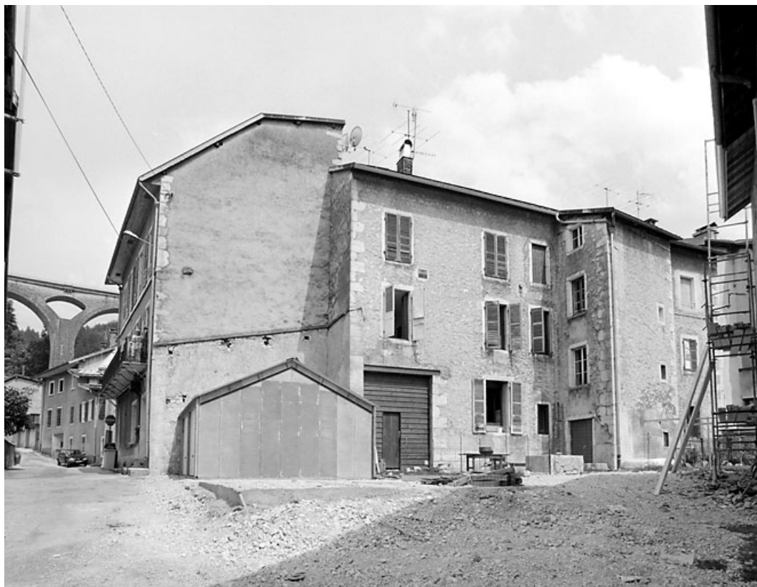
Élévation postérieure, de trois quarts gauche.