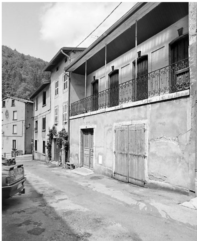
Corps de bâtiment 4 rue Traversière, de trois quarts droite.