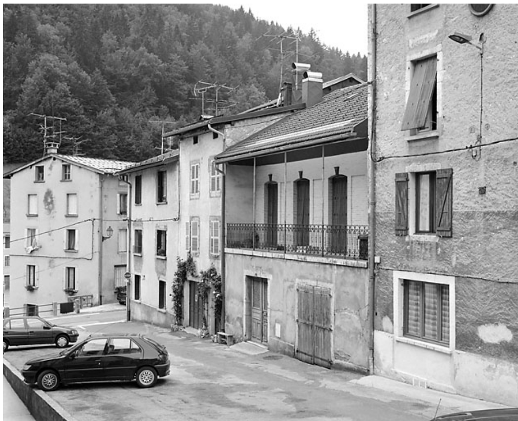
Corps de bâtiment 4 rue Traversière : vue d'ensemble, de trois quarts droite. 39, Morez, 6 place Jules Girod