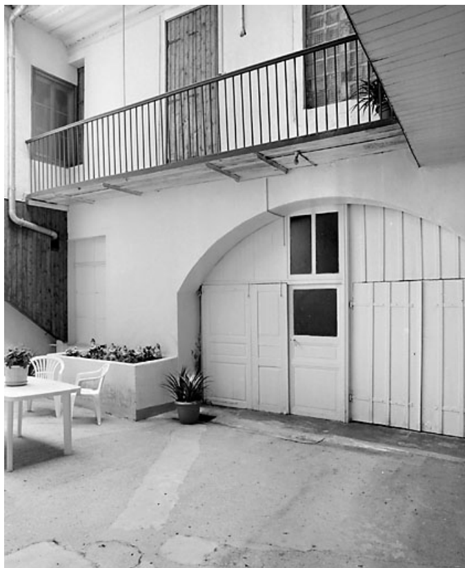
Baie et coursière du corps de bâtiment donnant 4 rue Traversière. 39, Morez, 6 place Jules Girod