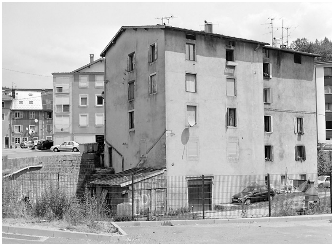
Élévation postérieure, de trois quarts gauche.