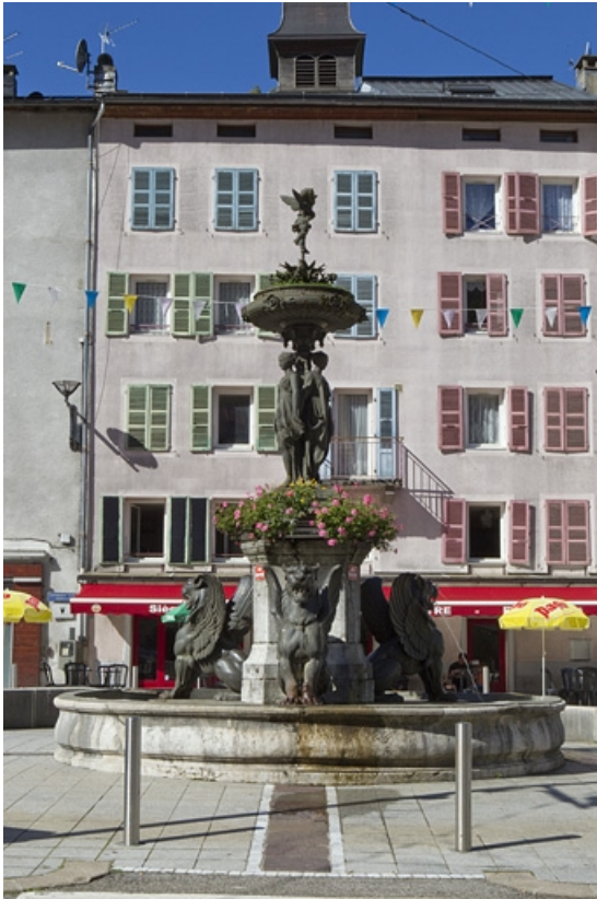
Fontaine aux lions, place Henri Lissac. 39, Morez