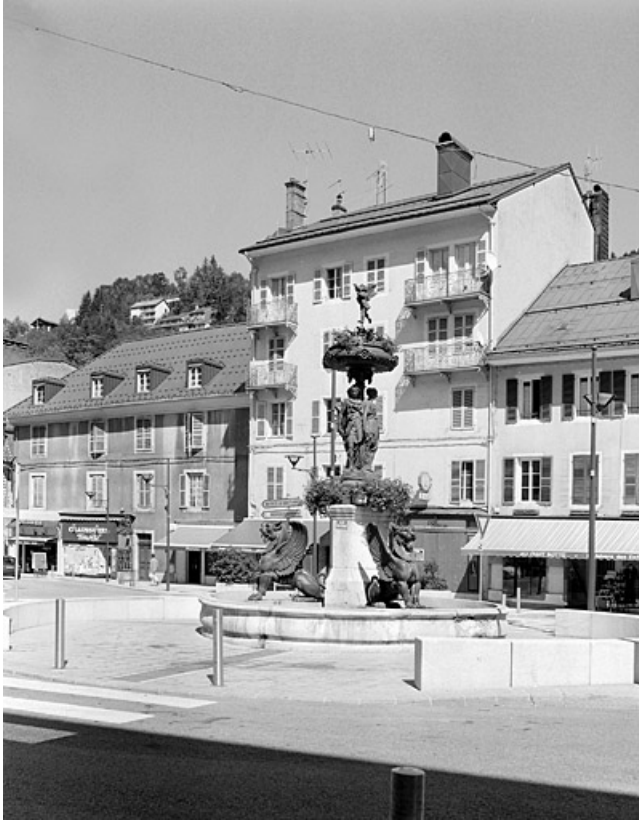
Vue d'ensemble, depuis le sud-ouest.