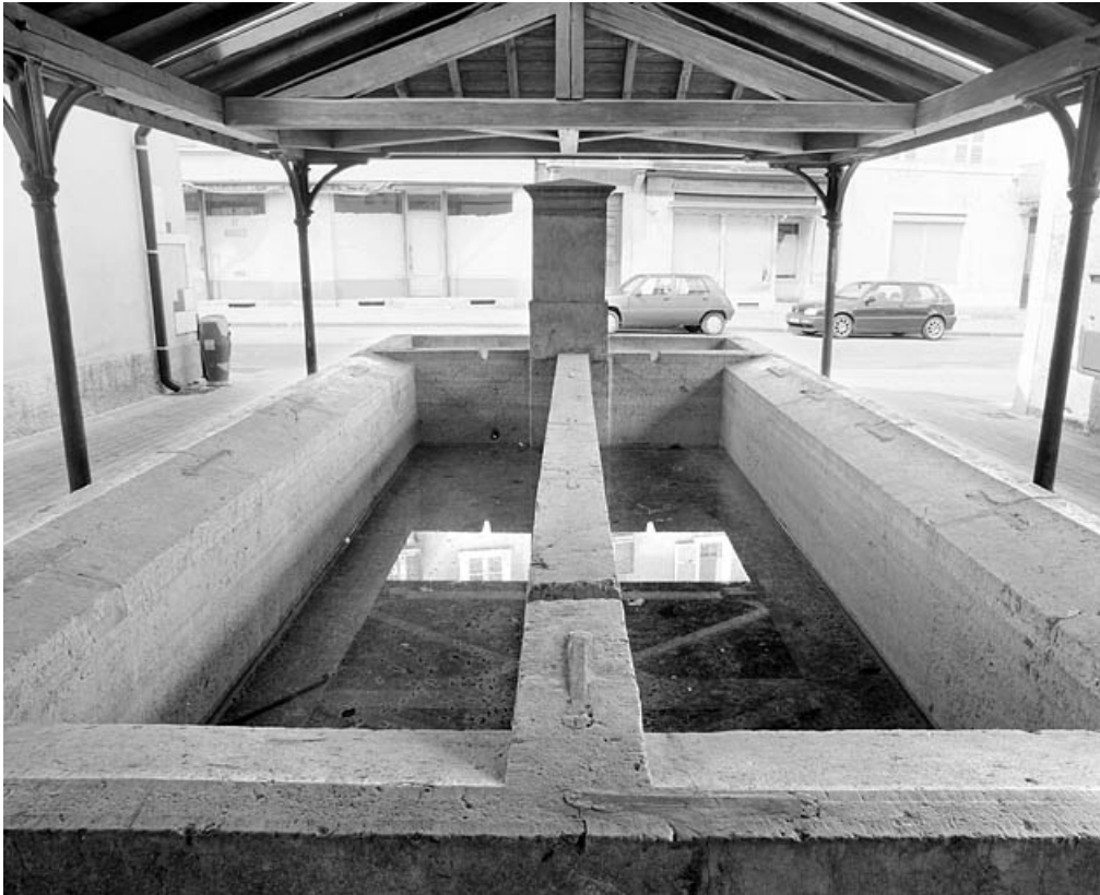
Bassin côté lavoir, vu de face.