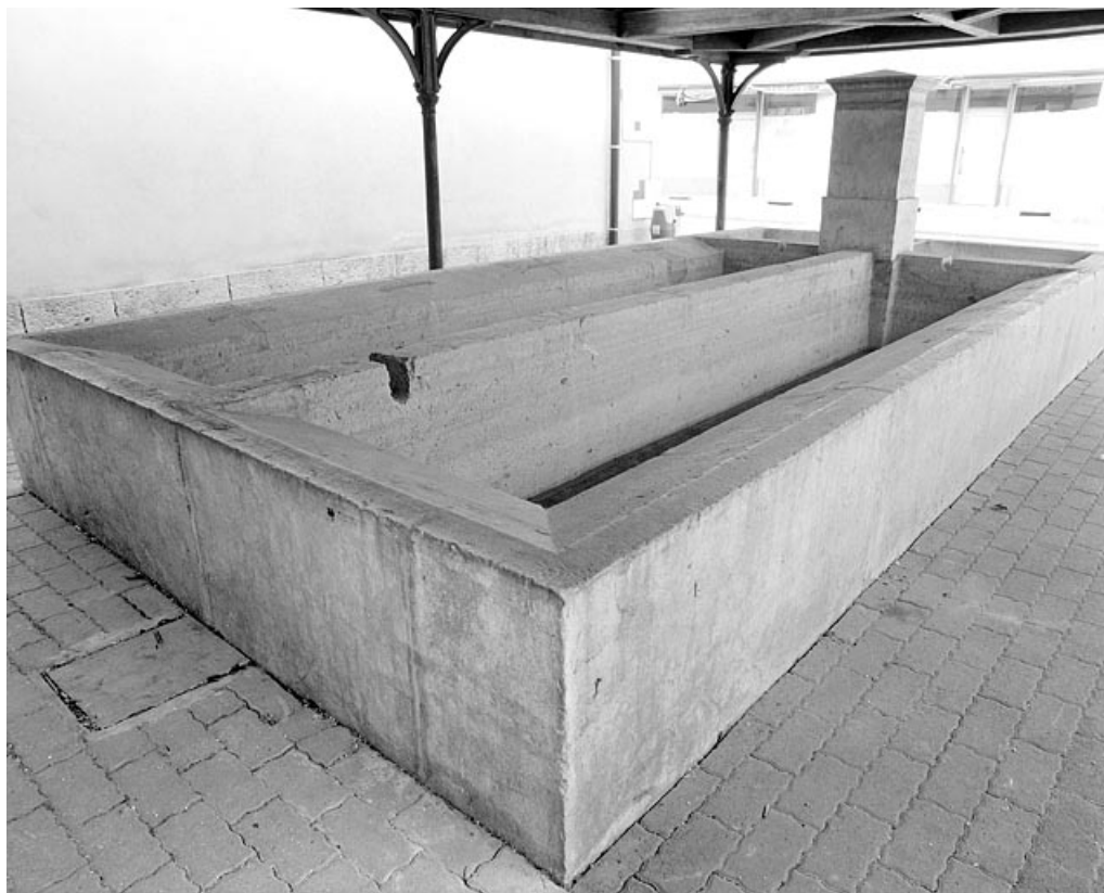
Bassin côté lavoir, vu de trois quarts.