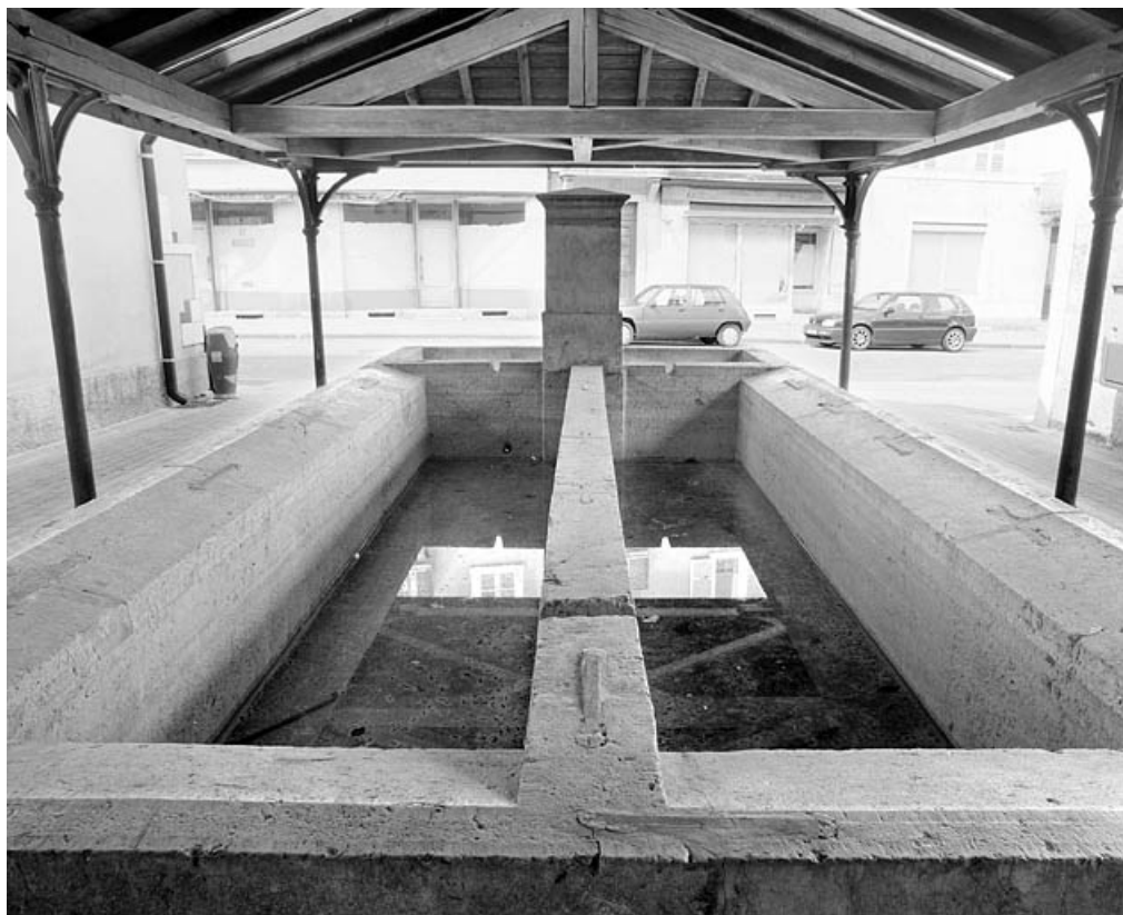
Bassin côté lavoir, vu de face.