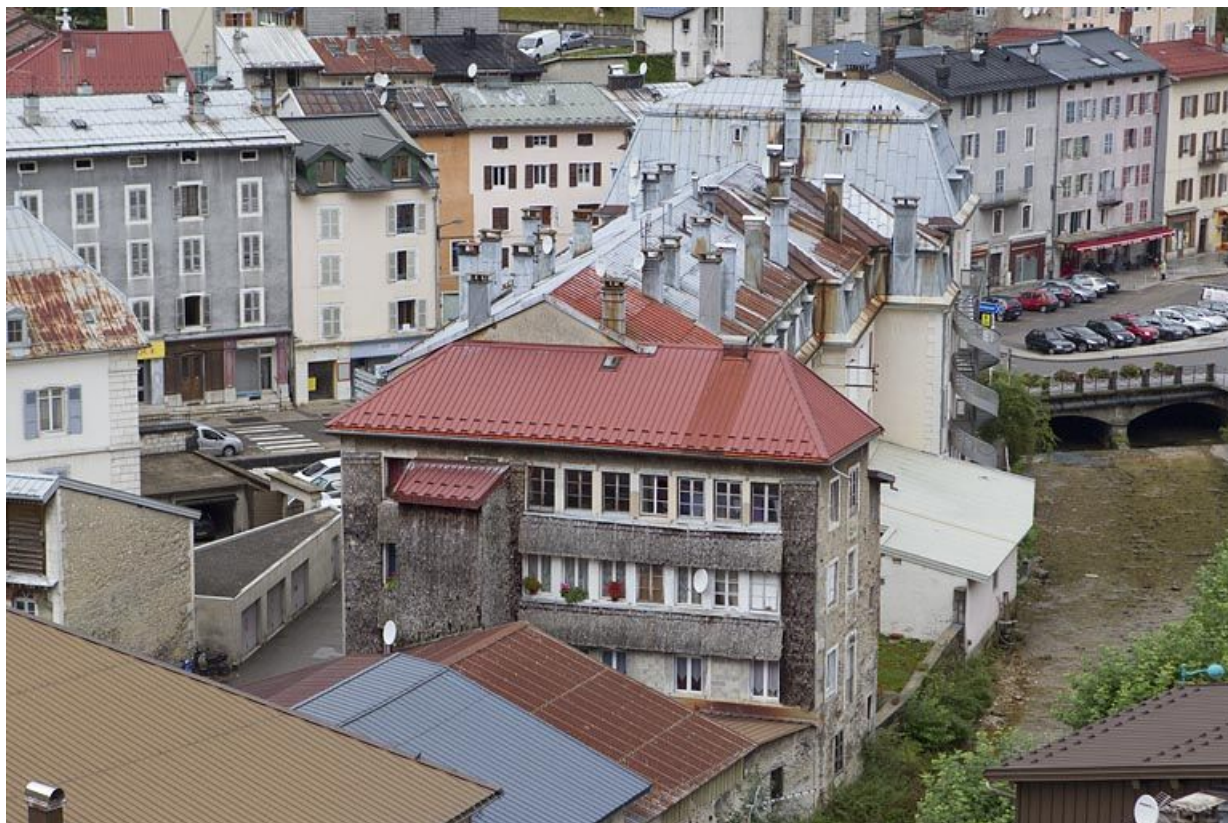
Vue d'ensemble plongeante, depuis l'est.