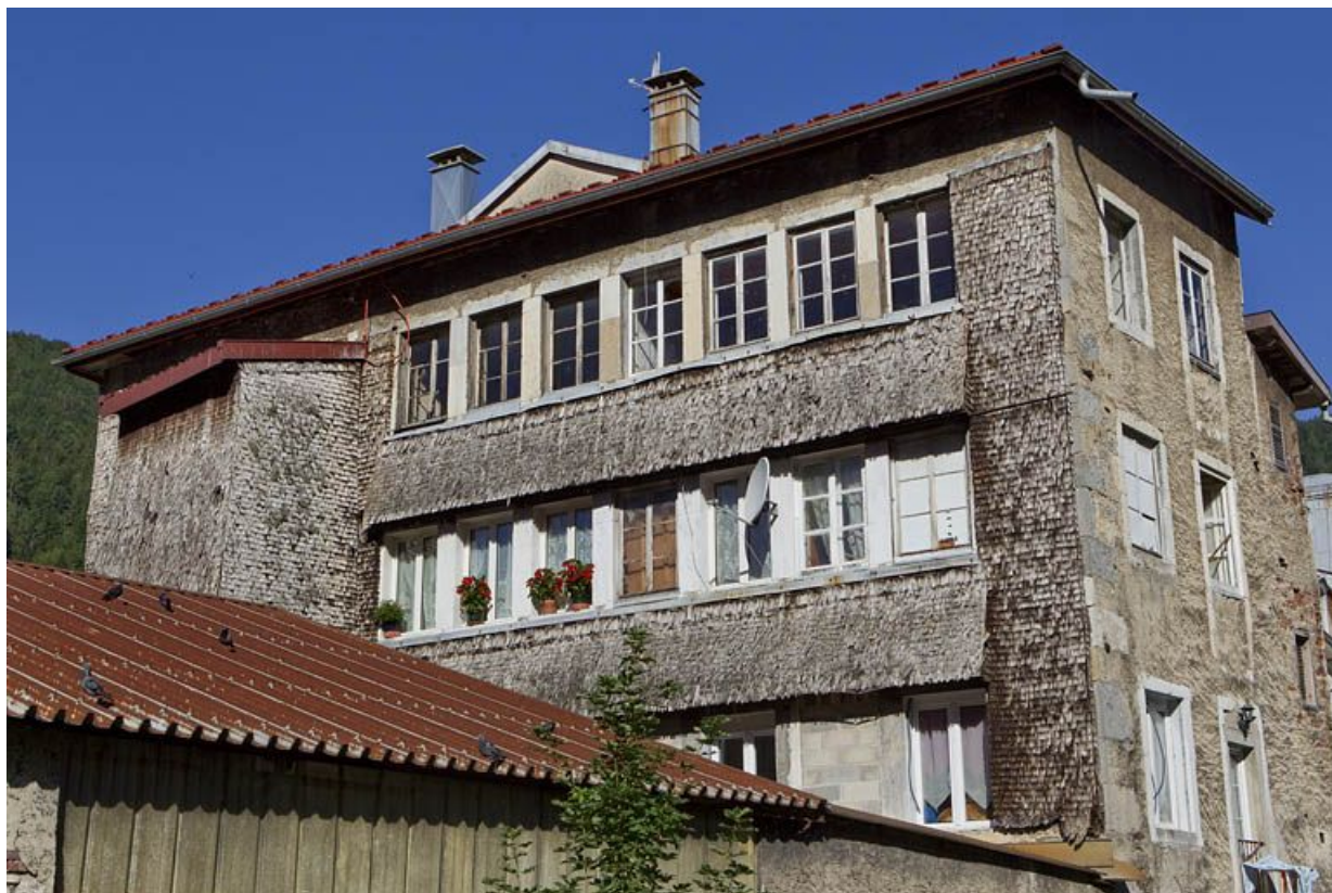
Ancien atelier de lunetterie (5 rue du Docteur Regad) : baies multiples et essentage de tavaillons.