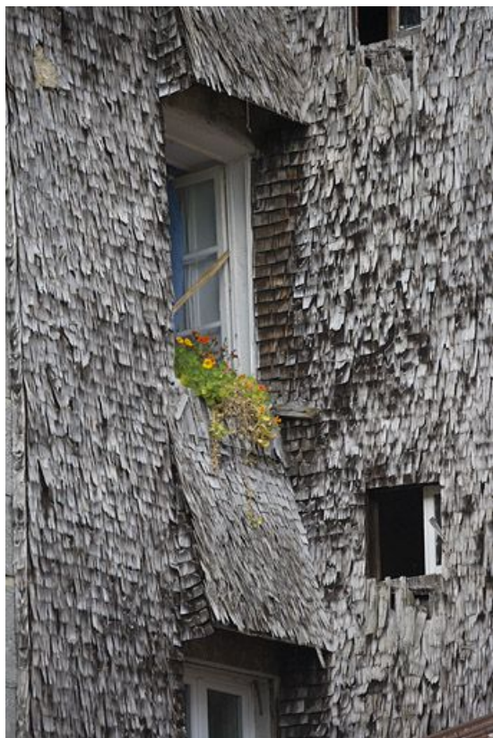
Détail des tavaillons et de la protection des fenêtres.