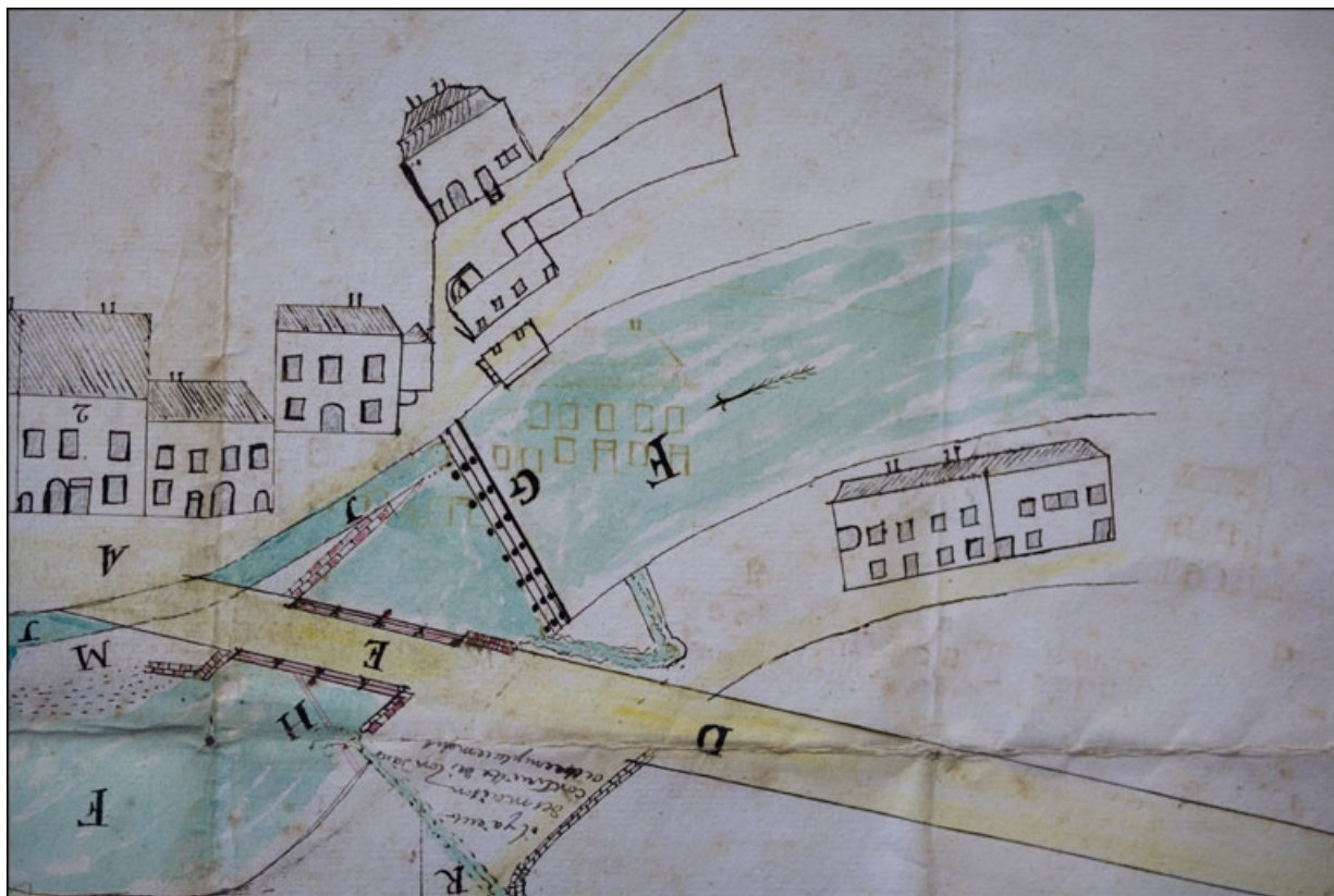
Plan [du moulin Chavin et du quartier de la place du Marché] fait par Pierre Augustin Roche de Morez [détail], 1782. 39, Morez, 1-3 rue du Docteur Regad