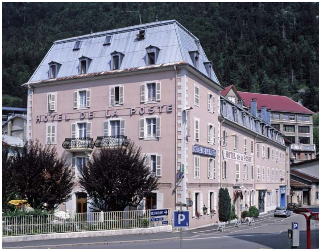
Vue d'ensemble, depuis le sud-ouest. 39, Morez, 1-3 rue du Docteur Regad