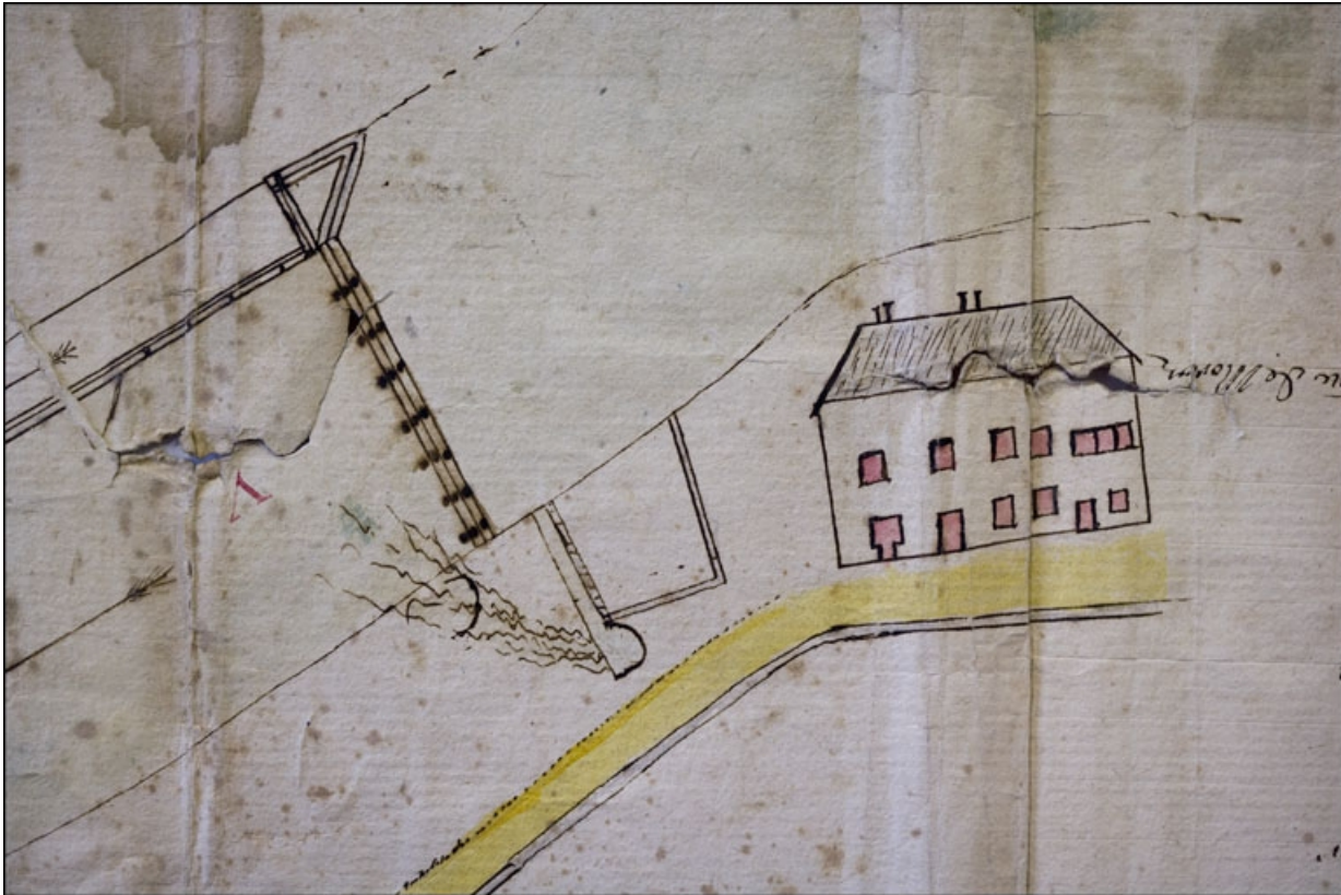
Plan d'un chemin qui conduit à l'Eglise de Morez contester par les Srs Couchet du mame lieu. Voyer au rentvoyr alephabétique [voyez au renvoi alphabétique]. A Morez 1777 [détail]