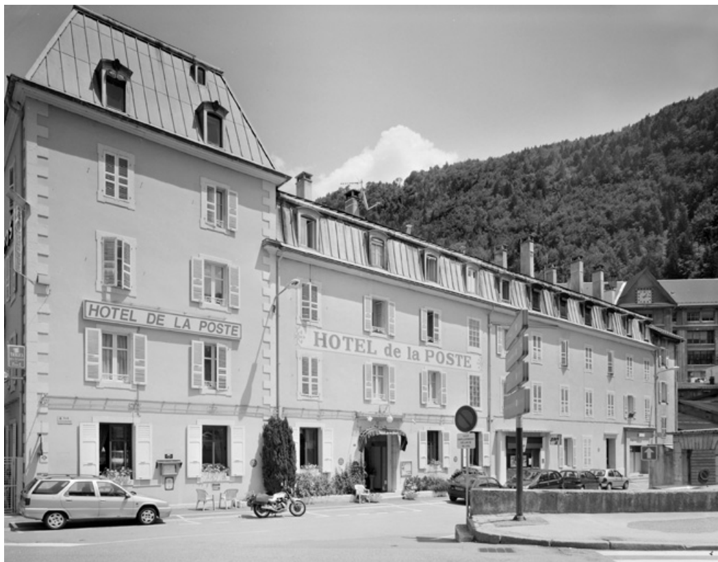
Façade antérieure, de trois quarts gauche.