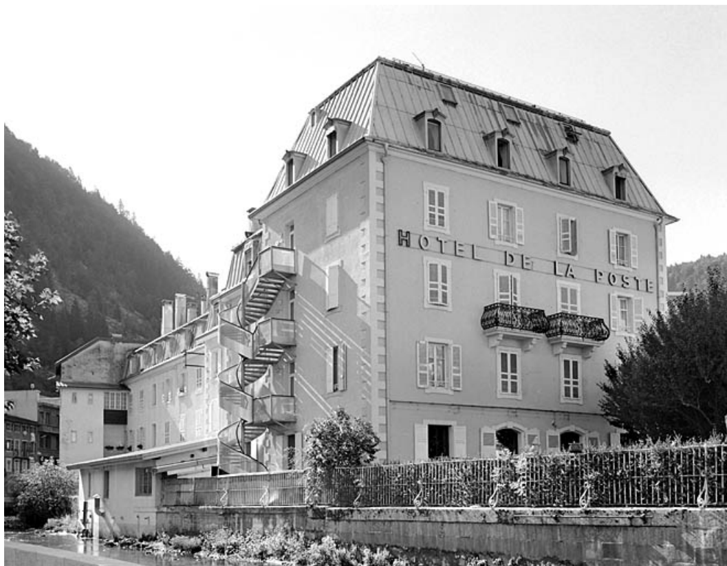
Façade postérieure, de trois quarts droite.