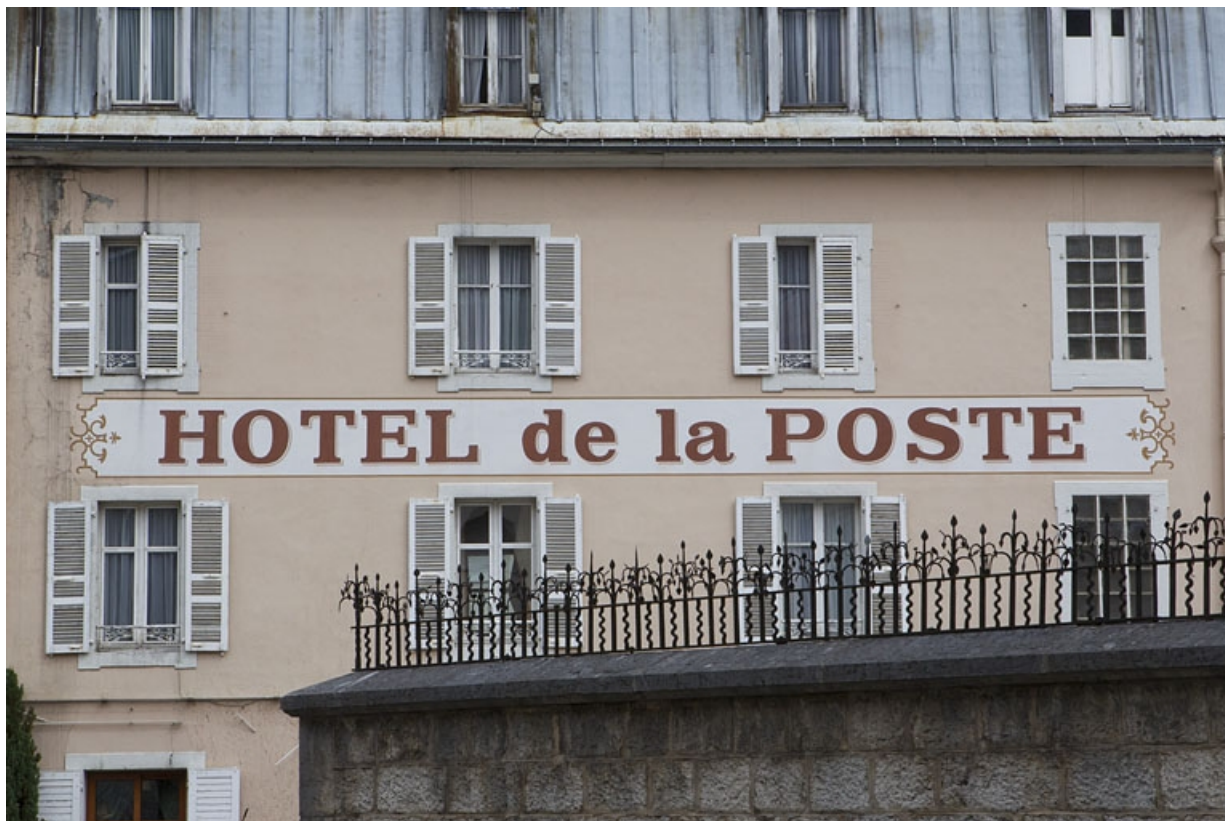
Partie ouest : enseigne sur la façade antérieure.