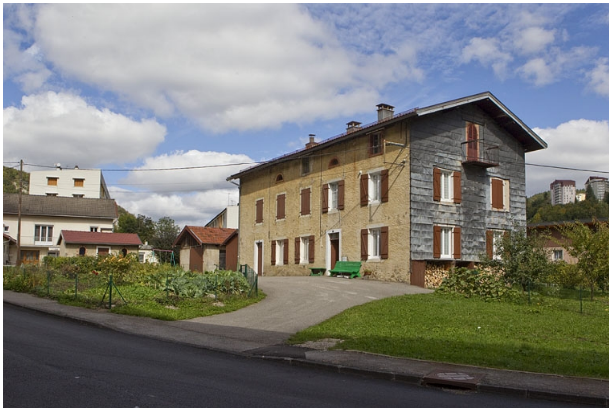
Vue d'ensemble, depuis le sud.