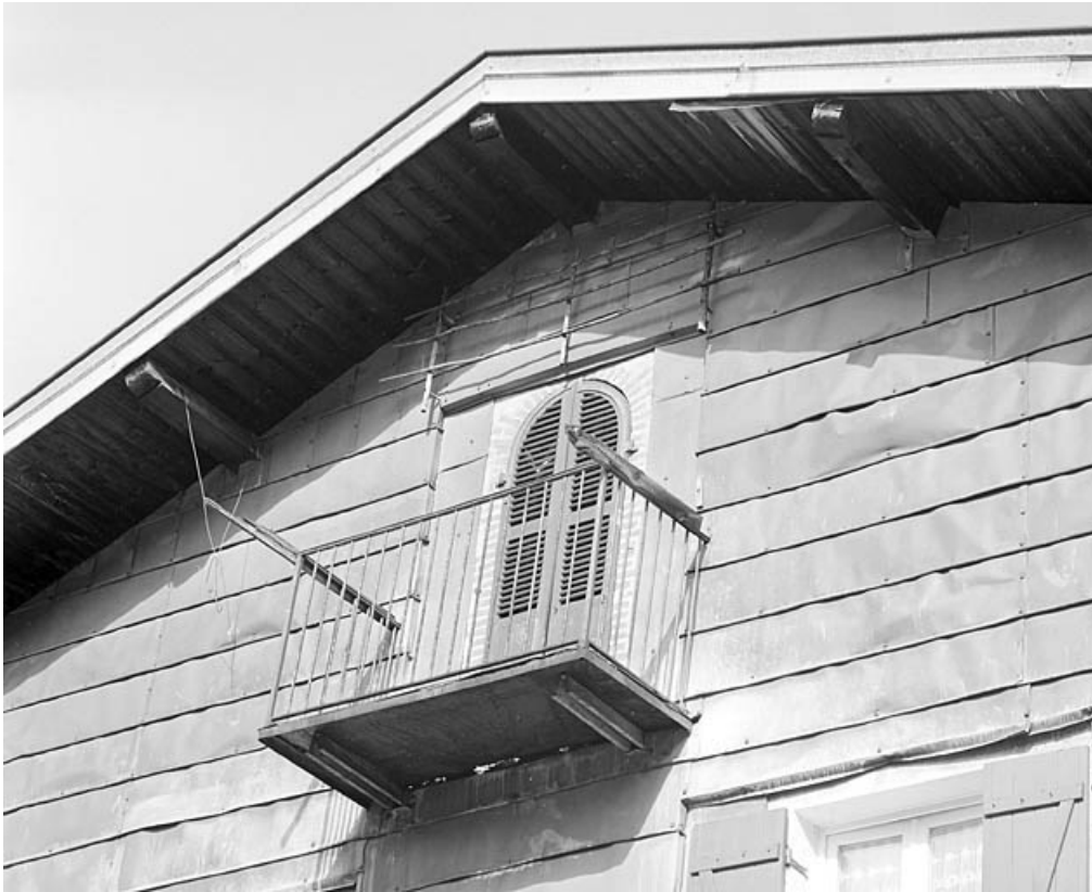
Façade latérale droite : porte haute et balcon.