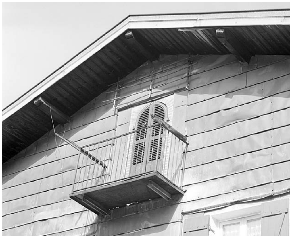
Façade latérale droite : porte haute et balcon.