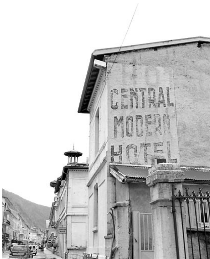
Enseigne peinte sur l'élévation latérale droite.