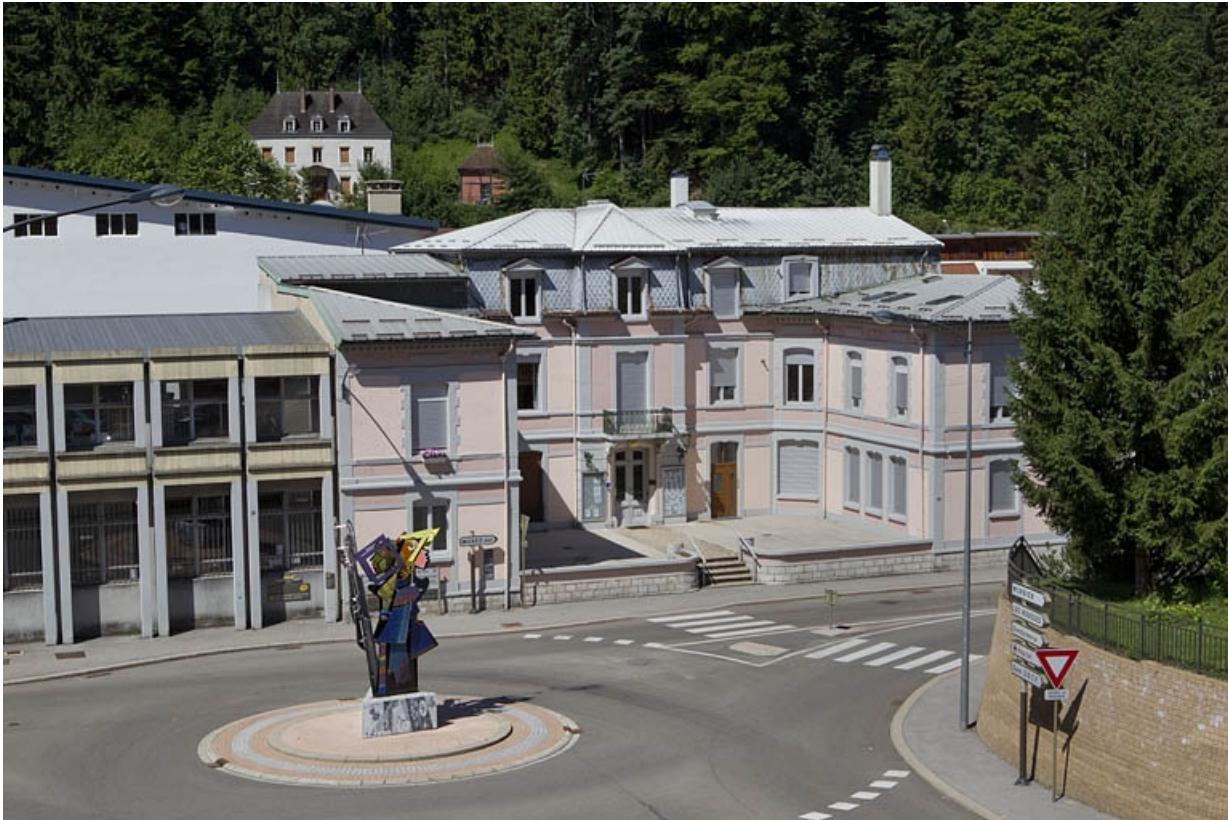
Vue d'ensemble plongeante, depuis l'est.