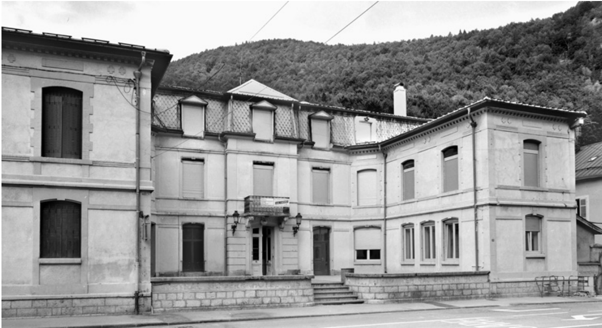
Vue d'ensemble rapprochée, de trois quarts gauche.