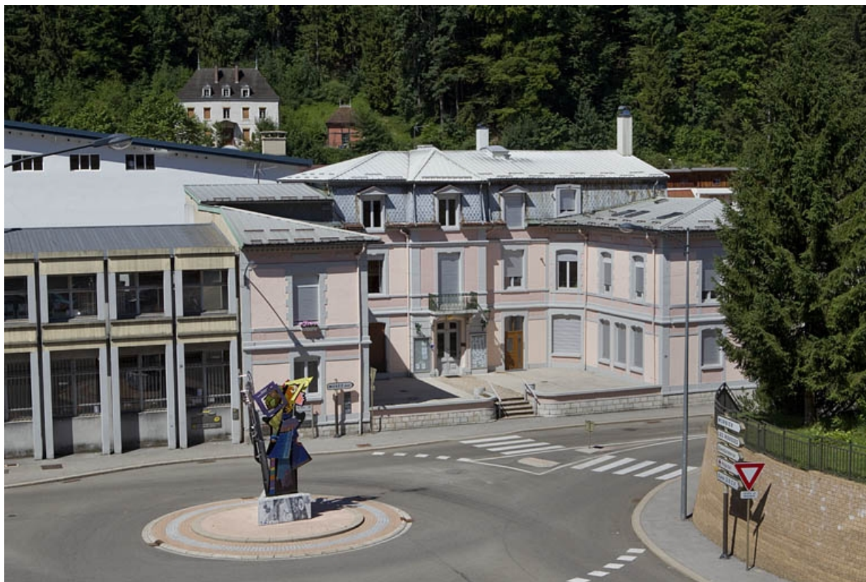
Vue d'ensemble plongeante, depuis l'est.