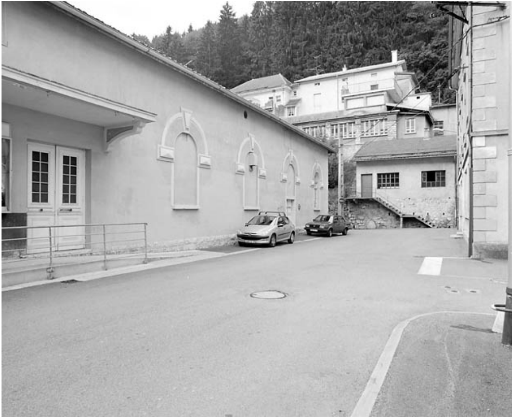
Élévation antérieure, de trois quarts gauche.