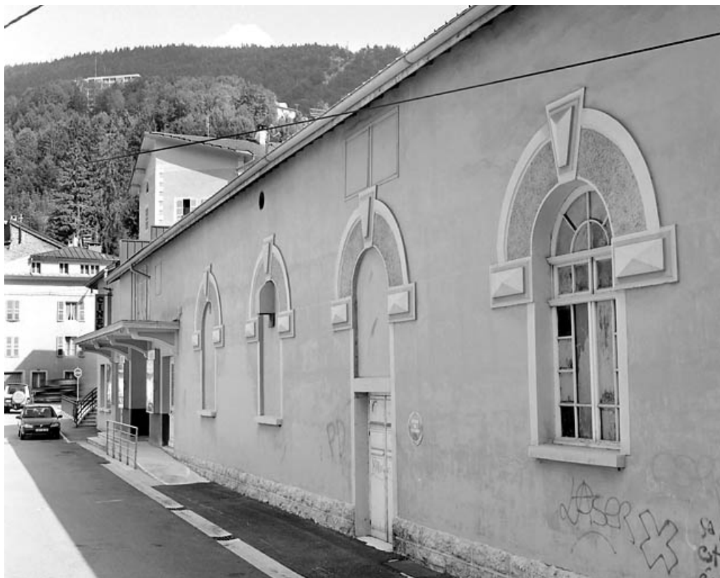
Élévation antérieure, de trois quarts droite (vue rapprochée).