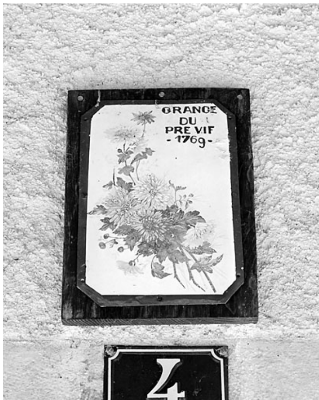
Plaque émaillée surmontant l'entrée.

39, Morez, 4 chemin du Pré vif, lieudit : le Pré vif