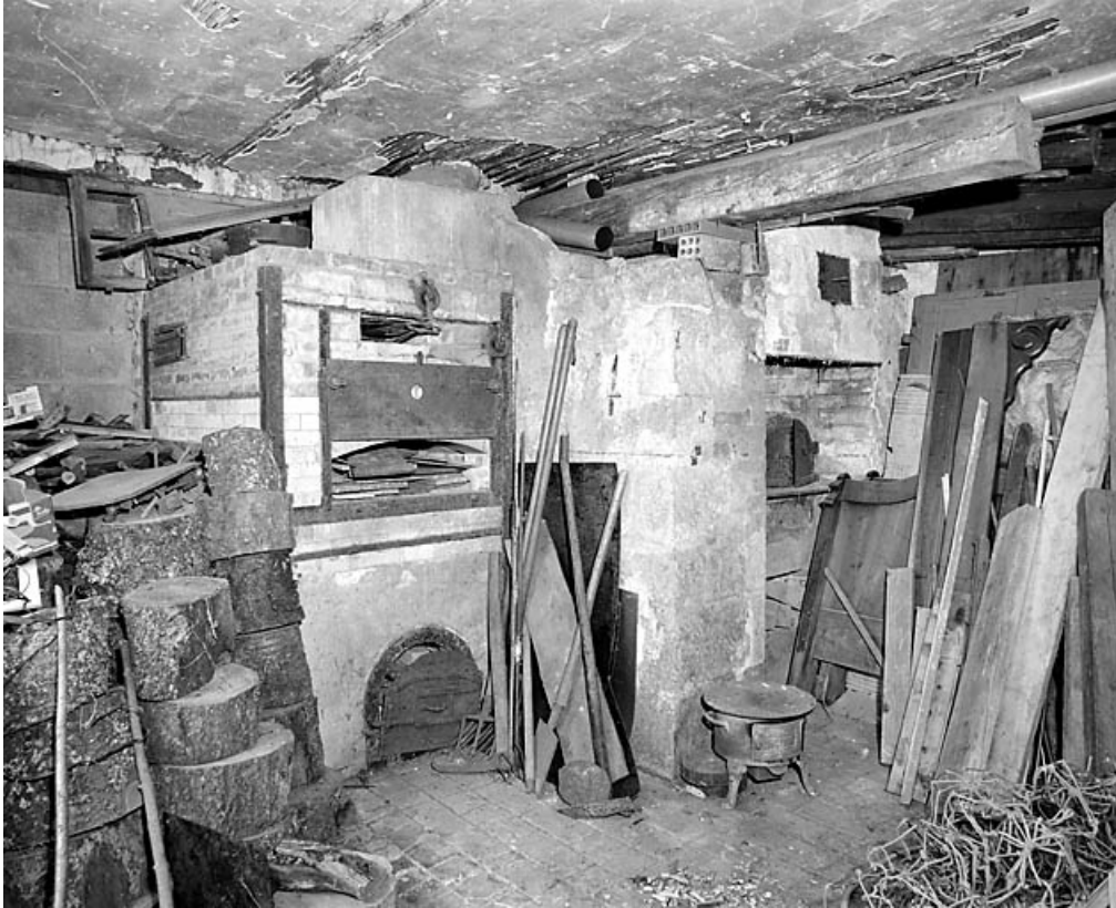
Les fours. Four d'émailleur à gauche, four à pain à droite.

39, Morez, 4 chemin du Pré vif, lieudit : le Pré vif