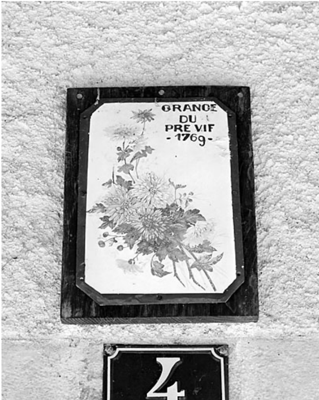
Plaque émaillée surmontant l'entrée.

39, Morez, 4 chemin du Pré vif, lieudit : le Pré vif