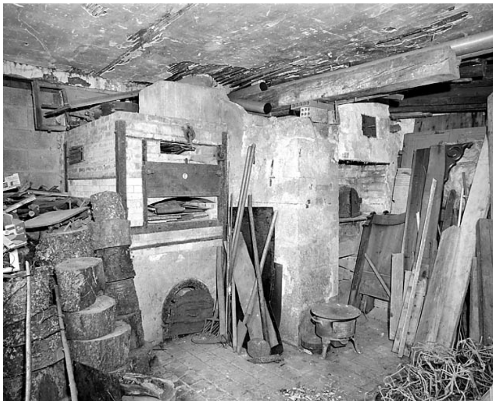
Les fours. Four d'émailleur à gauche, four à pain à droite.

39, Morez, 4 chemin du Pré vif, lieudit : le Pré vif