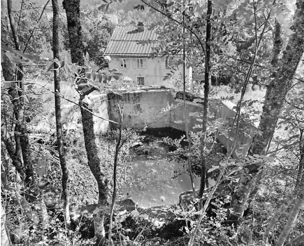
Vue plongeante sur la façade antérieure, depuis un réservoir à l'ouest.

39, Morez, 2 chemin du Pré vif, lieudit : le Pré vif