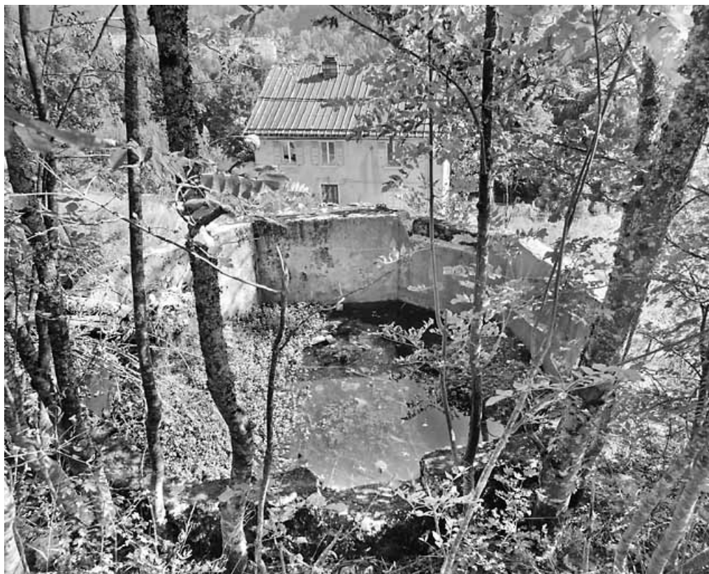
Vue plongeante sur la façade antérieure, depuis un réservoir à l'ouest.

39, Morez, 2 chemin du Pré vif, lieudit : le Pré vif