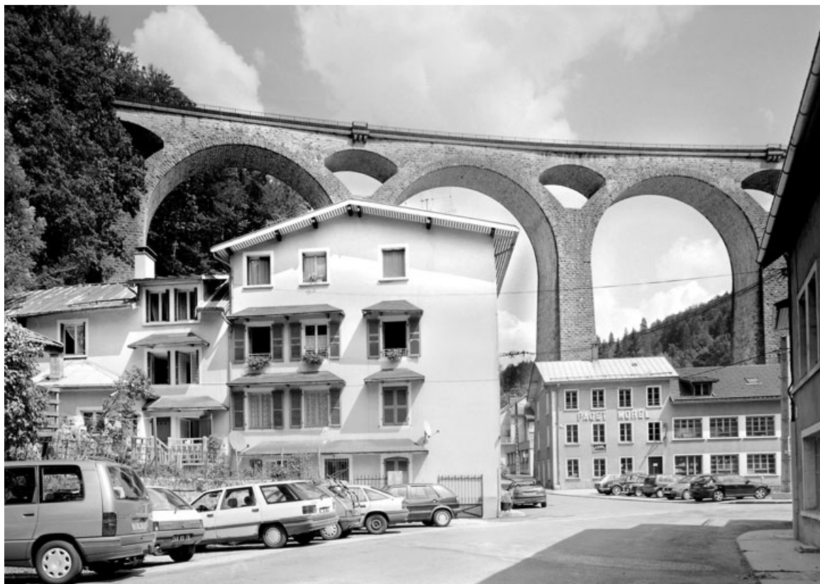
Élévation latérale gauche. 39, Morez, 1 rue Voltaire