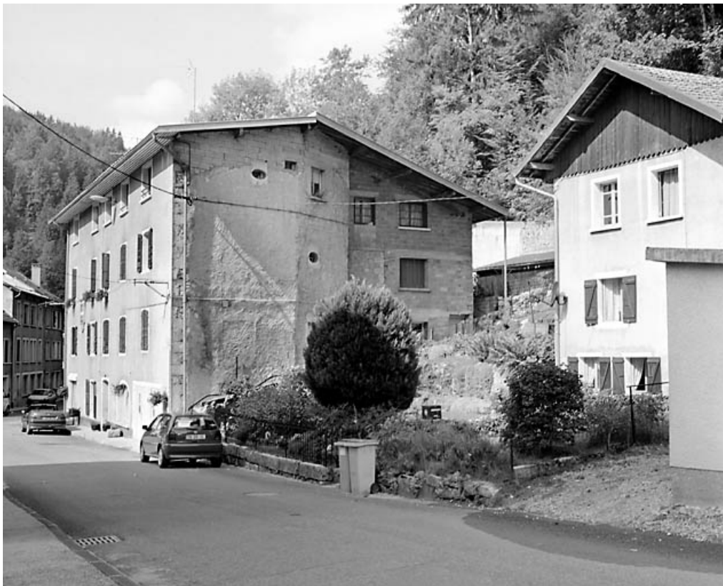
Elévation latérale droite.