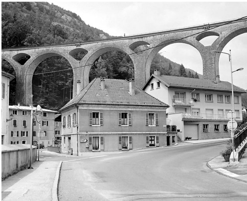
Vue d'ensemble rapprochée, depuis le sud.