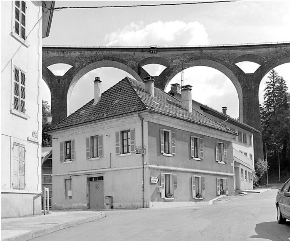
Façades antérieure et latérale gauche.