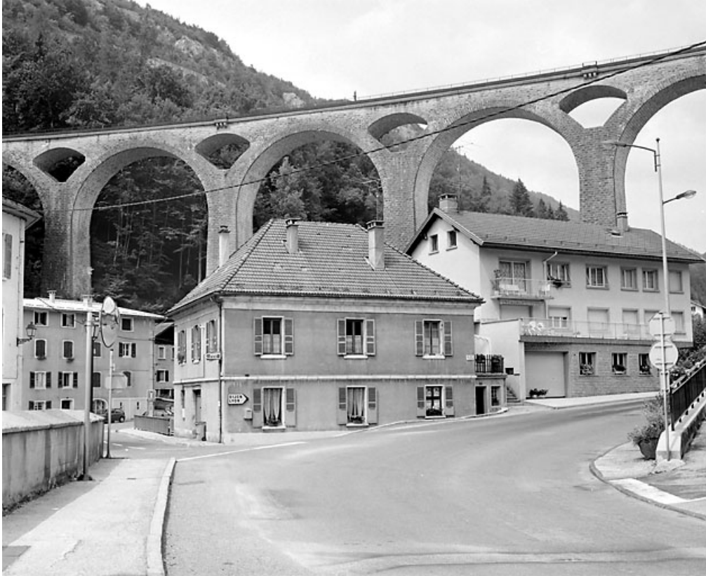
Vue d'ensemble rapprochée, depuis le sud.