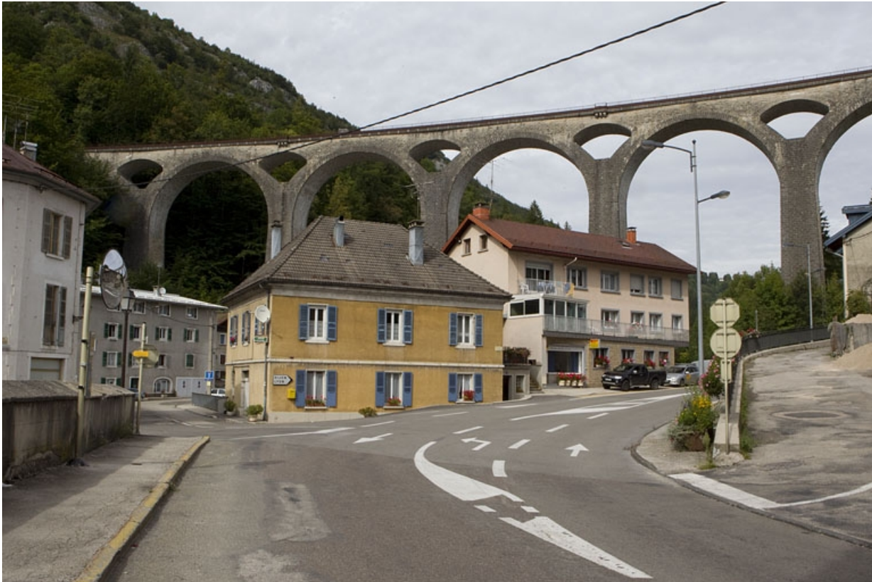
Vue d'ensemble, depuis le sud.