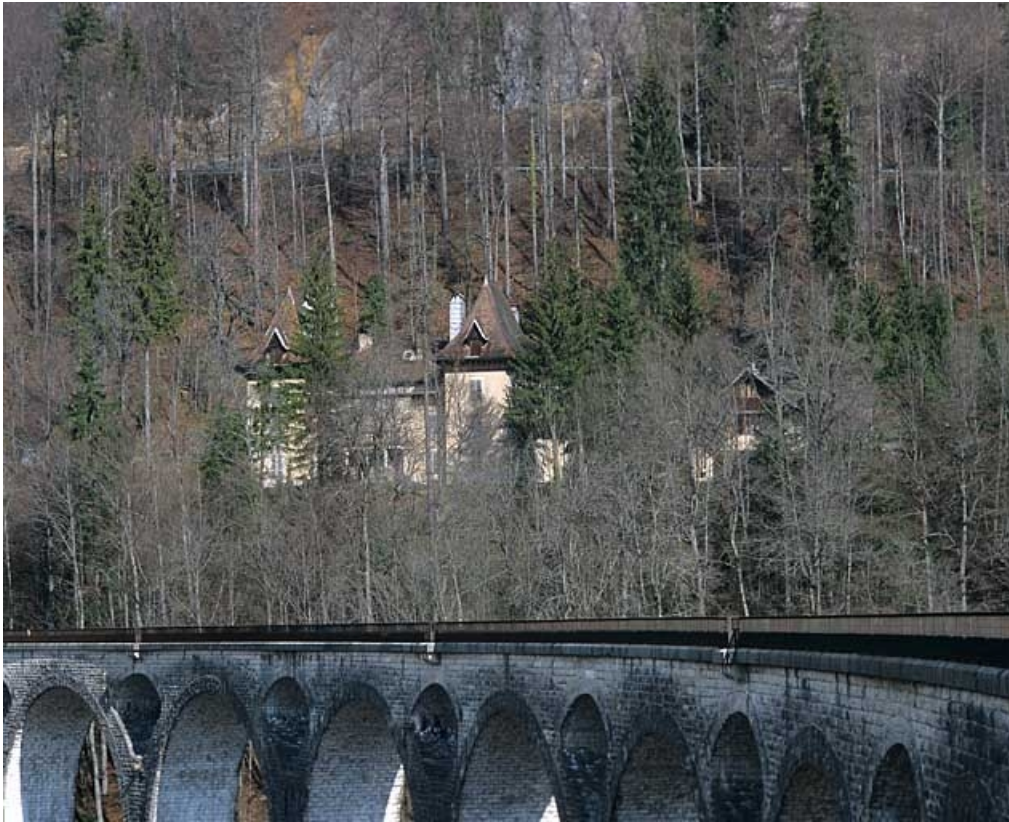
Vue d'ensemble rapprochée, depuis le sud-est.

39, Morez rue Voltaire, lieudit : les Essards