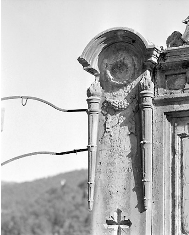
Torches, guirlande et couronne mortuaire.

39, Morez, 10 allée du 3 Septembre, lieudit : cimetière, quartier 2