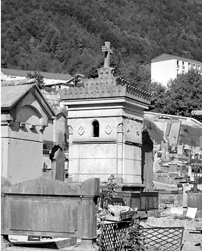
Elévations postérieure et latérale droite.

39, Morez, 10 allée du 3 Septembre, lieudit : cimetière, quartier 4