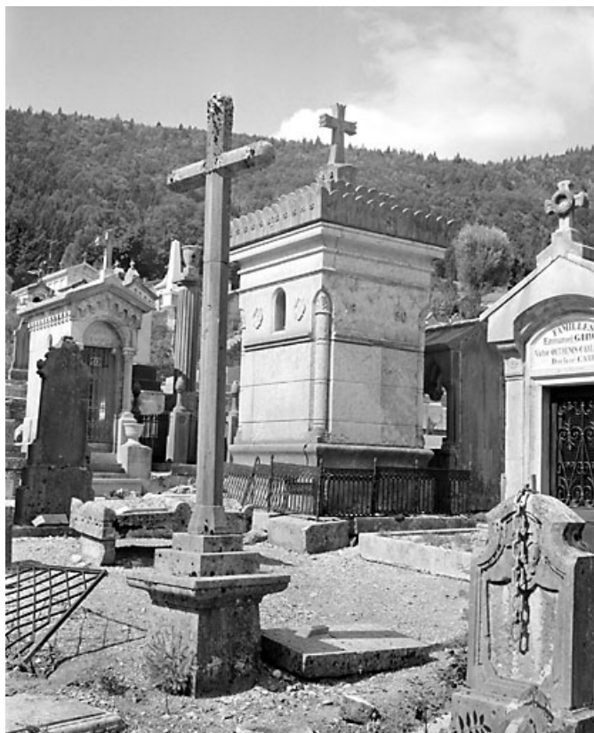
Vue d'ensemble des élévations postérieure et latérale gauche.

39, Morez, 10 allée du 3 Septembre, lieudit : cimetière, quartier 4