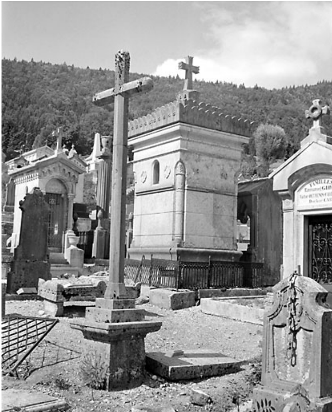
Vue d'ensemble des élévations postérieure et latérale gauche.

39, Morez, 10 allée du 3 Septembre, lieudit : cimetière, quartier 4